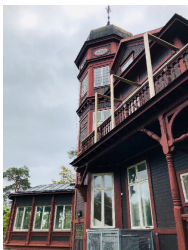
Villa Gadelius norra fasad