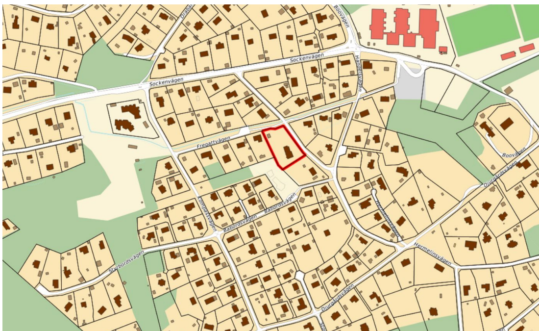
Fastighetens läge i området. Aktuell fastighet markerad med rött. Fastighetsgränser i svart.

upphävas för att tillskapa fler fastigheter inom gällande detaljplan. Aktuell fastighet förhåller på ett likartat sätt sig till ett antal fastigheter inom gällande detaljplan i fråga om tomtstorlek och beskaffenhet. Ett positivt planbesked skulle innebära ett principiellt beslut som i sin tur möjliggör att ytterligare cirka 7 fastigheter inom detaljplanen skulle kunna styckas för att tillskapa fastigheter på 1100–1200 kvadratmeter. Detta i enlighet med gällande detaljplans bestämmelser om minsta tomtstorlek. De tillkommande fastigheterna skulle bidra till en förändring av områdets karaktär och konsekvenser på bland annat andel hårdgjorda ytor, bevarad vegetation, påverkan på trafik och dagvattenflöden. Sammantaget innebär det konsekvenser som bör prövas för flera fastigheter i ett sammanhang.