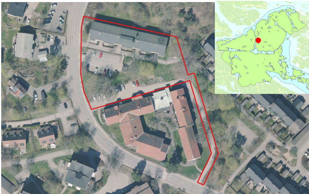
Kartan visar områdets avgränsning. Den lilla kartan visar var i Nacka kommun området ligger.