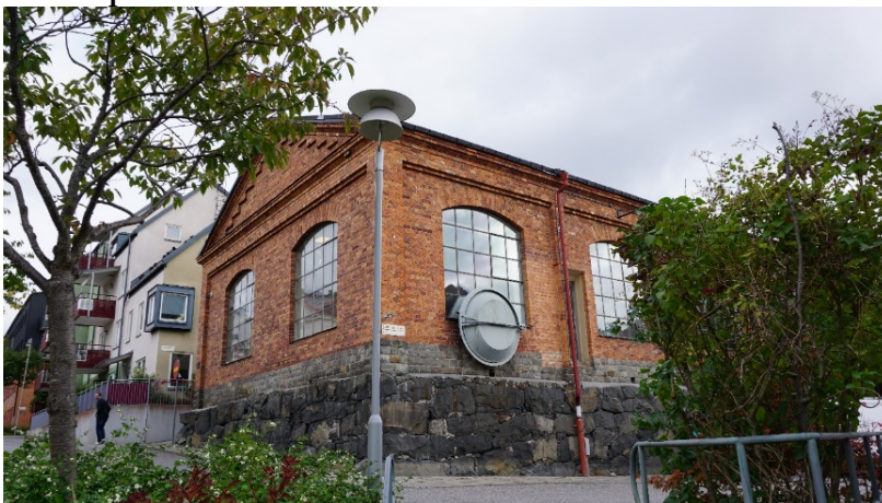
Pumpprovningshuset, byggnadens västergavel och del av södra fasaden med den tunga stensockeln och rusningstrumman i fönstret.