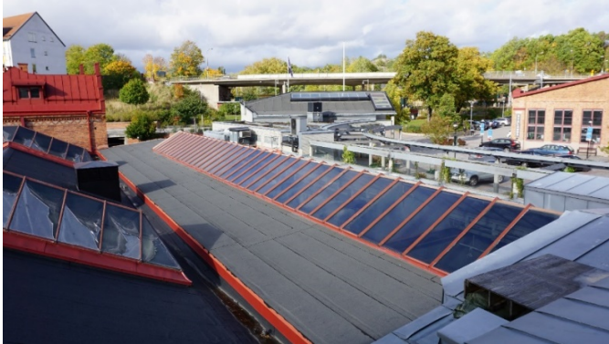
Lagerhallen med sina stora lanterniner till vänster och järnvägshallen till höger. Vy från turbinhallen i öst.

Den f.d. lagerbyggnaden är en del av den ursprungliga industrianläggningen som uppfördes 1896. Den så kallade järnvägshallen tillkom 1939. 1946 försågs lagerbyggnaden med nya, större taklanterniner. Järnvägshallens västra fasad, där entrén till Lavalhallen nu ligger, är synlig från utsidan. I övrigt är byggnaden synlig endast genom sina taklanterniner. Lagerbyggnaden och järnvägshallen har genom ombyggnader förlorat en stor del av sin ursprungliga utformning. Den ursprungliga byggnadsvolymen finns dock fortfarande kvar, och de bevarade taklanterninerna är viktiga för förståelsen av byggnadens tidigare funktion.