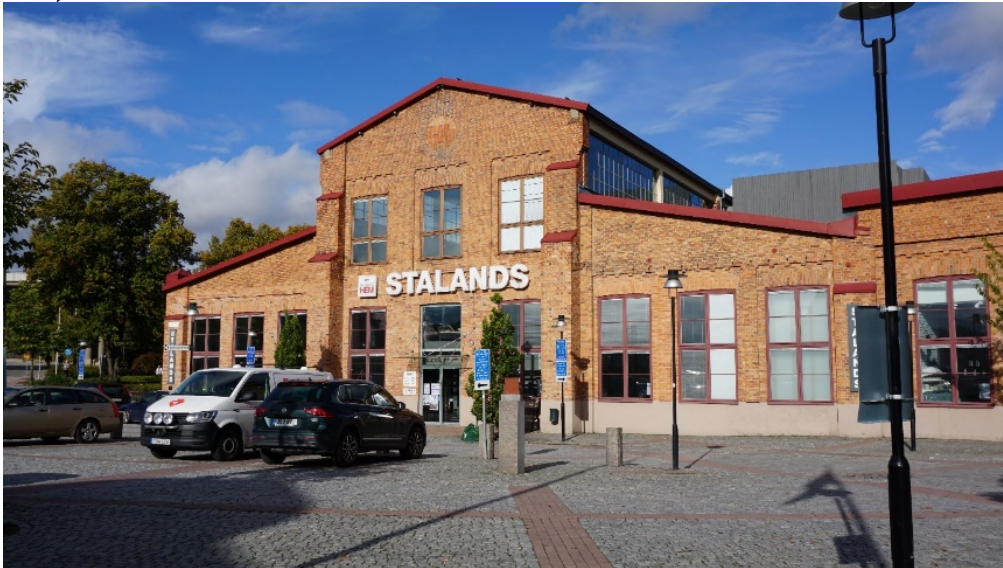
Byggnaden sett från Gustav de Laval's torg.

Byggnaden som uppfördes 1917 utgör en betydelsefull del av industribebyggelsen i området. Byggnadens exteriör har restaurerats med stor hänsyn till de kulturhistoriska värdena och en stor del av den stora öppna rumsvolymen, byggnadens stomme, takkonstruktion och travers har behållits vid den inre ombyggnaden. Byggnaden bedöms som kulturhistoriskt särskilt värdefull enligt plan- och bygglagen 8 kap. 13 §.