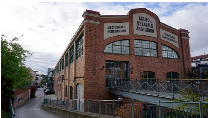
Turbinhallens norra och östra fasader.

Byggnaden är en del av den ursprungliga industrianläggningen och var vid uppförandet 1911 områdets mest representativa industribyggnad. Den nära 200 meter långa monteringshallen uppfördes med för tiden mycket modern konstruktion. Förändringar och tillägg har skett från olika tider men konstruktionen är fortfarande tydligt avläsbar på de