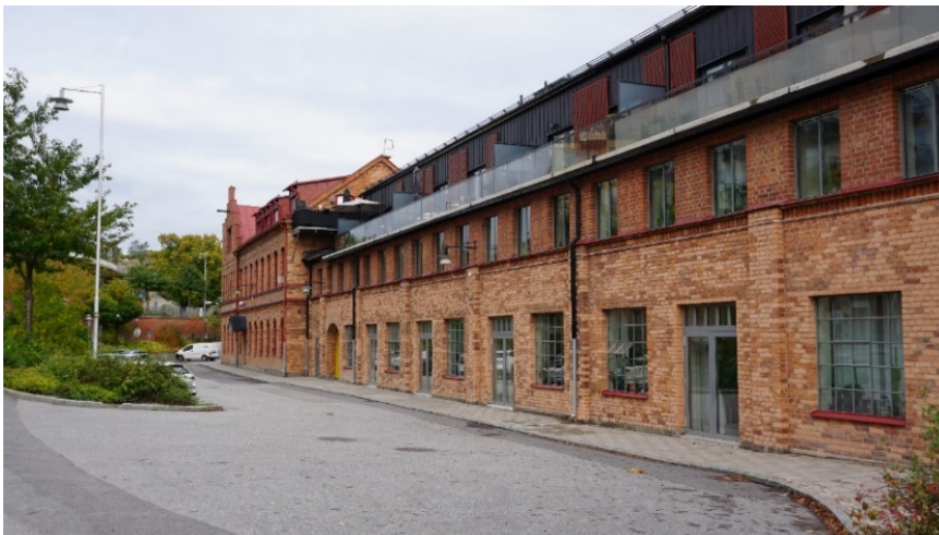
Bilden visar byggnadens tegelfasad mot väster med äldre industrifönster samt senare påbyggnader.