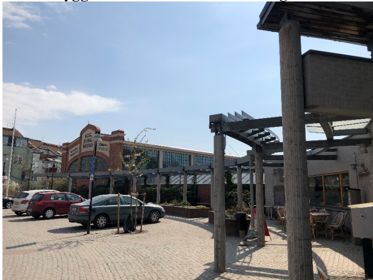
Gustav de Laval's torg, vy från väster mot turbinhallen, pergolan och entrébyggnaden.

Gustaf de Laval's torg fungerar som ett entrétorg till området och skapades i samband med att området omvandlades i början av 2000-talet. Torgets gestaltning med pergola och småskaliga entrébyggnad konkurrerar inte med den äldre industrimiljön, och är tydligt avläsbar som en ny årsring.