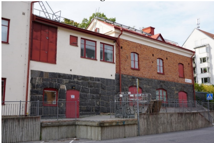
Kontorsbyggnaden, vy från söder.

Denna mindre byggnad hör till den ursprungliga industrianläggningen som uppfördes för läderfabriken år 1888. Byggnaden utgör en betydelsefull del av industriebyggnaden i Järla sjö. Byggnaden är den äldsta bevarade i området och har behållit sin ursprungliga karaktär. Byggnaden bedöms som kulturhistoriskt särskilt värdefull enligt plan- och bygglagen 8 kap. 13 §.