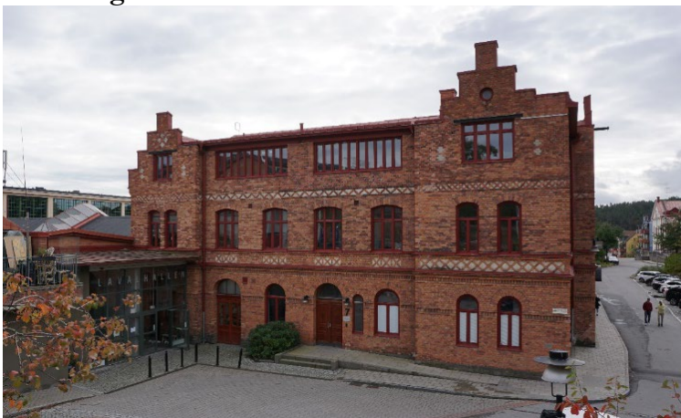
Ritningskontorets fasad mot norr.

Byggnaden är en del av den ursprungliga industrianläggningen som uppfördes 1896 och är en av karaktärsbyggnaderna i Järla sjö. Byggnaden har i stort behållit sin ursprungliga