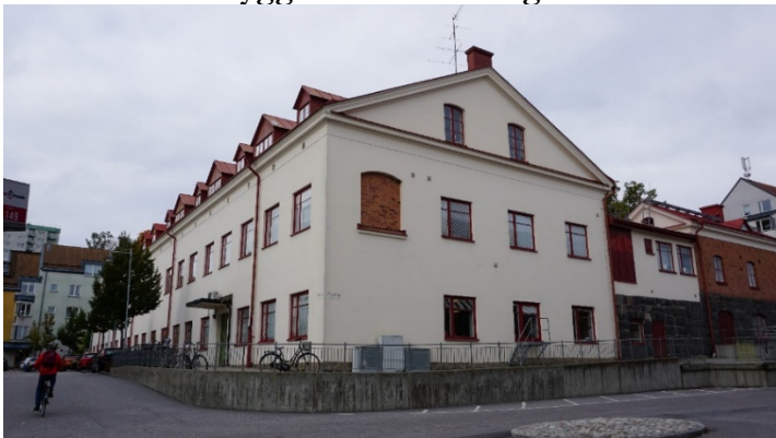
Byggnaden med vy från sydost. Den igensatta fönsteröppningen visar de ursprungliga fönsterformerna.