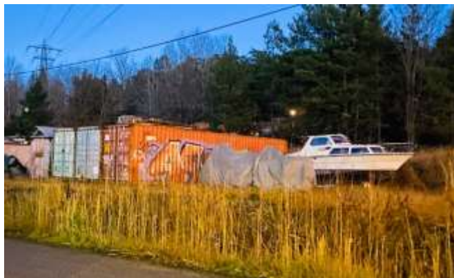
Bild 2, upplag i form av två båtar, 19 november 2020

Den 19 november 2020 gjorde representant från bygglovenheten ett tillsynsbesök på det aktuella området. Vid besöket framgick att den gula mobilkranen och de två containrar som saknade lov nu var bortforslade från fastigheten. Två båtar på båttrailers hade tillkommit på platsen, se bilden nedan, till höger om den röda containern. Den ena båten ligger under en grå presenning. Arean för upplaget är sammanlagt 15 kvadratmeter. Ingen ansökan om bygglov har inkommit till bygglovenheten för dessa upplag.