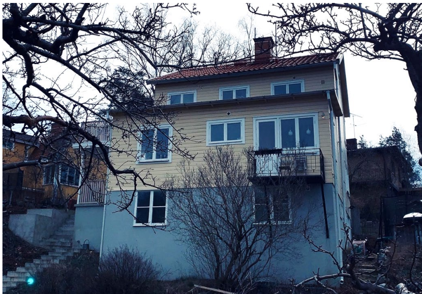
Befintlig huvudbyggnad, vy från Skogalundsvägen

Befintlig huvudbyggnad har idag ett planstridigt utgångsläge gällande placering och antal våningar. Byggnaden är delvis placerad på så kallad prickmark, mark som inte får bebyggas, enligt gällande byggnadsplan. Cirka 17 kvadratmeter av byggnaden ligger inom prickmark. Byggnaden är även planstridig avseende minsta avstånd till fastighetsgräns mot Klyvarevägen. Vidare är byggnaden planstridig gällande våningsantalet. Gällande byggnadsplan tillåter två våningar och befintlig byggnad är utförd i tre våningar, enligt dagens juridiska tolkning av begreppet våning.