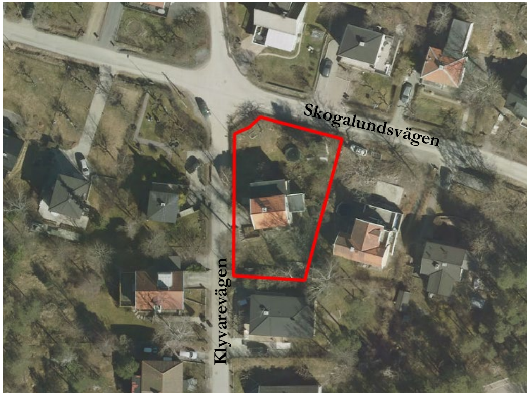
Kartan visar ett flygfoto över planområdet. Röd linje anger planområdets gräns och fastighetsgräns för Sicklaön 184:1.