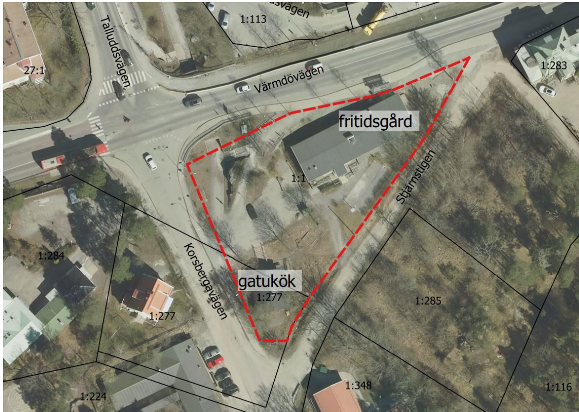
Kartan visar ett flygfoto över planområdet. Röd linje anger gräns för upphävande av del av stadsplanen S70.