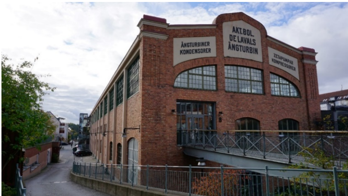
Turbinhallens norra och östra fasader.

Byggnaden är en del av den ursprungliga industrianläggningen och var vid uppförandet 1911 områdets mest representativa industribyggnad. Den nära 200 meter långa monteringshallen uppfördes med för tiden mycket modern konstruktion. Förändringar och tillägg har skett från olika tider men konstruktionen är fortfarande tydligt avläsbar på de