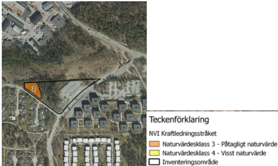
Utdrag ur NVI för "Kraftledningsstråket" maj 2020 Pro Natura

Skogsstyrelsen har kommuntäckande inventerat bl.a. skogliga värden i form av nyckelbiotoper och naturvärde. Inga av dessa kategorier har identifierats inom planområdet.