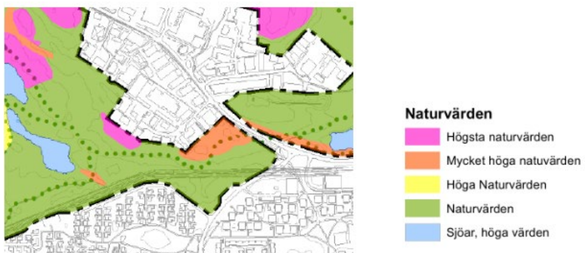
Översiktlig NVI för Skarpnäs naturreservat 2016 Skogsstyrelsen