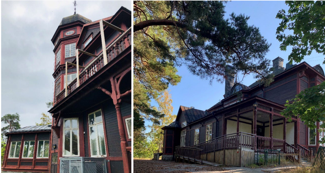
Figur 3 & 4. Villa Gadelius norra fasad (t.v.) samt västra fasad (t.h).

använts som förskola, ateljé, ungdomsgård och som boende för flyktingfamiljer. I dagsläget står byggnaden tom på grund av dess dåliga skick.