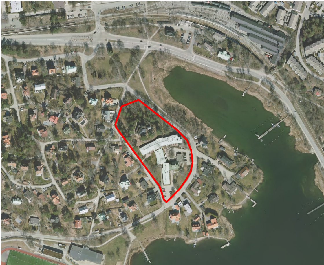
Figur 1: Kartan visar ett flygfoto över planområdet. Röd linje anger planområdets ungefärliga gräns.