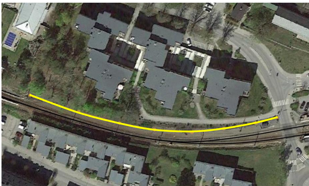
Figur 3. Placering på bullerskyddsskärm (GUL-linje). 155 meter lång och 3 meter hög.

För att klara riktvärde för samtliga lägenheter krävs en cirka tre meter hög och 155 meter lång bullerskyddsskärm.