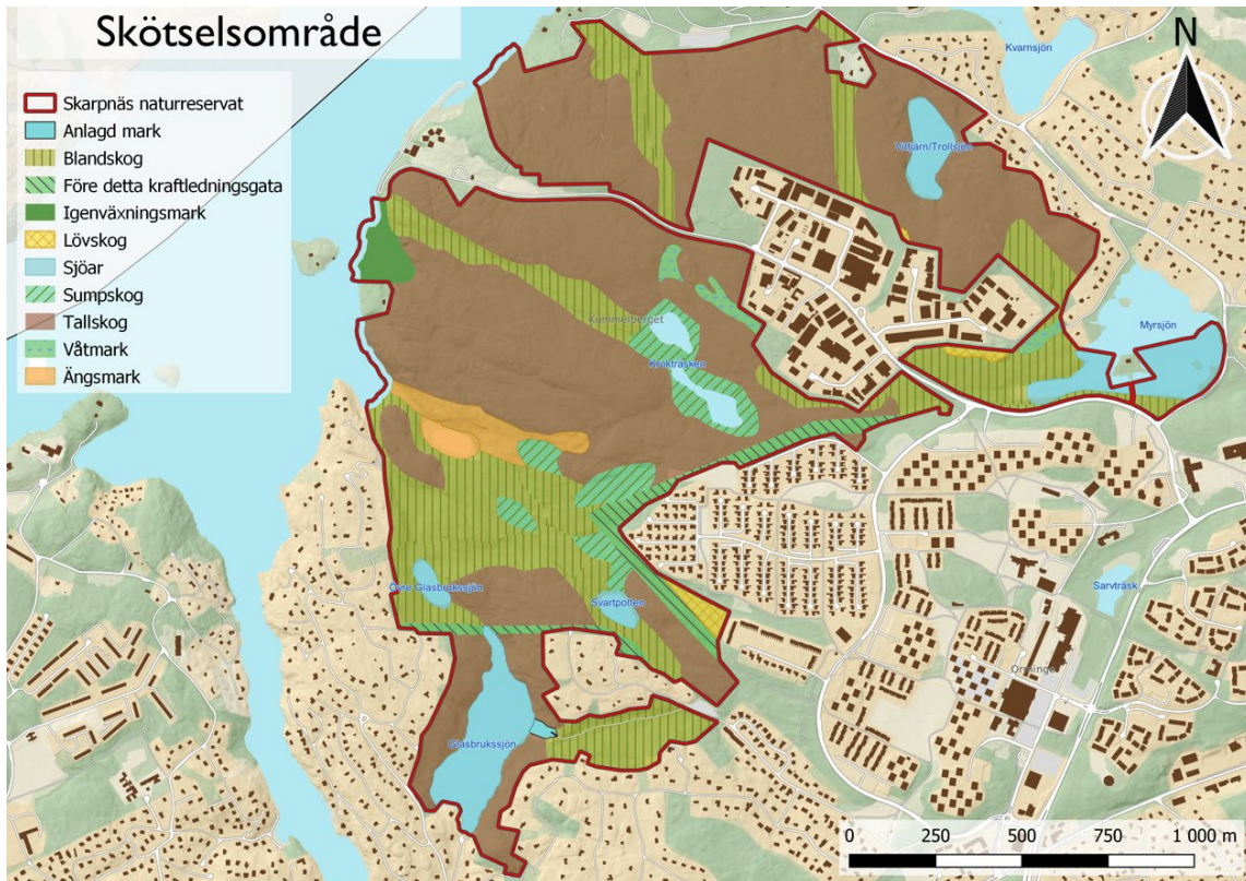
Naturmark inom Skarpnäs naturreservat (från skötselplan för Skarpnäs naturreservat)