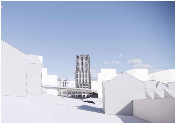
Högdelen sedd från Järla sjö bostadsområde. Bild: Semrén & Månsson, 2021