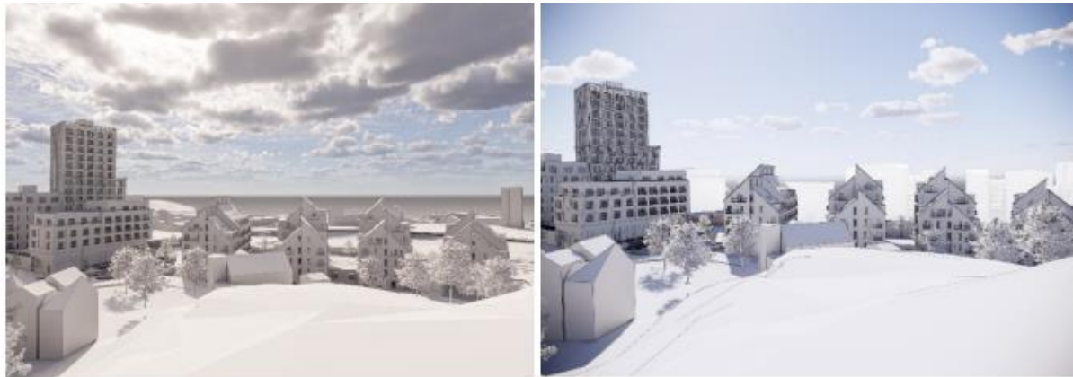
Utsikten från Birkaberget över Järlasjön och Nackareservatet vid genomfört planförslag. Birkaberget är ett omtyckt utflyktsmål för närboende i Birka och Finnorp. Utsikten över Järlasjön blir förändrad men sjön är fortfarande synlig. Bild till vänster: Utsikten vid genomfört planförslag. Bild till höger: Vita byggnader i fonden ingår i strukturplanen men har ingen lagakraftvunnen detaljplan.

Vad gäller detaljplaneprogrammet så anger det att Järila-Birkaområdets siluett ska beaktas. Planenheten bedömer att områdets siluett söderut beaktas av förslaget genom att siluetten fortfarande kommer att vara avläsbar söderifrån, genom de öppningar förslaget medger, även om siluetten till viss del skymms.