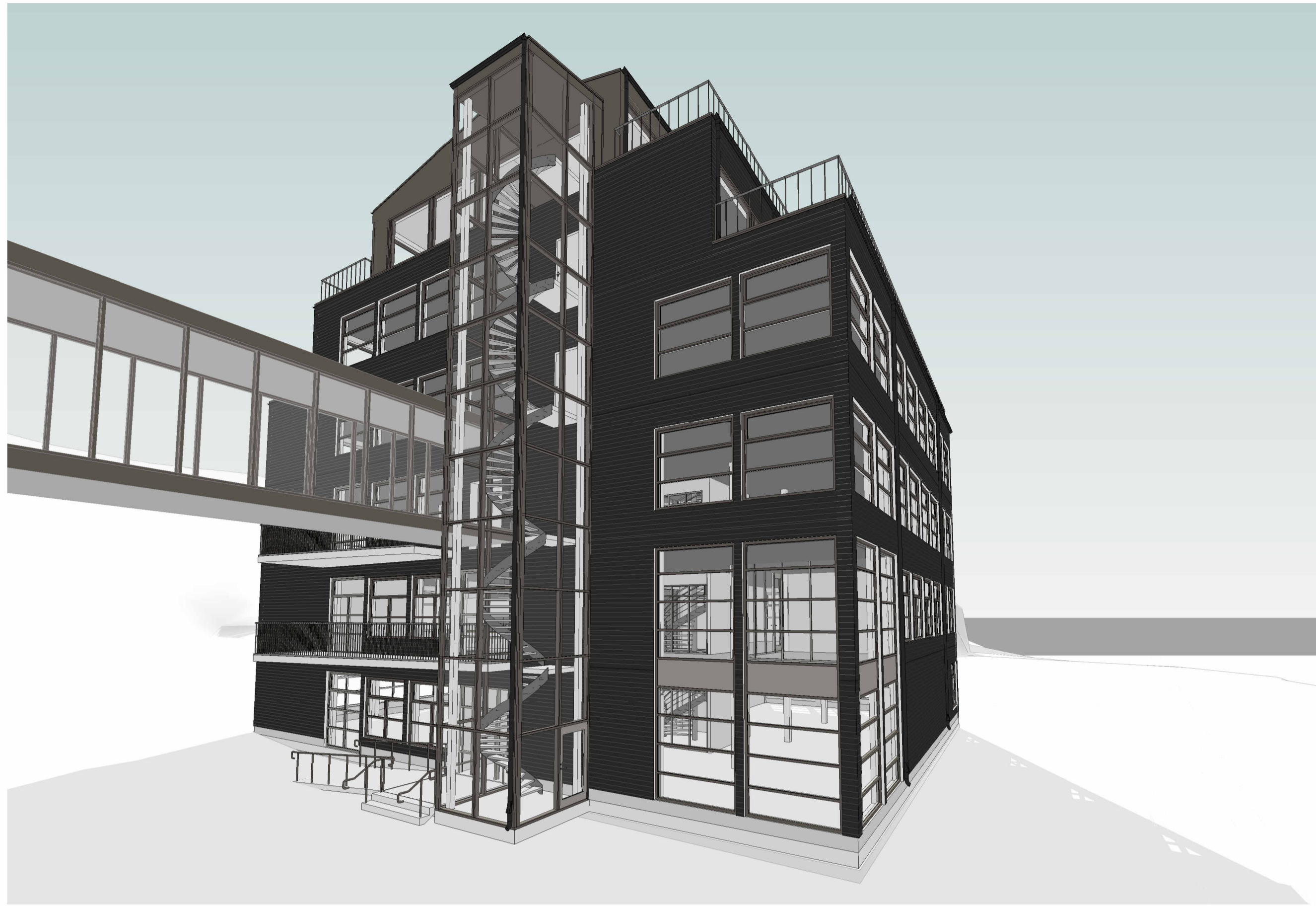
Gatuvy från nordöst