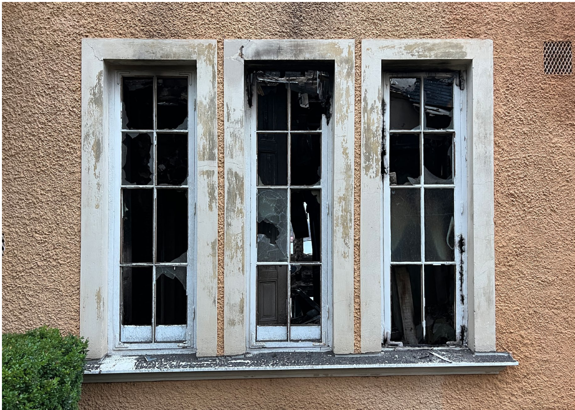
Småspröjsade fönster som bör vara från 1916, samt en troligen ursprunglig inmurningsventil.