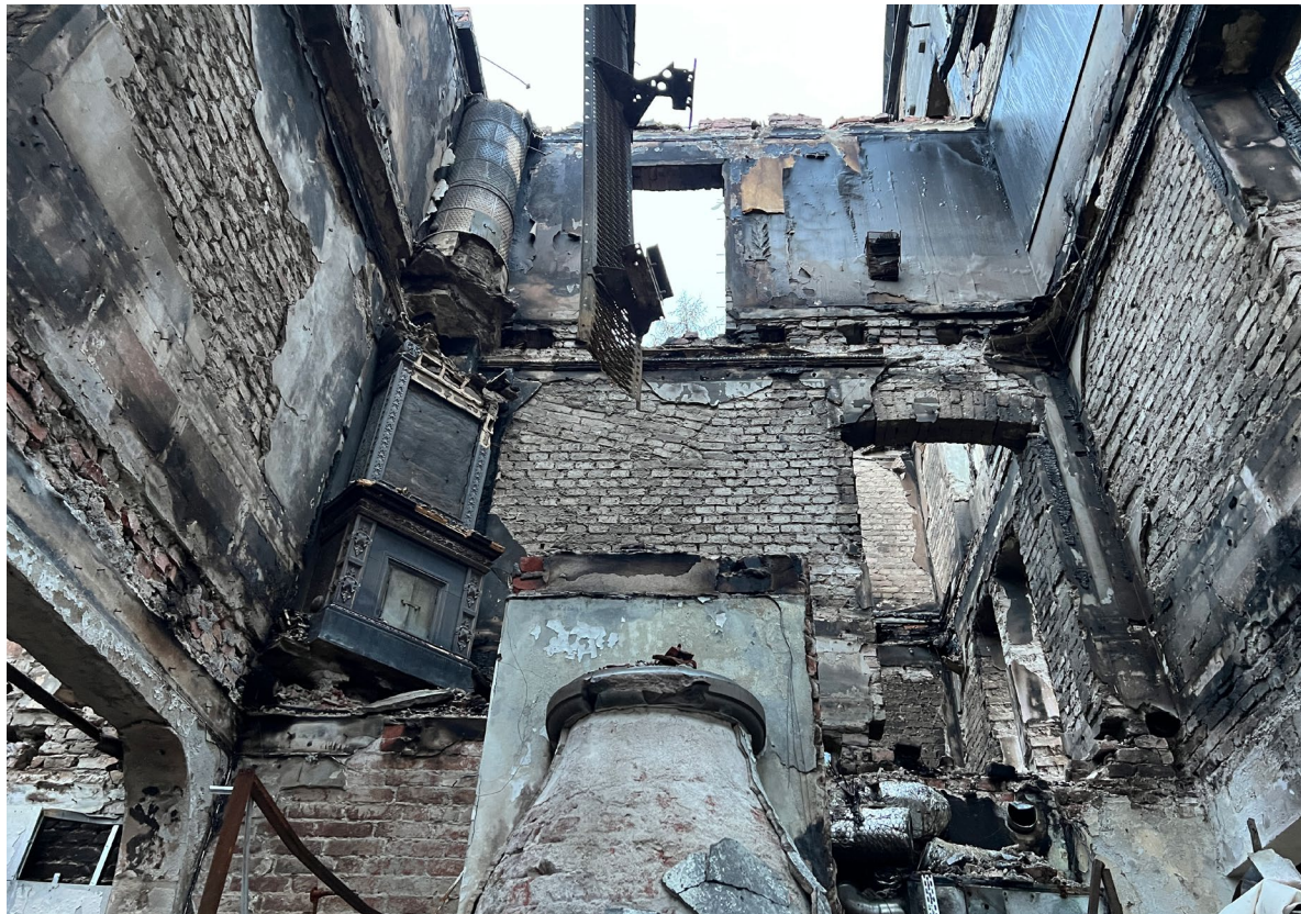
Träbjälklagen är helt utbrunna i samtliga delar av byggnaden.