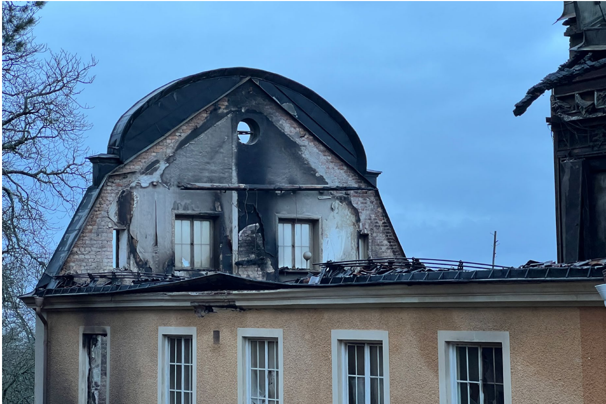
Fabrikörsvillan sedd från nordväst. Barockgavlarna ser ut att vara murade i kryss- eller blockförband.