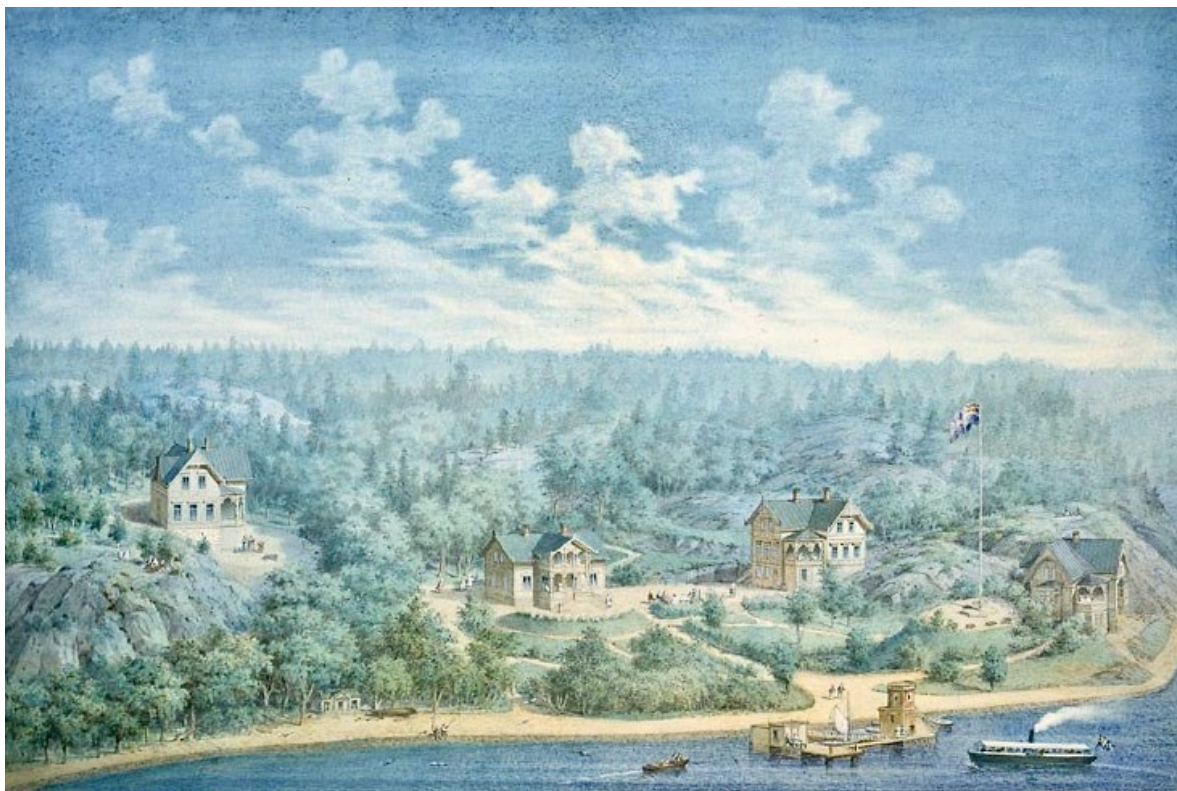
O.A. Mankells akvarell Sommarvillor vid Augustendal utförd 1878–80. Huvudbyggnaden på Augustendal är inte avbildad men är belägen drygt 100 meter vänster om Gustafshög 3 – villan längst till vänster som är den enda byggnaden på målningen som ännu är bevarad.

Vid Gustafshög på nordvästra delen av Sicklaön mitt emot Blockhusudden fanns ett gynnsamt hamnläge där Gustaf Albin Mellbin 1838 hade anlagt en gödningsfabrik på arrenderad mark. I övrigt användes det bergiga och svårtillgängliga området främst för bete i dalgångarna ner mot Saltsjön. När reguljär ångbåtstrafik utvecklades kring mitten av 1800-talet blev det bland Stockholms bemedlade borgarklass populärt att uppföra sommarnöjen på natursköna och vattennära tomter. Dåvarande ägaren till Sickla gård började på 1860-talet arrendera ut och försälja tomter och på 1870-talet fanns i området ett femtontal sommarvillor. Samtidigt ledde stigande tomtpriiser och strängare reglering av byggande till att industriverksamheter började söka sig utanför stadens gränser. Sicklaön med sin närhet till staden och möjlighet till egna kajer för