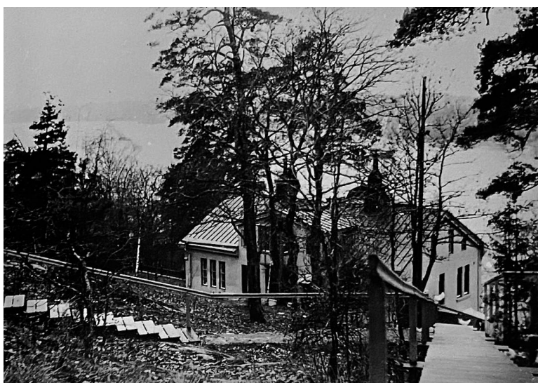
Ovan: Sommarvillan på Augustendal som uppfördes på 1870-talet. Notera hur första våningens fönsteröppningar överensstämmer med samma våning efter ombyggnaden 1916. Nedan huset fotograferat från trapporna som ledde upp till fabriksområdet.