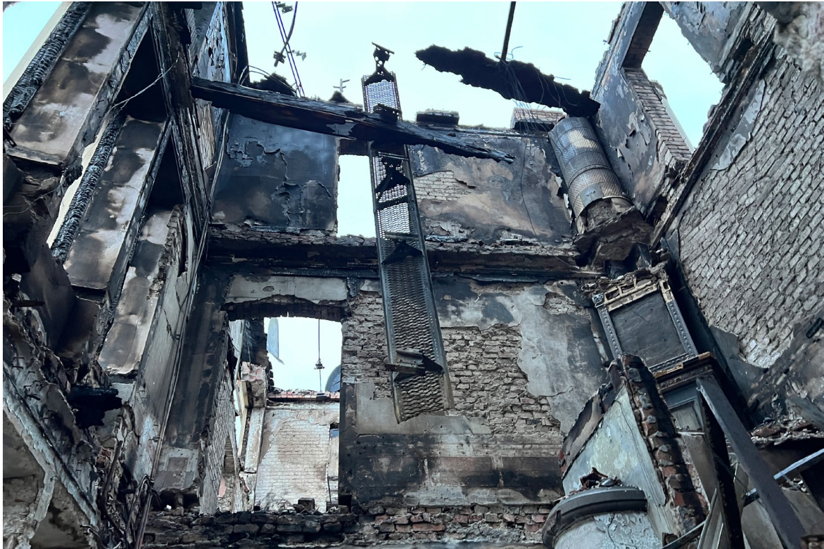
Samma rum som ovan.