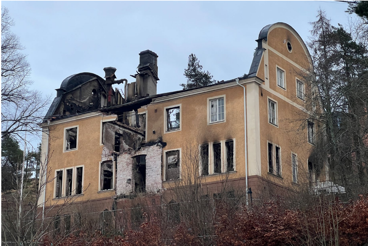
Villan sedd från nordväst.