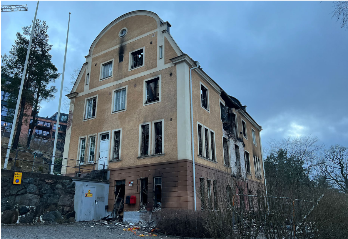
Fabrikörsvillan fotograferad från nordöst. Terrassmuren i sprängsten är ett viktigt element i trädgårdsstrukturen.