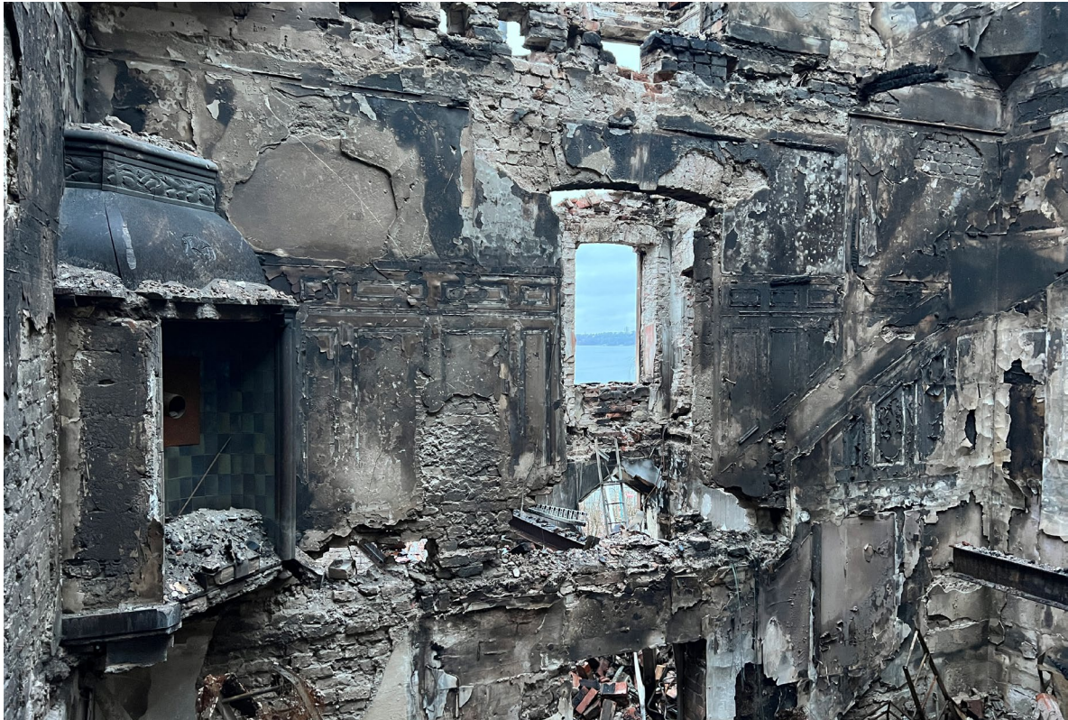
Öppen spis (troligen från ombyggnaden 1916) i byggnadens sydvästra del.