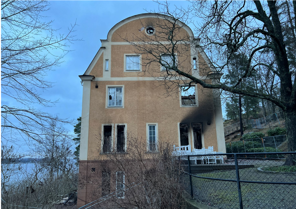
Gavelfasaden åt väster.