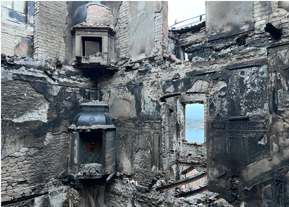
På flera väggar syns spår efter boaseringar.