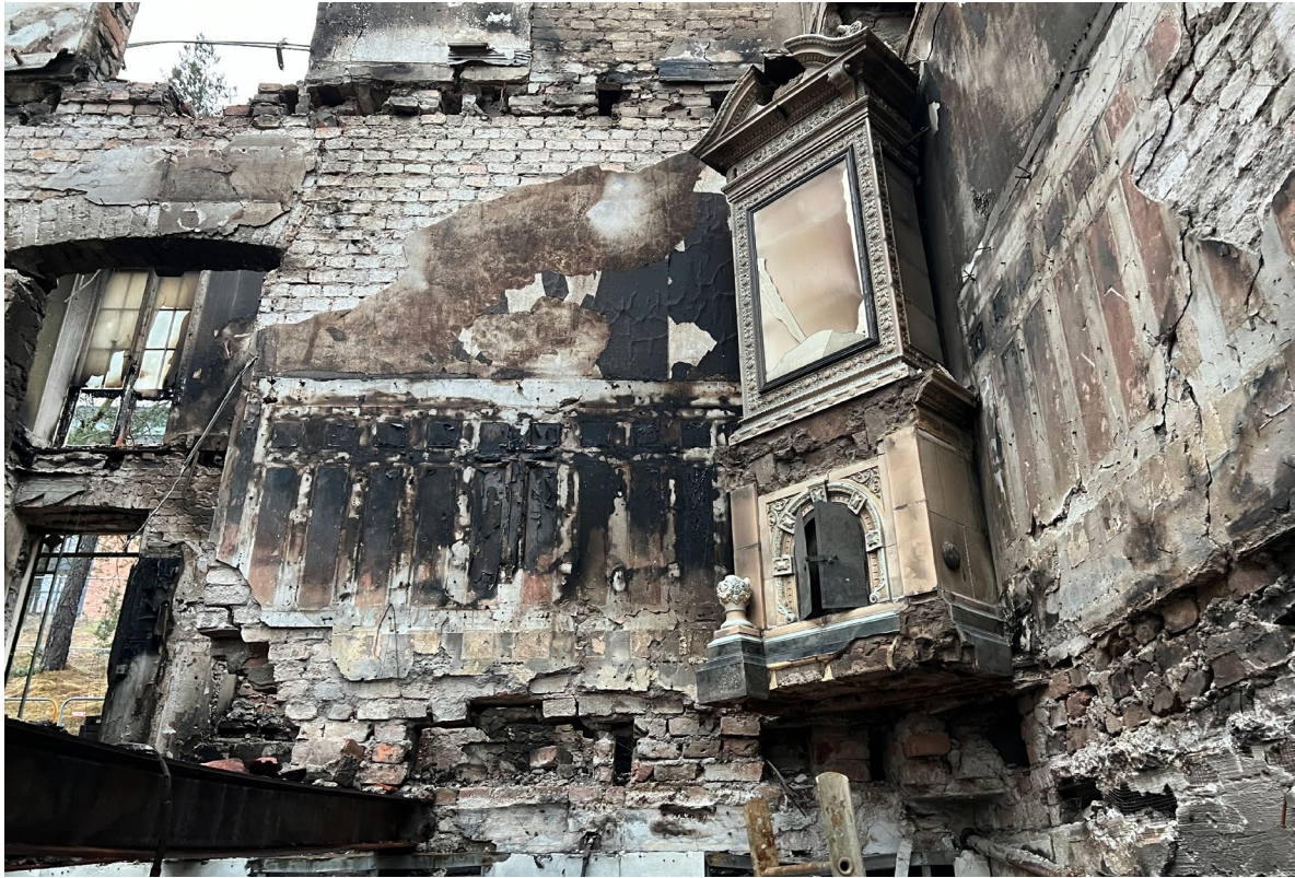
Mycket skadad kakelugn i nyrenässansstil med majolika.