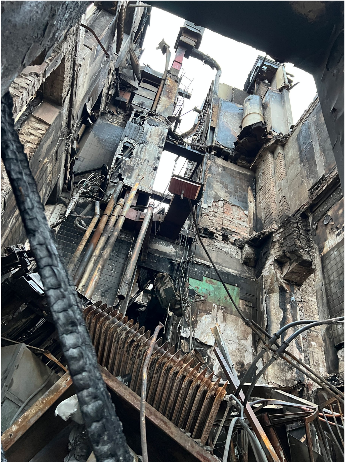
Invändigt är fördölsen anslående. Här fotograferat genom ett fönster i nordvästra delen av byggnaden.