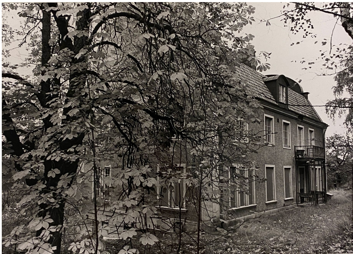
Fabrikörsvillan fotograferad 1984. Entréplanet på är förspikade med skivor.

Därtill bevarar tomten strukturen av den gamla trädgårdsanläggningen med murar, terrasseringar och trappor vilka understryker Fabrikörsvillans centrala roll i bebyggelsemiljön.