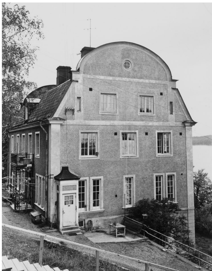
Fabrikörsvillan fotograferad 1969. Dörrläget i öster är ännu detsamma som på det tidigare sommarnöjet.

På fotografier av Fabrikörsvillan från 1984 är vissa fönster försatta, sannolikt för att förhindra inbrott, och fasader mm har tydliga underhållsbehov, bland annat med stora putsbortfall. I den kulturhistoriska utredningen inför exploateringen av Nacka strand från 1986 uppges: "Byggnaden är i gott skick och obetydligt förändrad sedan 1916. Dock har flertalet kakelugnar stulits. Centralvärmeinstallation finns." Från 1990 ska konstnärgruppen Zinobra haft ateljéer i villan. Arcona sålde Nacka strand till Vasakronan i början av 1990-talet men verkade fortsatt som fastighetsutvecklare och totalentreprenör i området. 1999–2000 ansvarade man för nybyggnationen av designhotellet Hotell J, i vars verksamhet både Fabrikörsvillan och Tornvillan (Ellensvik 2) införlivades. Fabrikörsvillan rustades upp och mindre anpassningar av interiören skedde efter ritningar av Nyréns, bland annat installerades hiss. I ritningarna betecknas sex av de åtta kakelugnarna som nya. Samtliga tre dörrlägen på gavlarna förändrades vilket även medförde nya fönsteröppningar. Trädgårdsanläggningen med terrasserings och trappor sattes i stånd.