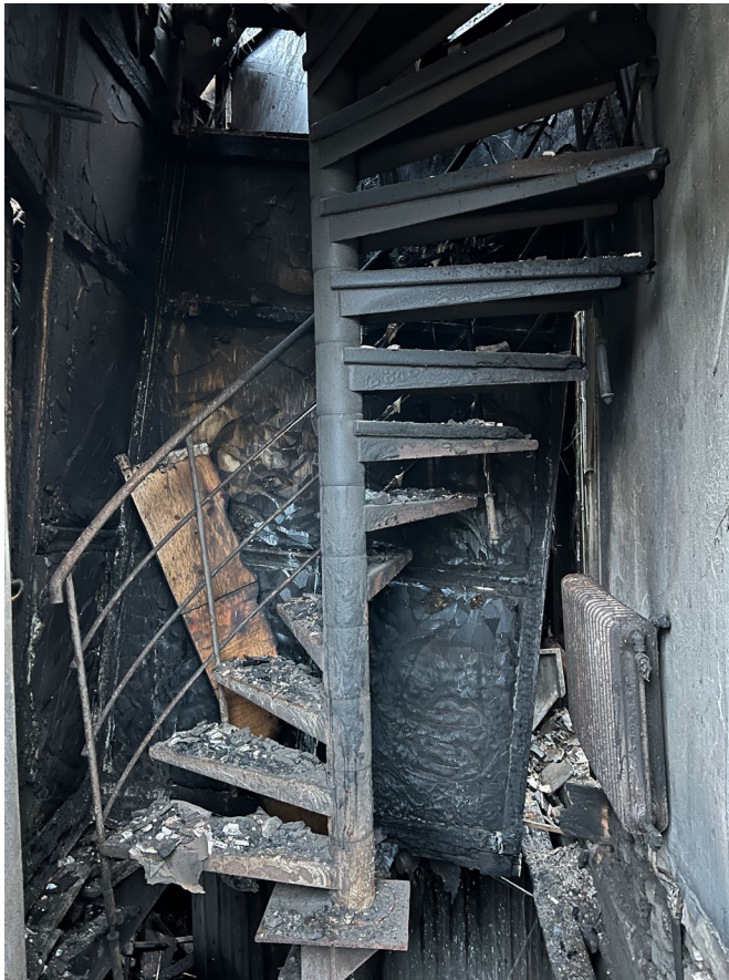
Spiraltrappa i järn vid entrén på den östra gaveln.