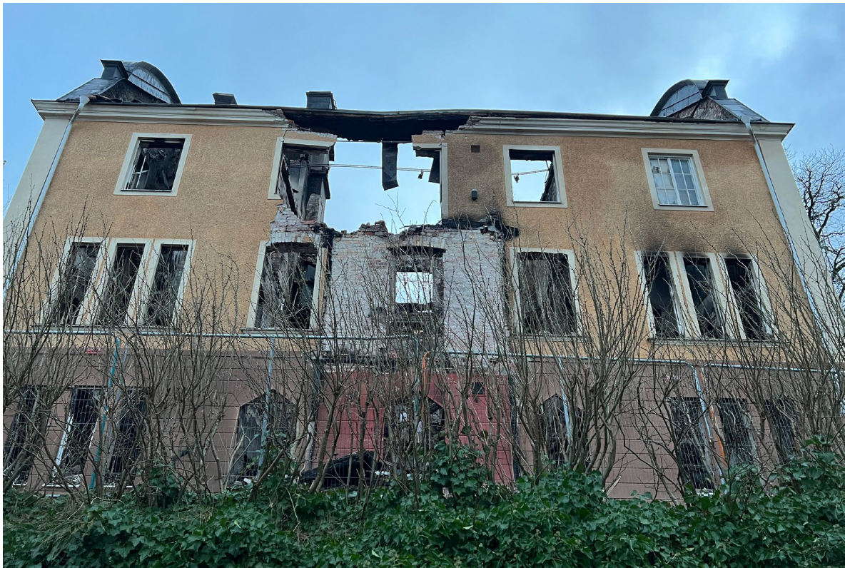
Tegelbalken över träverandan åt vattnet har kollapsat, troligen pga att dragjärnen utvidgats av värmen från branden.