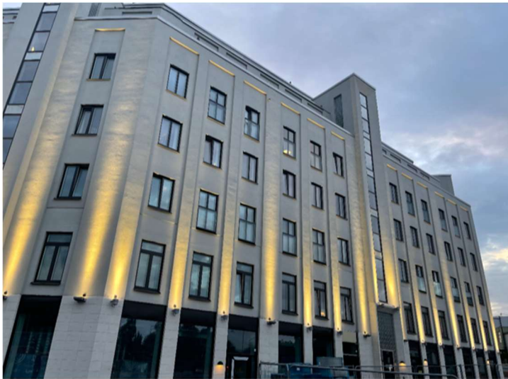
Verklig bild på fasaden