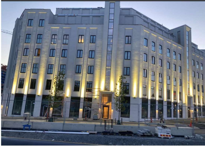
Verklig bild på fasaden