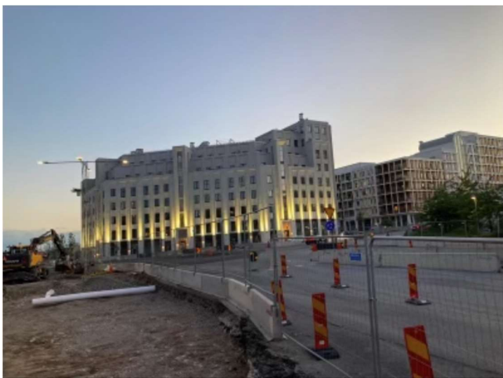
Verklig bild på fasaden