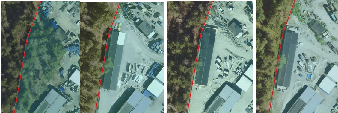
1. Ortofoto april 2019. 2. Ortofoto april 2020. 3. Ortofoto april 2021. 4. Ortofoto juni 2022.

Information gavs under handläggning av ärende B 2021-002235 att ett lov i efterhand skulle vara förenat med byggsanktionsavgift och att möjlighet fanns att ta bort byggnaden för att undvika detta. Information om byggsanktionsavgift och dess ungefärliga storlek har även getts i lovärende B 2022-001038. Byggnaderna har inte tagits bort och lov gavs i efterhand 21 september 2022. Startbesked i efterhand gavs den 11 augusti 2023.