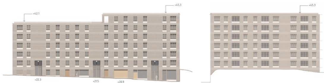
Fasadelevation från norr respektive väster. Bilderna visar möjlig utformning som följer gestaltungsprinciperna.

Utifrån landskapet, den kulturhistoriska miljön och naturmiljön har gestaltungsprinciper tagits fram. Principerna utgår även ifrån att nya stadskvaliteter ska tillföras. Den tillkommande volymen är relativt stor bland de befintliga småskaliga byggnaderna intill och därför är det viktigt att den utformas så att den ändå passar in i sitt sammanhang och inte sticker ut på ett främmande vis. Material, kulör, form och proportion spelar in för att ge ett lugnt intryck. Det ska även vara tydligt att en ny årsring tillförs i området så att befintliga årsringar fortsatt är avläsbara.