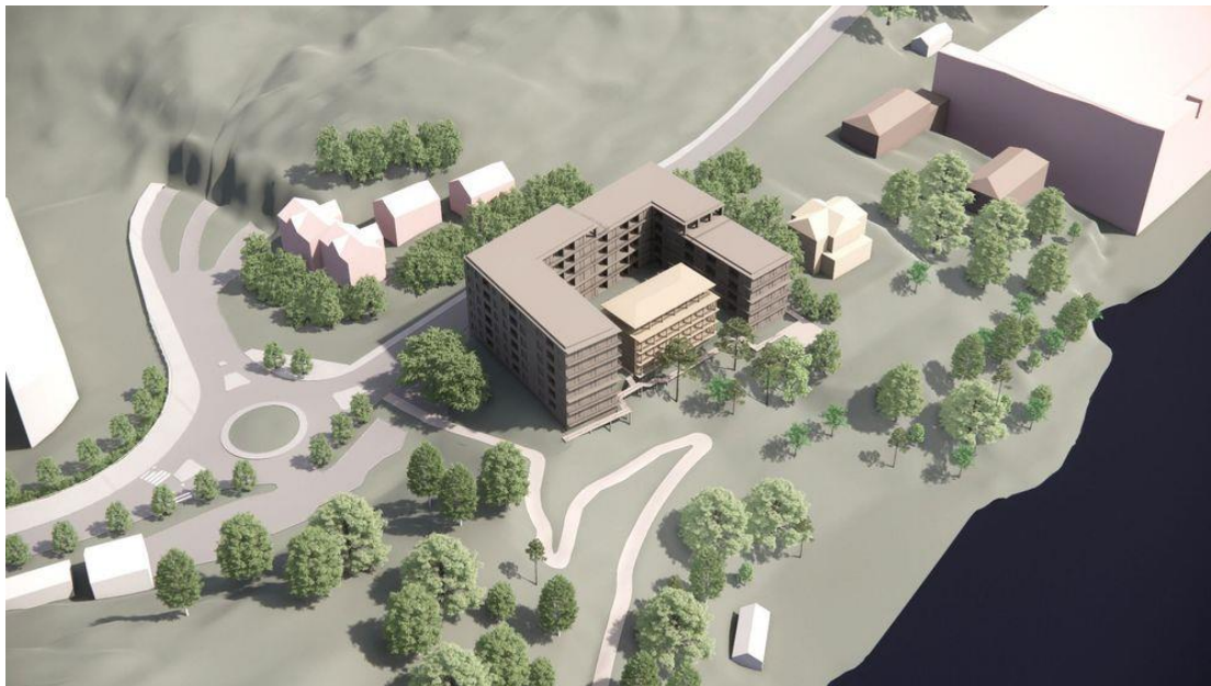
Flygvy över bebyggelseförslaget och dess omgivning

Utifrån landskapet, den kulturhistoriska miljön och naturmiljön har gestaltungsprinciper tagits fram. Principerna utgår även ifrån att nya stadskvaliteter ska tillföras. Den tillkommande volymen är relativt stor bland de befintliga småskaliga byggnaderna intill och därför är det viktigt att den utformas så att den ändå passar in i sitt sammanhang och inte sticker ut på ett främmande vis. Material, kulör, form och proportion spelar in för att ge ett lugnt intryck. Det ska även vara tydligt att en ny årsring tillförs i området så att befintliga årsringar fortsatt är avläsbara.