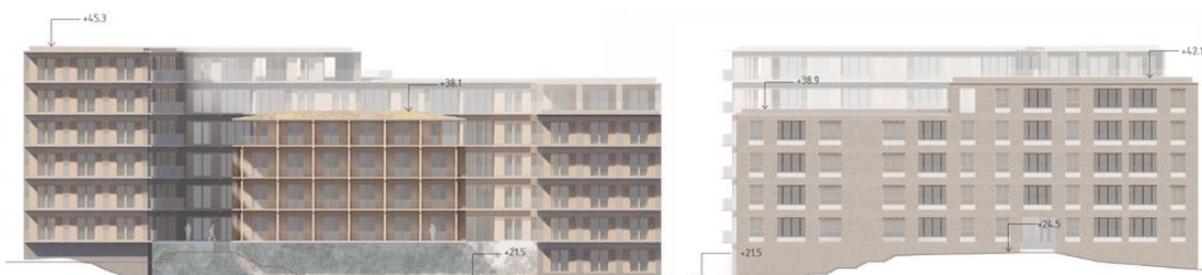
Fasadelevation från söder respektive öster. Bilderna visar möjlig utformning som följer gestaltungsprinciperna.