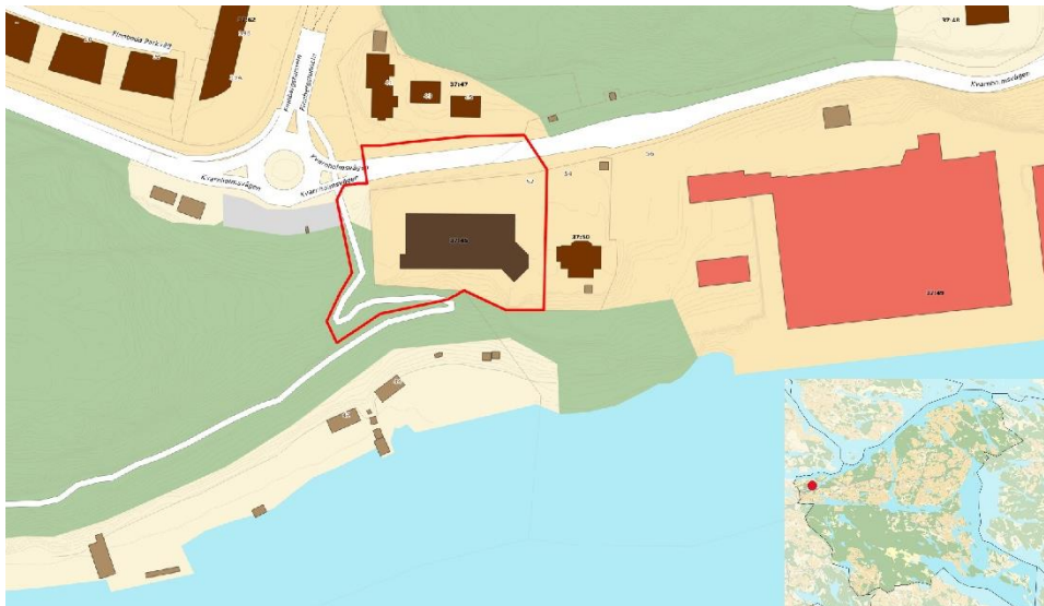
Planområdets avgränsning. Lilla bilden visar var i Nacka kommun området ligger.