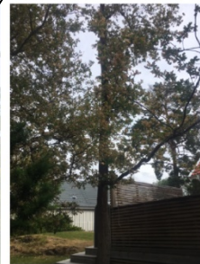
Träd 5: EK