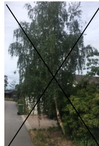
Träd 4: Björk