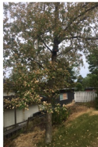
Träd 2: Ek