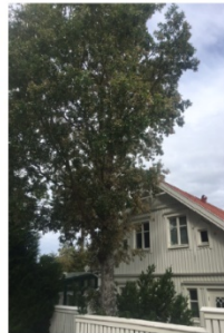
Träd 3: Ek