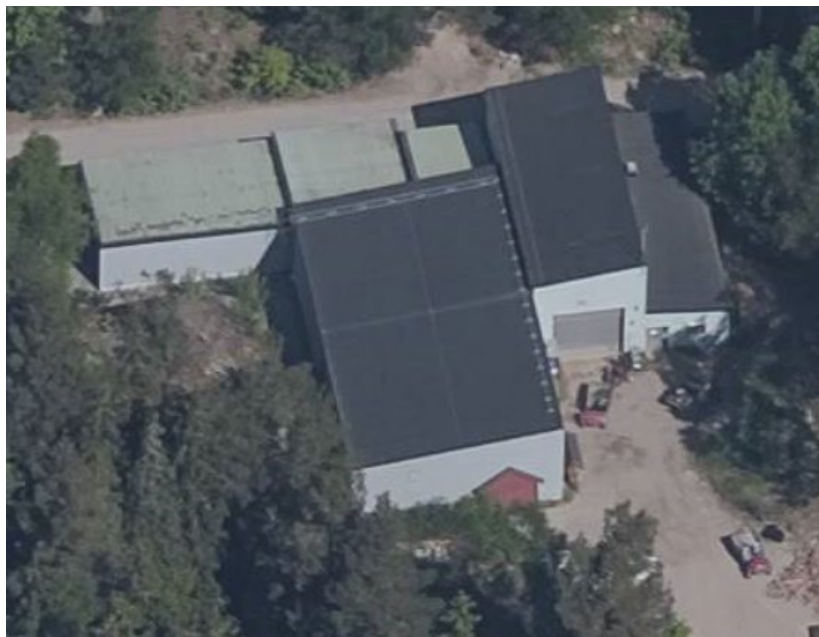
Vy den befintliga byggnaden 2018