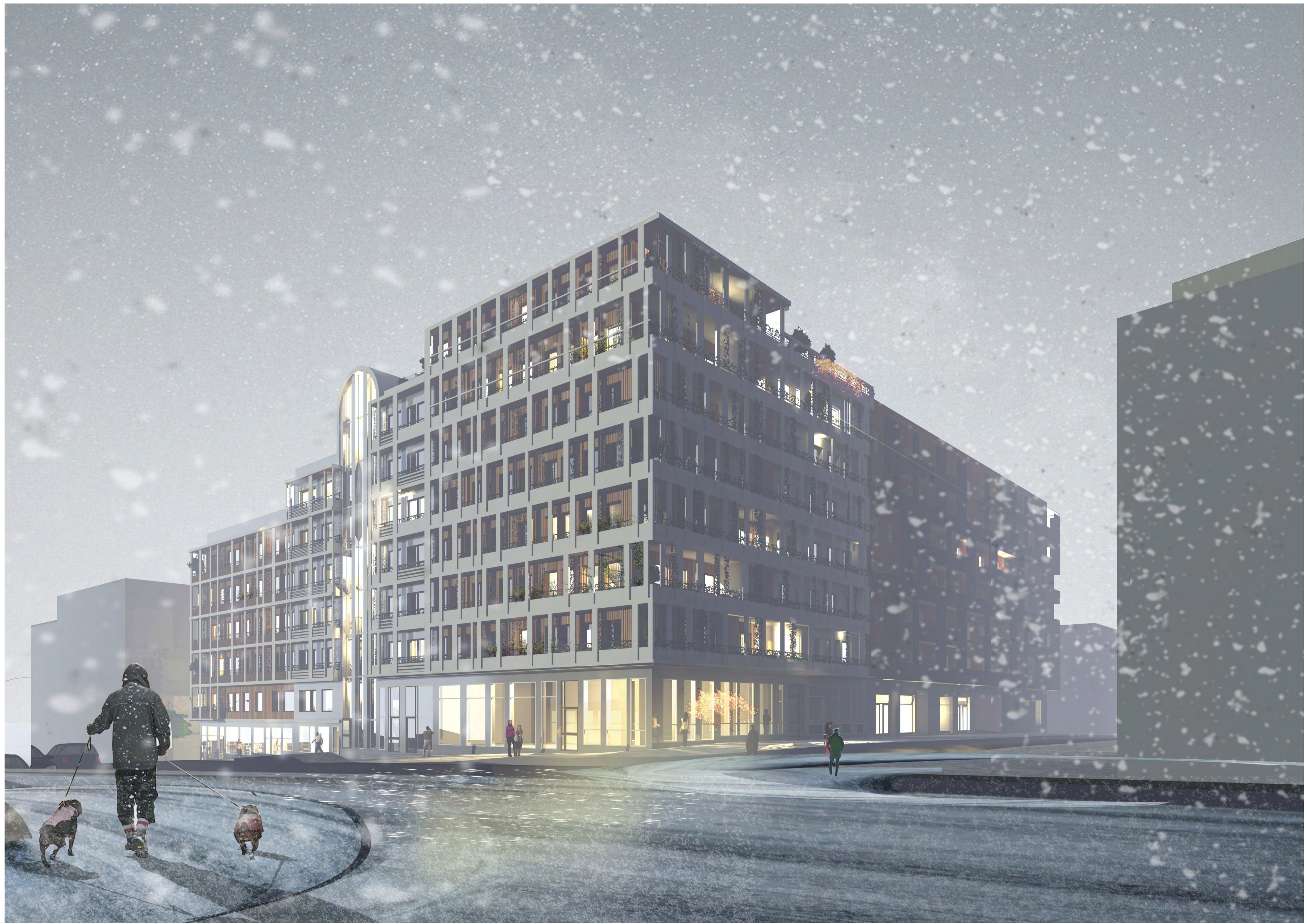
PERSPEKTIV VY FRÅN NORR