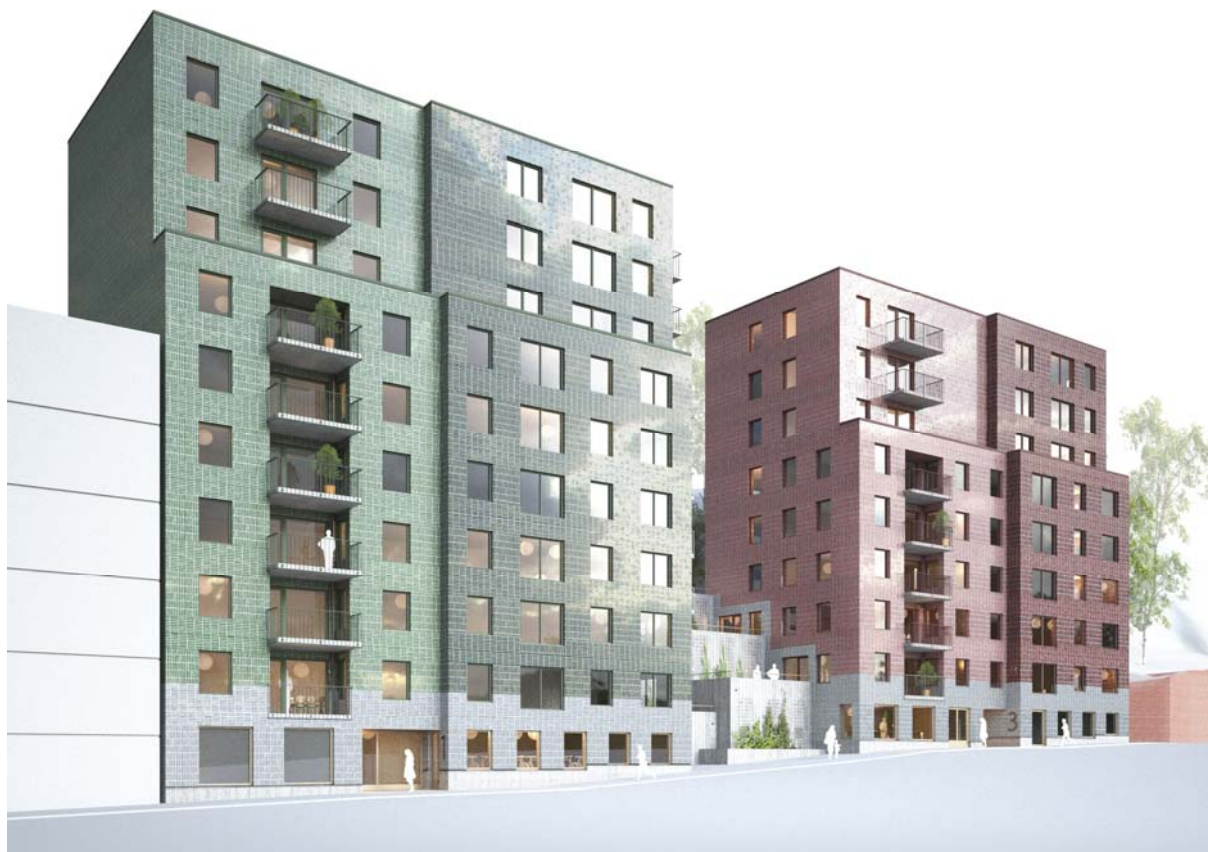
Illustration gatuvy Fabrikörvägen

Beskrivningen syftar till att underlätta läsandet av A-handlingar. Mer information finns att finna i A-handlingar. Se handlingsförteckning daterad 191024.