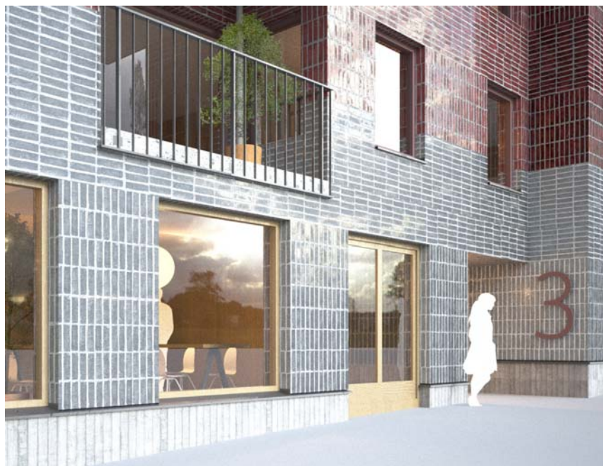
Principillustration sockelvåning med bostadsentré

Bakombelysta skyltar med husens adress placeras på yttervägg vid bostadsentréerna.