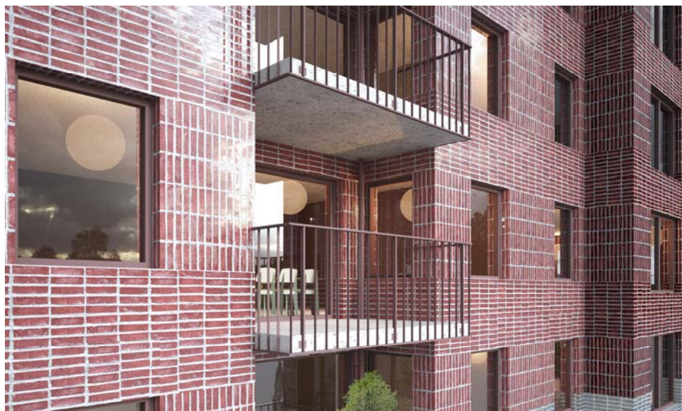
Principillustration indragen balkong