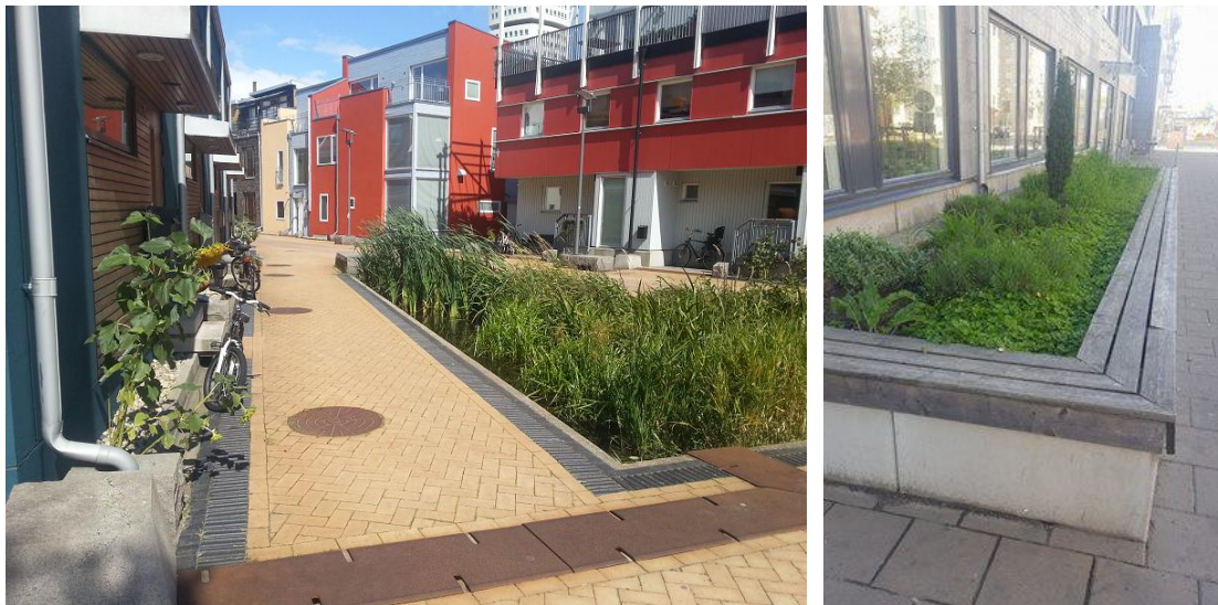
Figur 2: Till höger nedsänkt växtbädd/regnbädd på innergård, Bo01, Malmö. Till vänster upphöjd växtbädd, Hisingen, Göteborg.

Ett exempel på utformning av nedsänkt/upphöjd regnbädd visas i Figur 2.