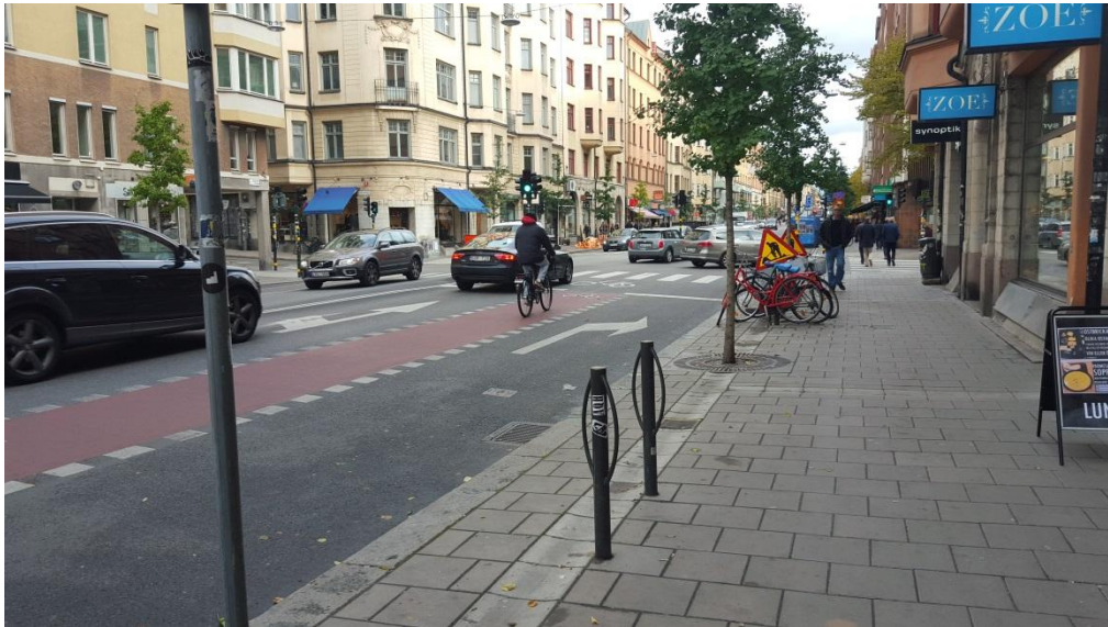
Figur 3: Trädplantering i gata, Stockholm.

Exempel på trädplantering med skelettjord vid körbana och GC-väg visas i Figur 3.