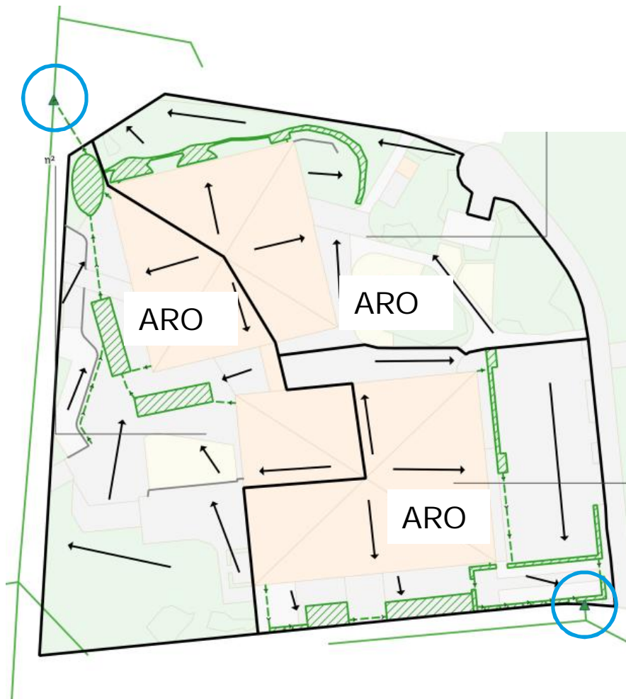
Figur 1: Översikt definierade delavrinningsområden och antagna anslutningspunkter (inringade).

Skolan avvattnas i dagsläget till det kommunala dagvattennätet. Det finns en befintlig dagvattenledning belägen väster om området och en ledning söder om området, se Figur 1. På respektive dagvattenledning finns dagvattenserviser som ansluter till området. Dagvattenledningarna leds till en våtmark som i sin tur mynnar i Ältasjön som utgör områdets recipient.