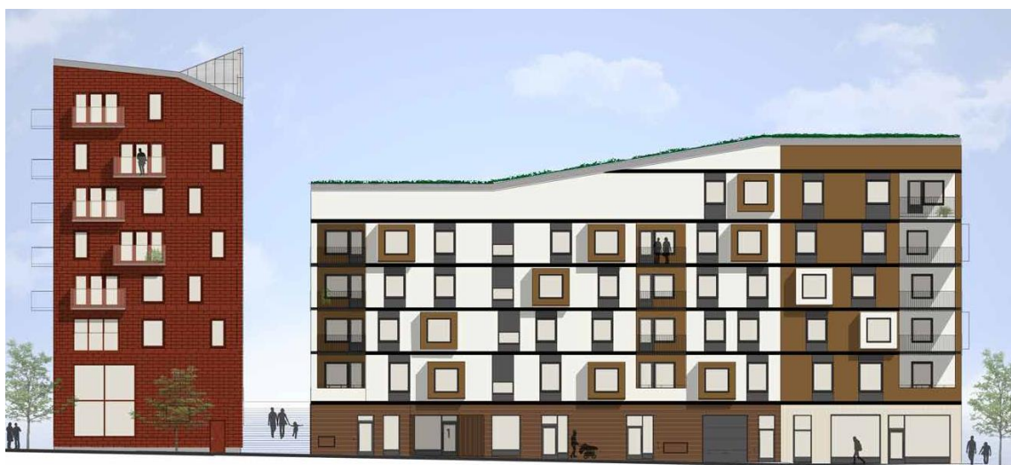
Illustration från Material- och kulörbeskrivning