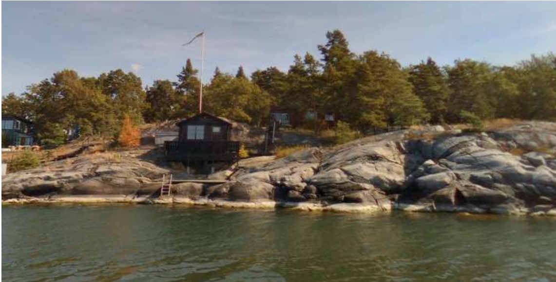
Vy från vattnet 2018