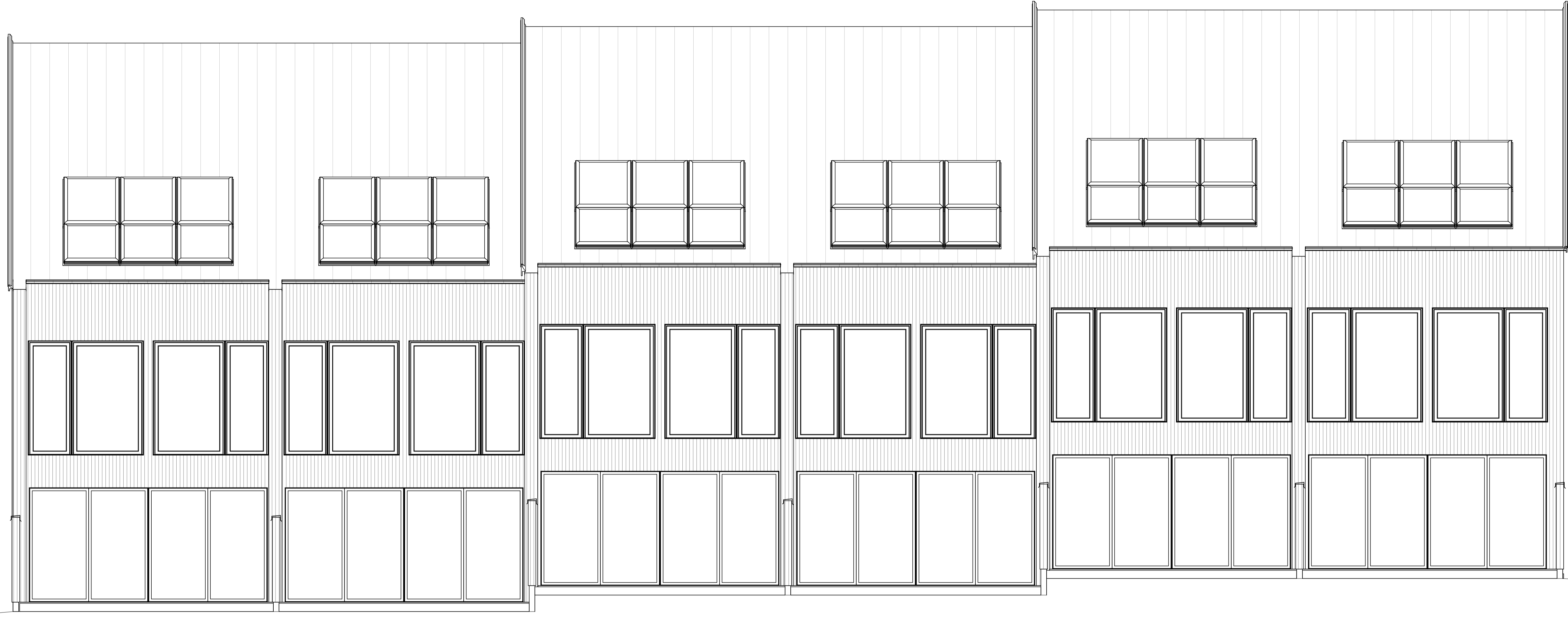
Fasad mot Sydöst