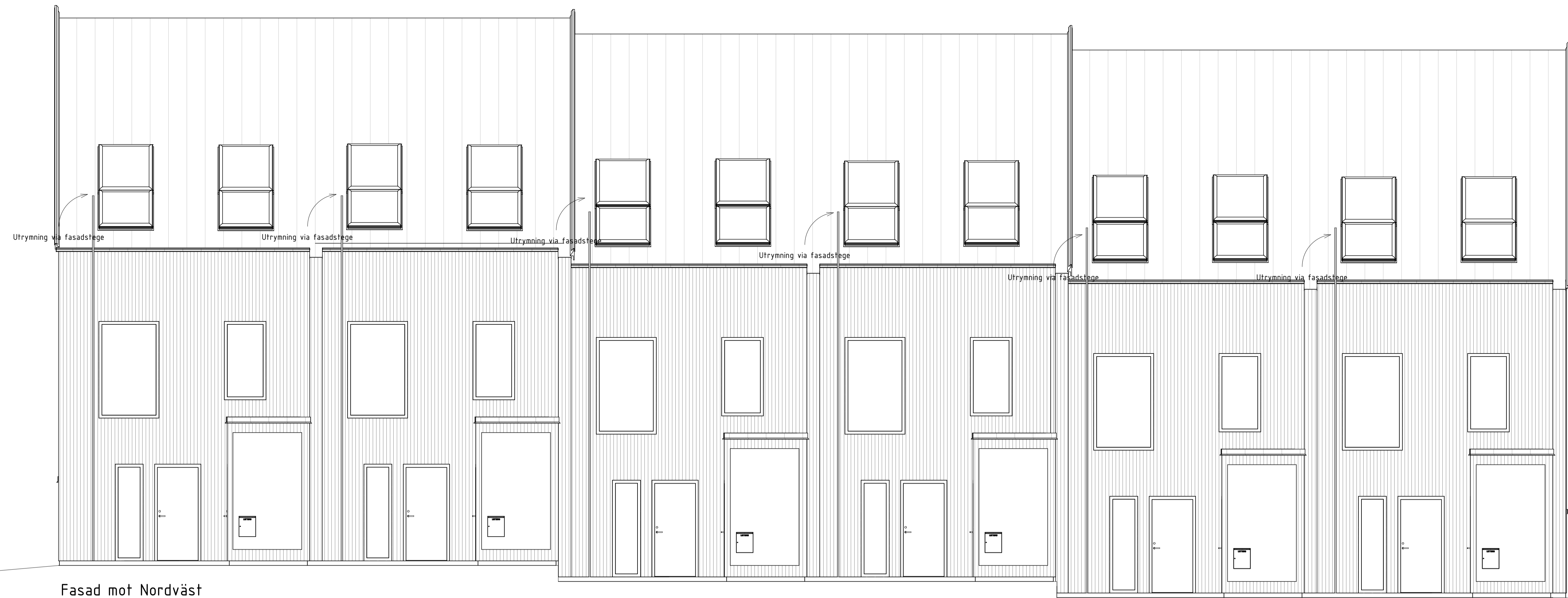
Fasad mot Nordväst