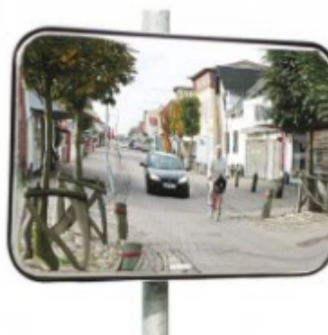
Figur 2: Utfartsspegel