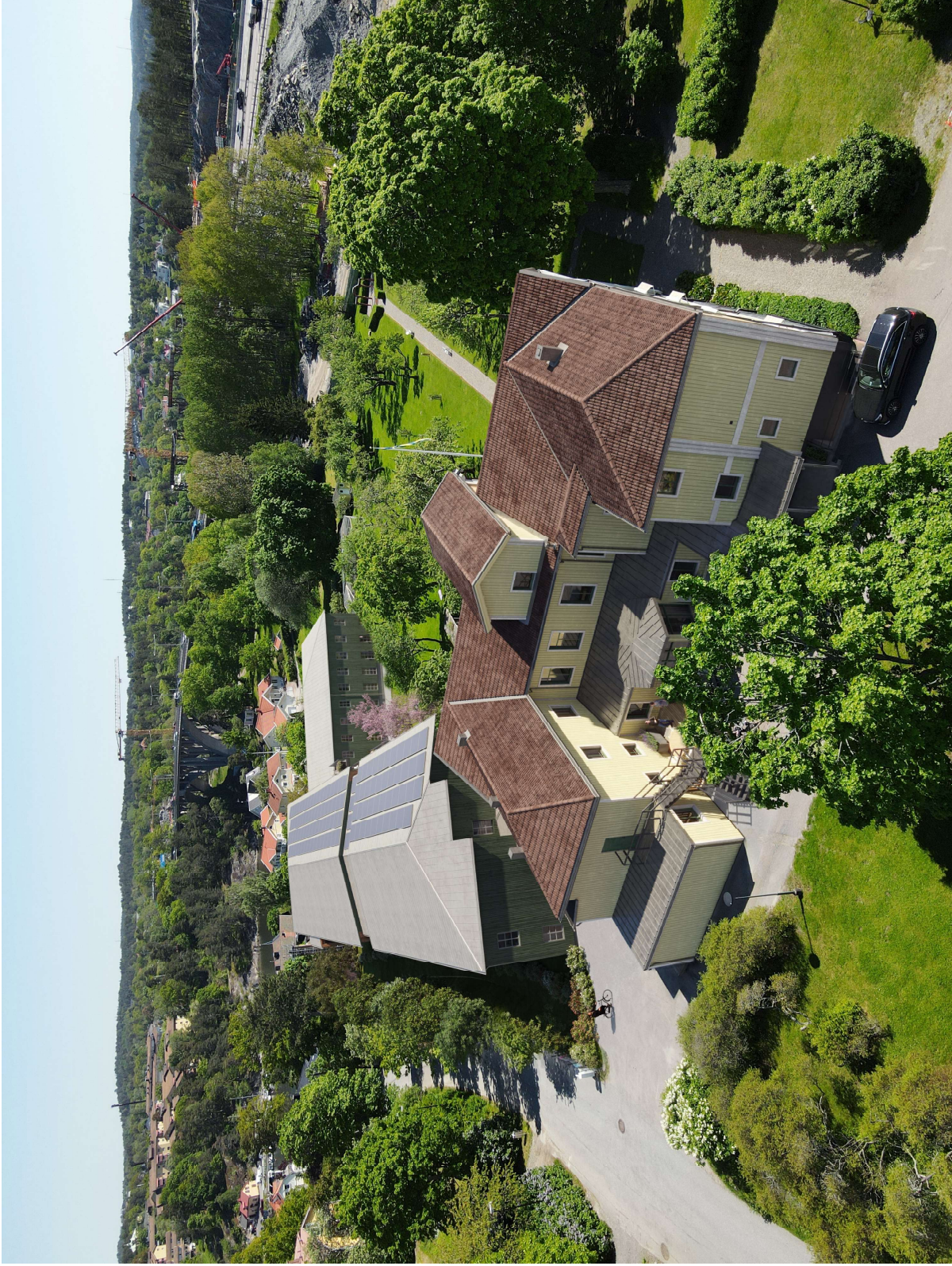
Visualisering med vy från norr. Avvikelser i redovisning från bygglov kan förekomma. Bild framtagen i tidigt skede.