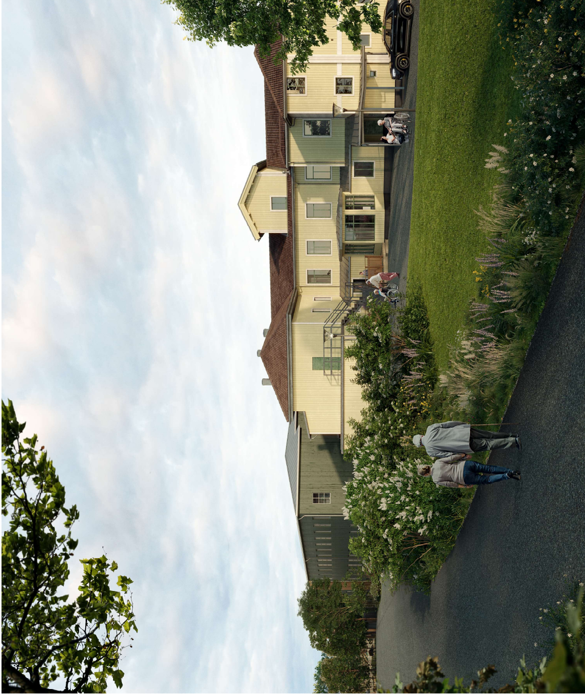
Visualisering. Avvikelser i redovisning från bygglov kan förekomma. Bild framtagen i färdigt skede.