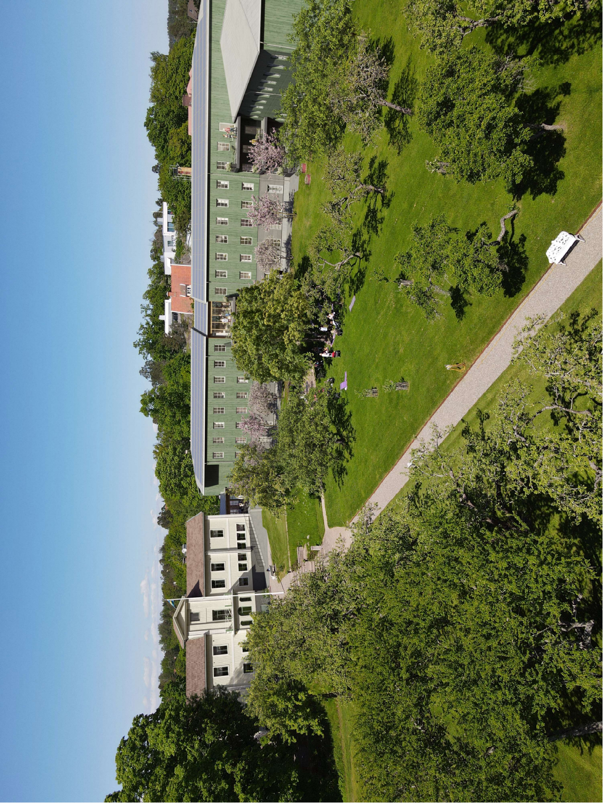
Visualisering med vy från söder. Avvikelser i redovisning från bygglov kan förekomma. Bild framtagen i tidigt skede.