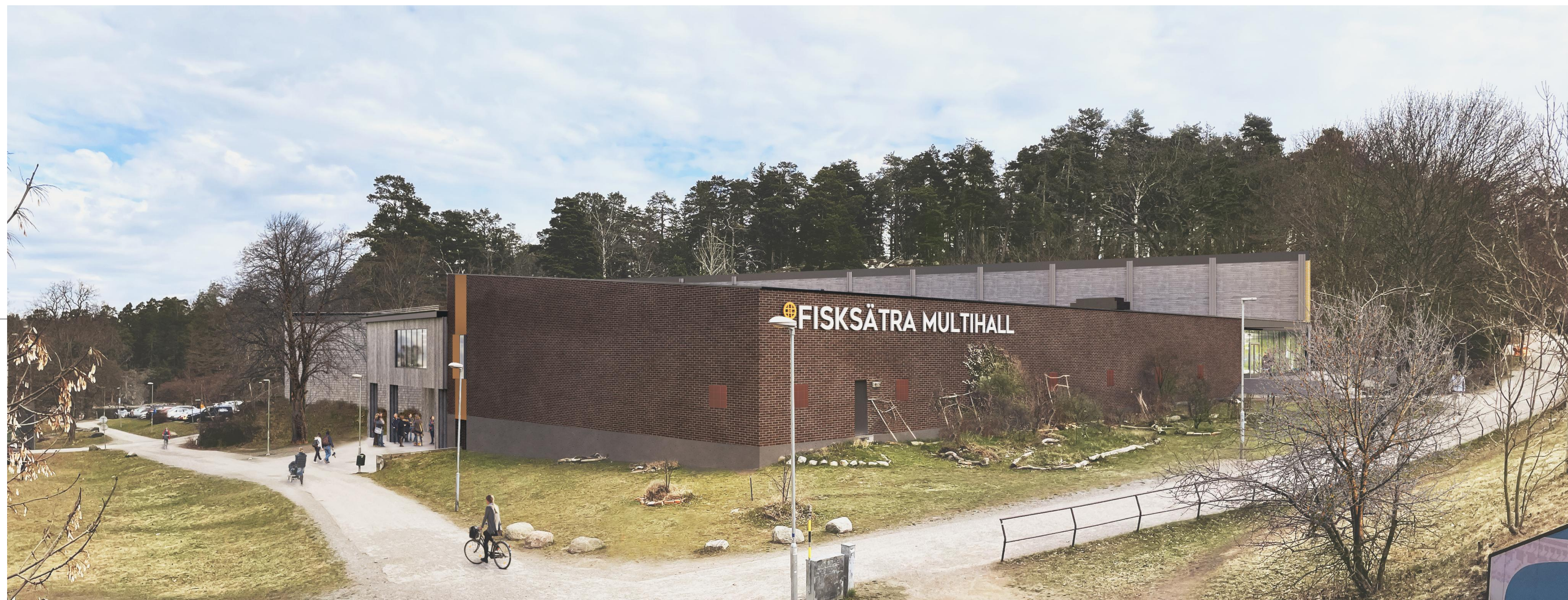
VY FRÅN SYDVÄST

Gestaltungsbeskrivning Utvändig material- och kulörbeskrivning