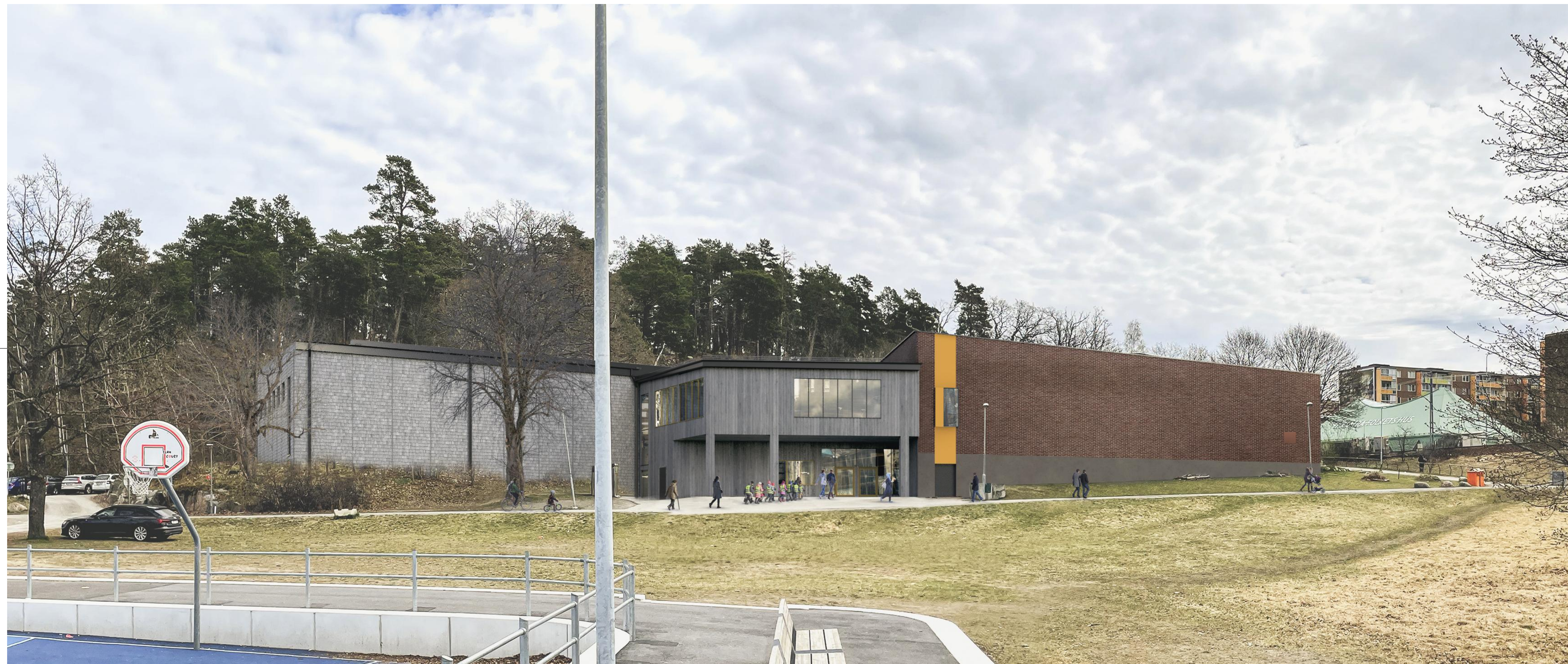
VY FRÅN VÄSTER

Gestaltungsbeskrivning Utvändig material- och kulörbeskrivning