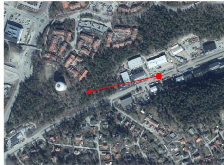
Vy från Lidl parkeringen.