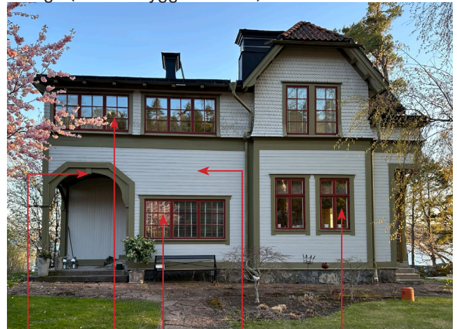
Nuläge (efter ombyggnad 1994)

Skärmtak har blivit nisch, mycket förenklad detaljering