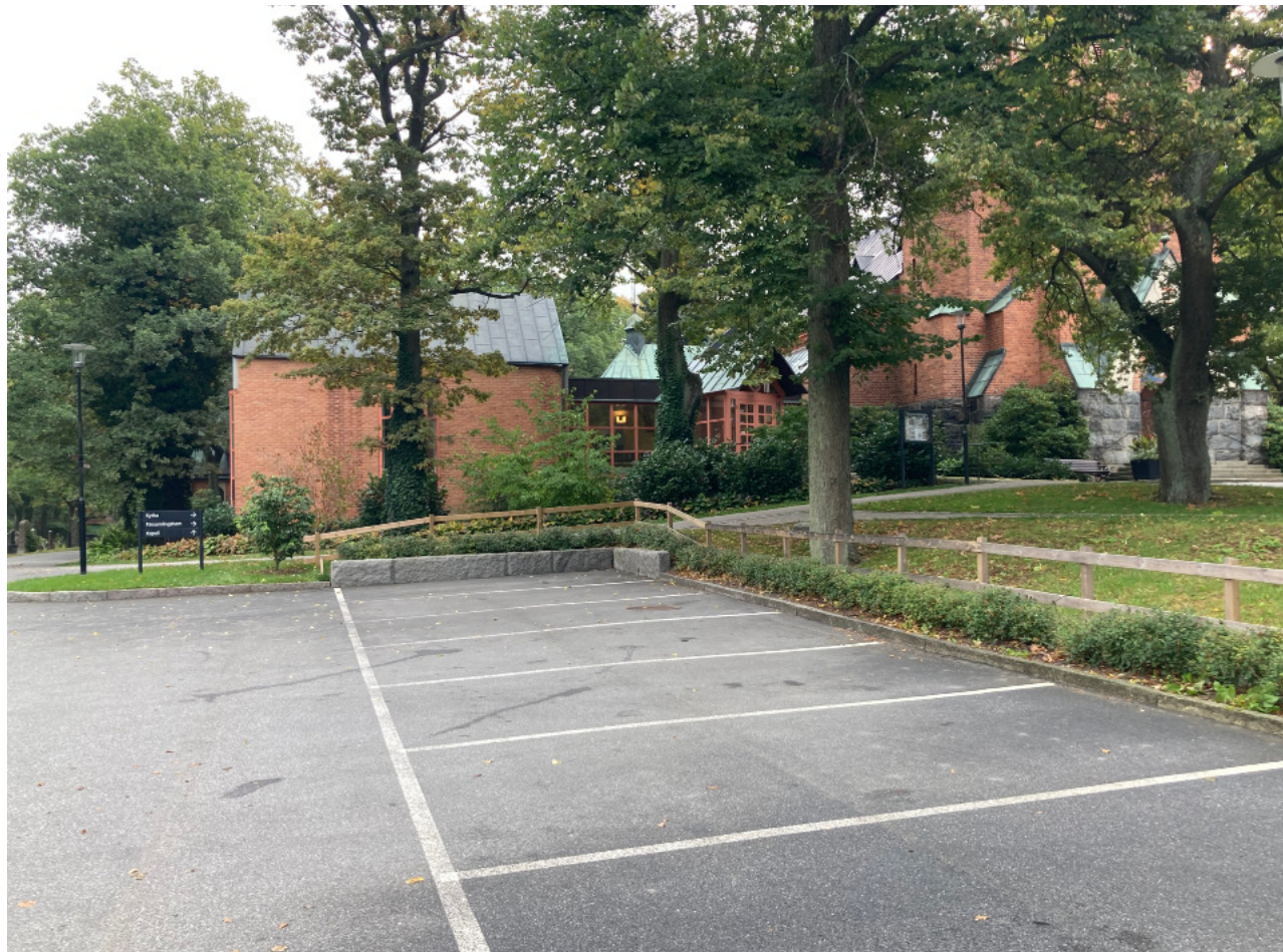
Plats för ny cykelparkering, sedd från väster.