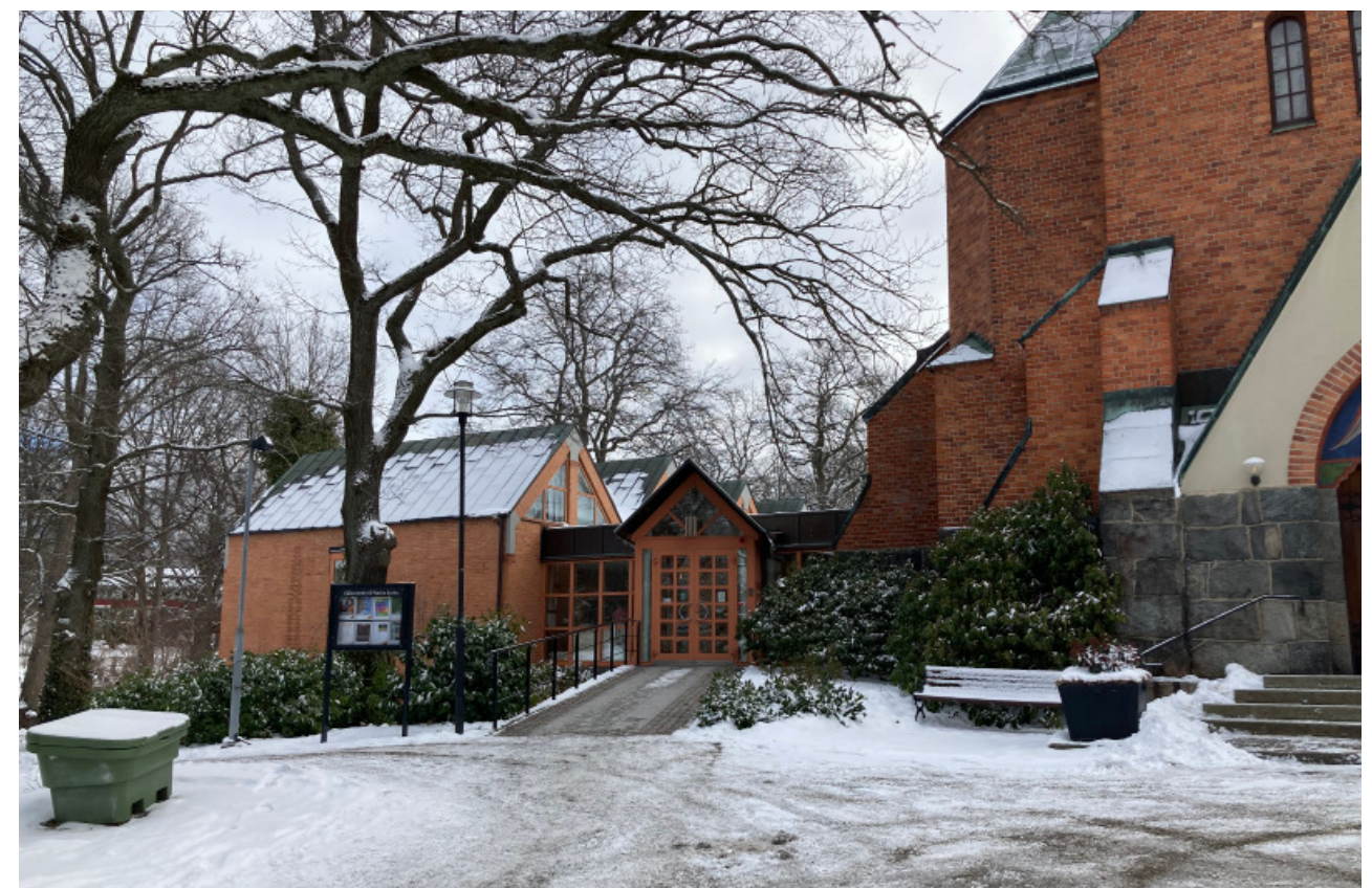
Kyrkan och det tillbyggda församlingshemmet - sett från väster. Informationstavlans läge.