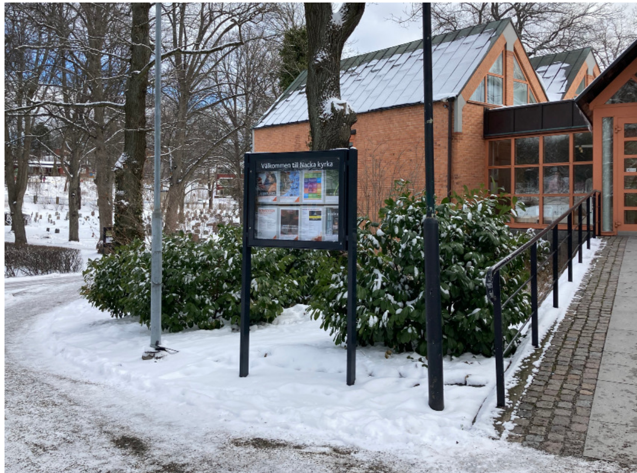
Befintlig informationstavla vid församlingshemmet och kyrkan