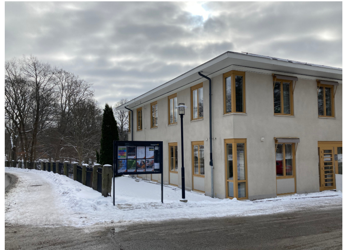
Kanslihuset, sett från nordväst - från Gamla Värmdövägen. Informationstavlans läge.