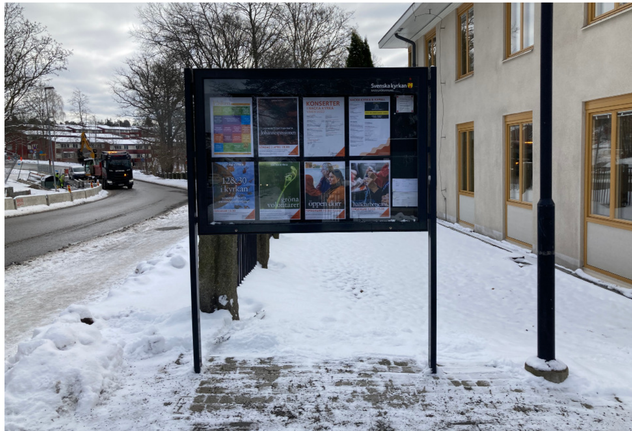
Befintlig informationstavla vid entrén från Gamla Värmdövägen