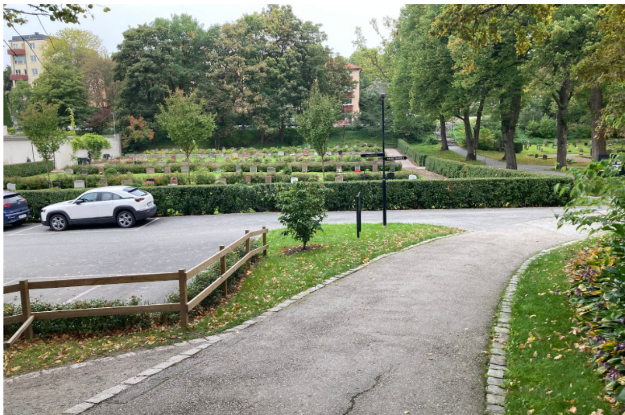
Plats för ny cykelparkering, sedd från söder.