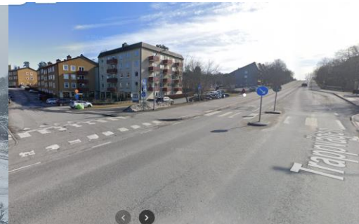
Bild 6. Vy från korsning Trädgårdsv/Sockenv Denna vy är det som representerar blickfånget för gemene man.