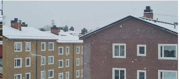
Bild 4. Vy från Trädgårdsvägen 7. Bild tagen från trapphus plan 3. Endast lgh på gavel har denna utsikt mot yttertaket