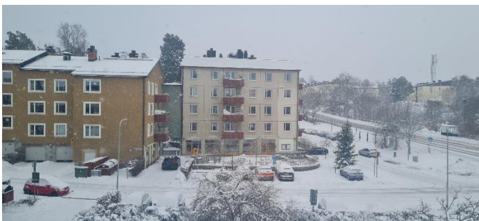
Bild 5. Vy från Trädgårdsvägen 1B Bild tagen från plan 3