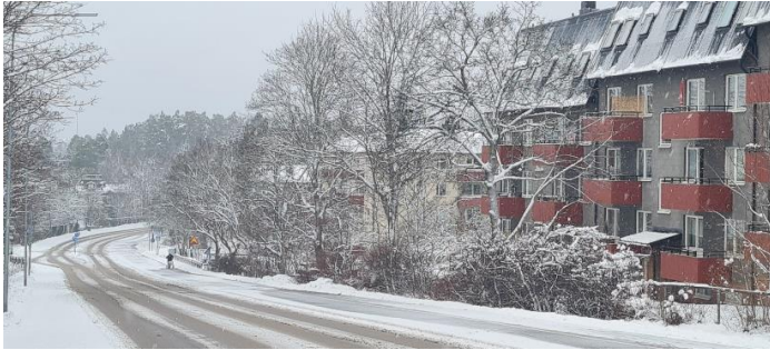
Bild 1. Vy från Sockenvägen Begränsad vy på grund av träd