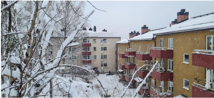
Bild 3. Vy från Trädgårdsv 4C Bild tagen från berg i nivå med de lgh som har utsikt mot yttertaket.