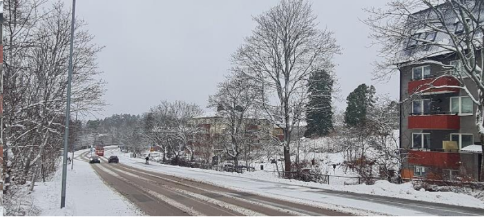
Bild 2. Vy från Sockenvägen Begränsad vy på grund av träd. Längre ner på Sockenvägen är inte den övre delen av yttertaket synlig.