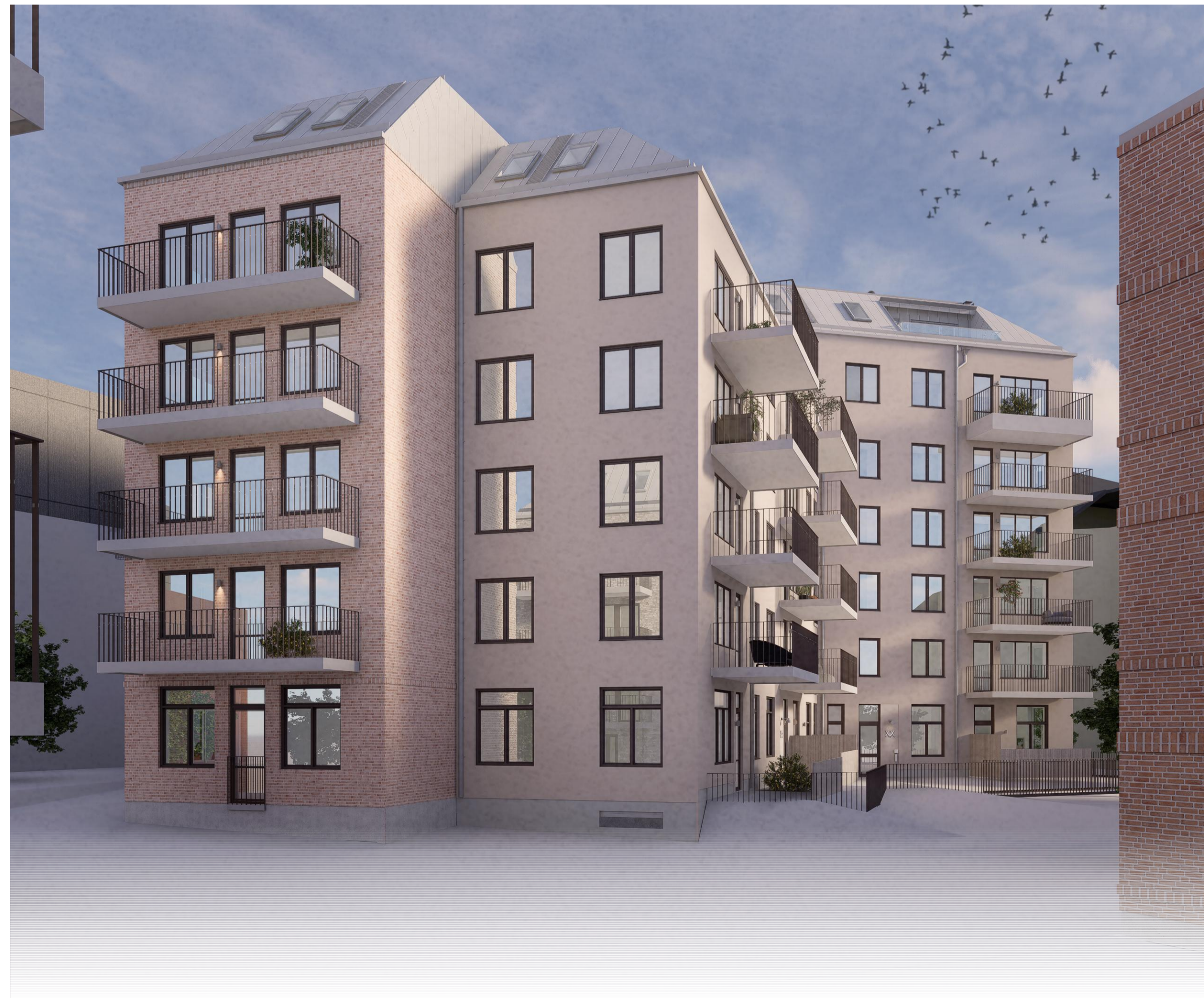
VY BYGGNAD L2 FRÅN SYDVÄST