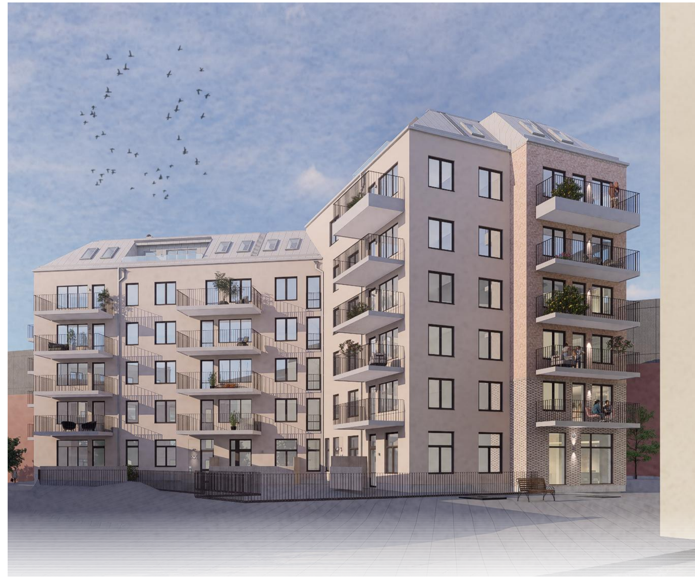
VY BYGGNAD L2 FRÅN SYDOST