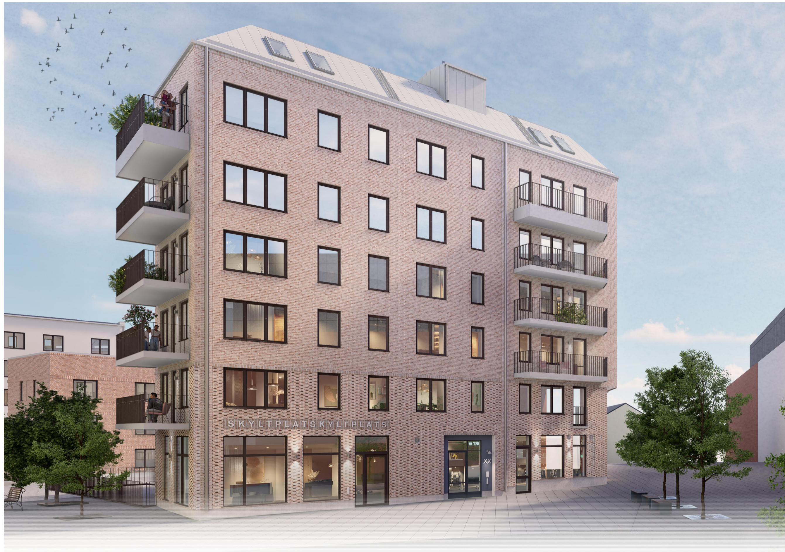
VY BYGGNAD L2 FRÅN NORDOST