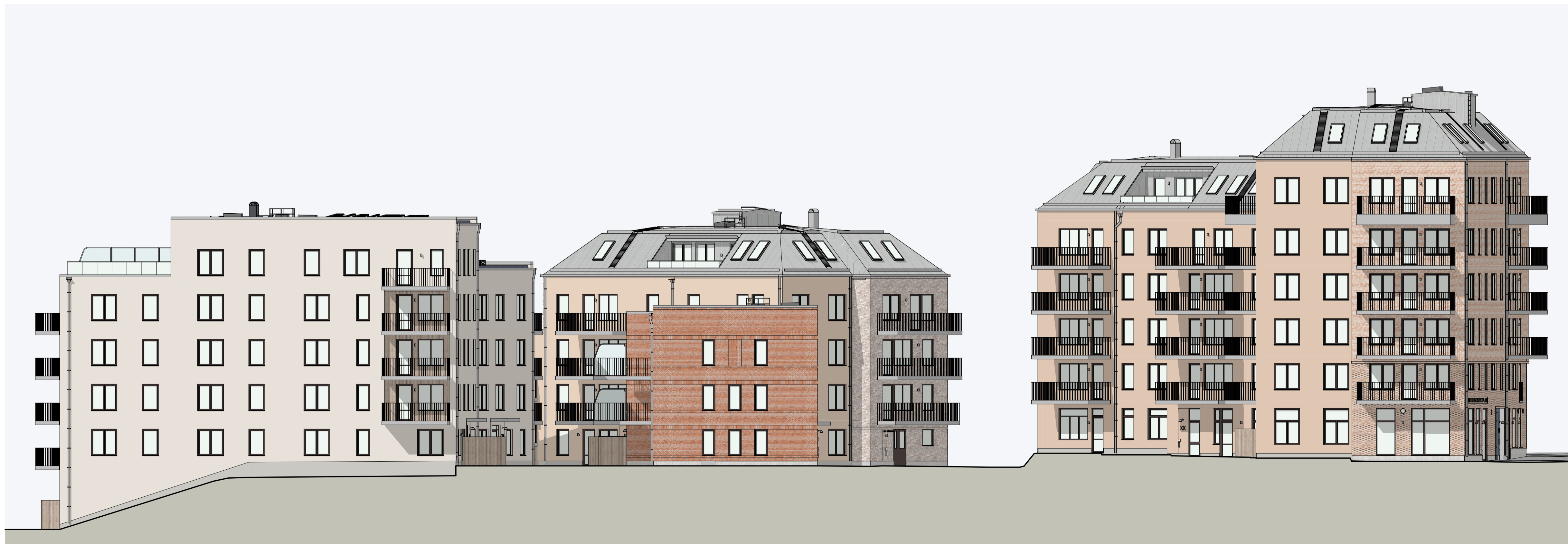
Fasader mot Sydost - Hus L1 R1 P1 P2 1:150