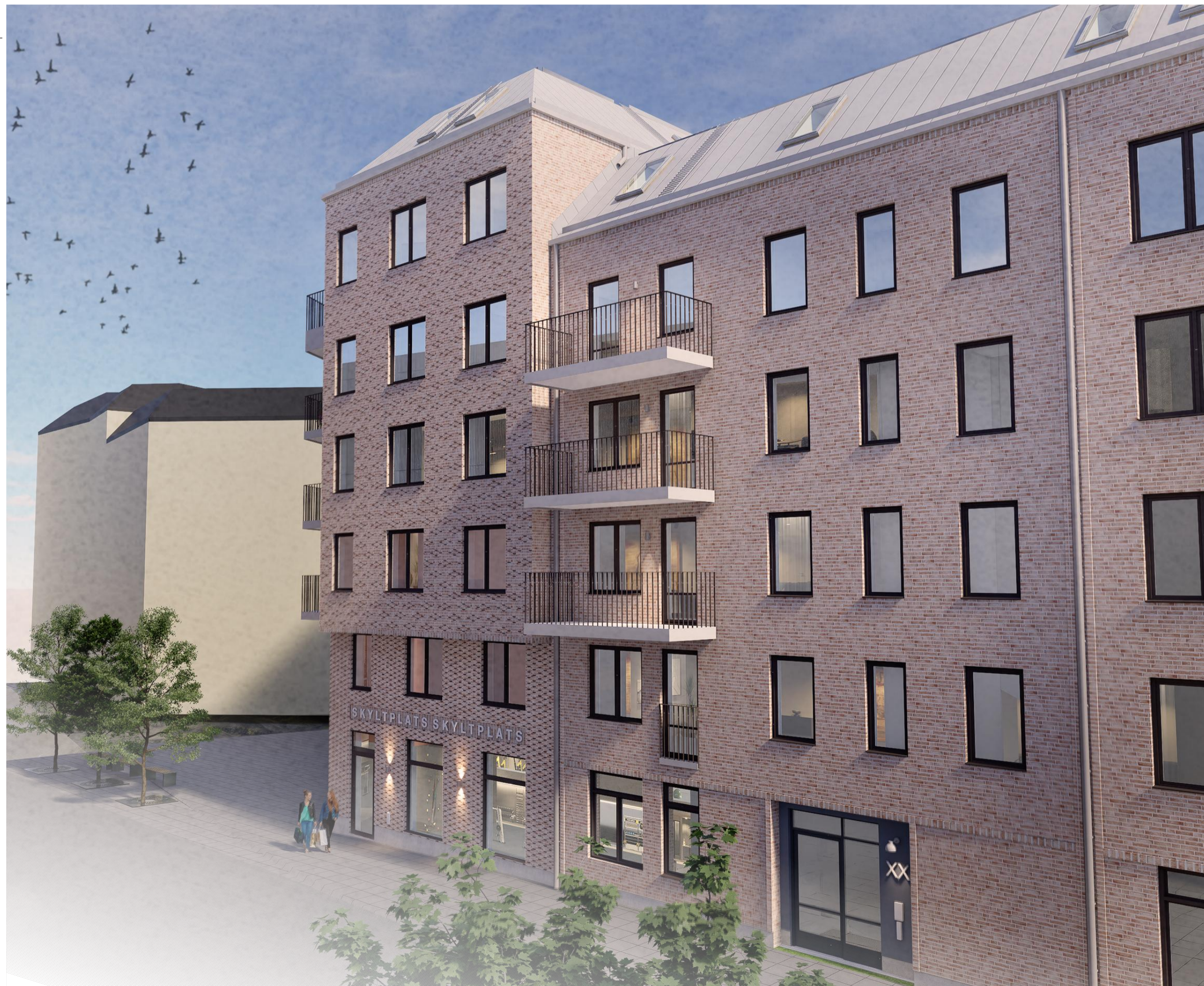
VY BYGGNAD L2 FRÅN NORVÄST