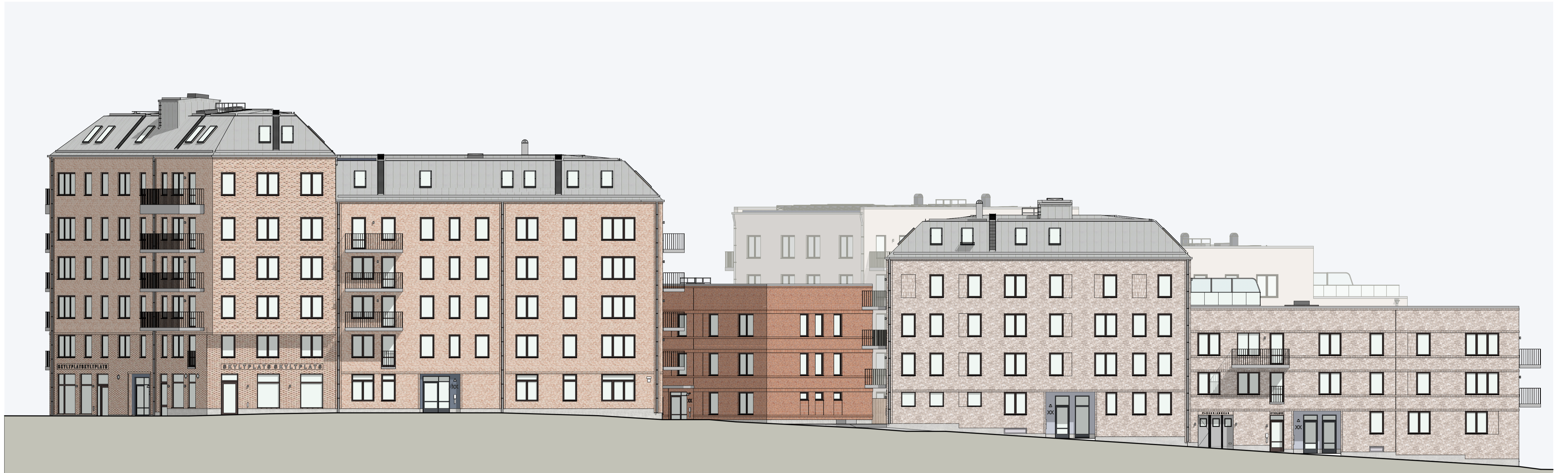
Fasader mot Norr - Hus L1 L2 1:150