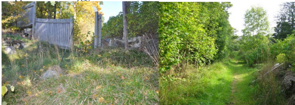
Trappled 1 före utbyggnad

Projektet drevs som planerat. Det är viktigt att kommunen kommunicerar med de boende så att de förstår hur utbyggnaden ska gå till.