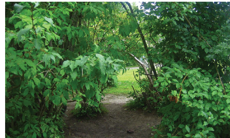
På lekplatsen finns flerabuskgage där det finns tydliga spår av lek. Dessa behålls såklart och får fortsätta glädja barn.