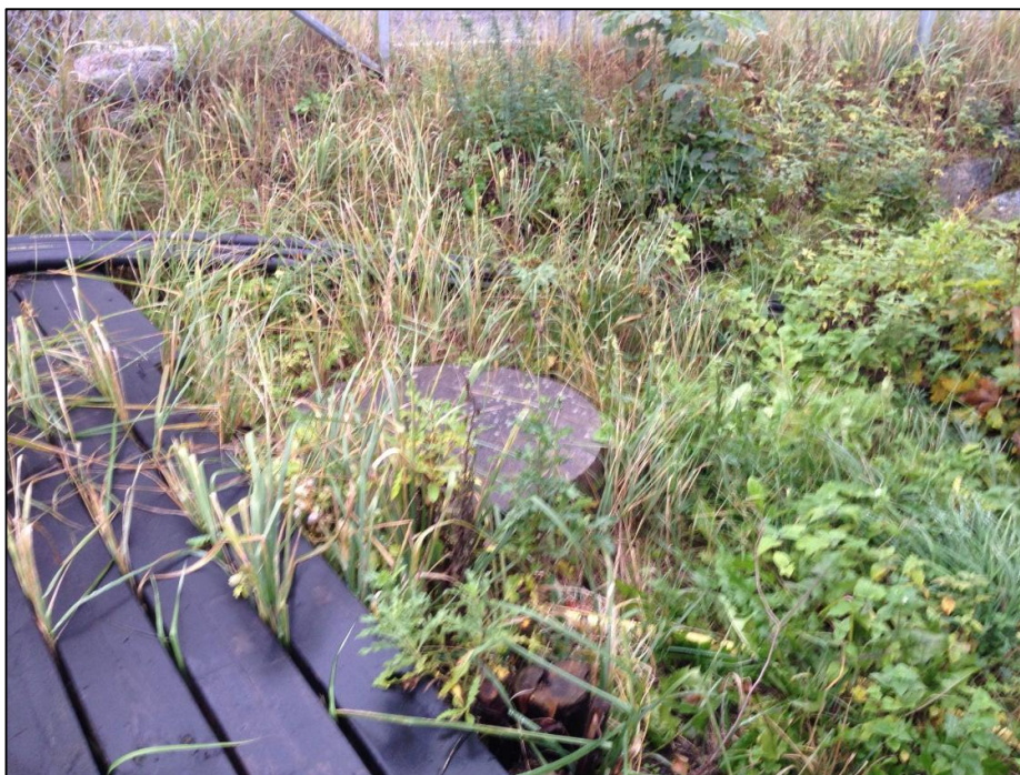
Figur 3. Bilden till vänster visar brunnen på kulverten för bäcken

Vid platsbesök noterades en bäck strax väster om infarten till marinan. Bäckens källa kommer söderifrån och försvinner in i en kulvert under Saltsjöbadsvägen och marinaområdet. I sydöstra hörnet av Navigate Yachts huset finns en brunn som hör till kulverten, se figur 3. Utlopp i Duvnäs-viken kunde inte lokaliseras.