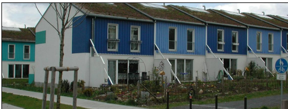
Figur 5. Gröna tak

Gröna tak kallas tak som har en levande vegetationsklädd takbeläggning av exempelvis sedum eller gräs, se figur 5.