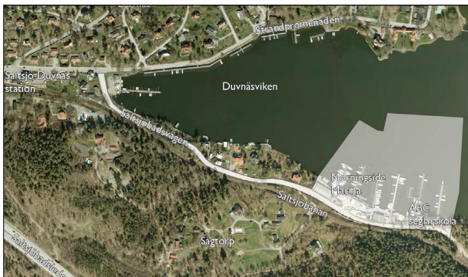
Figur 1. Kartan visar planområdet för Erstavik 25:38 m.fl. (Nacka kommun, 2012)

På uppdrag av Nacka kommun har Norconsult AB gjort denna dagvattenutredning för Program för fastigheten Erstavik 25:38 m.fl., Morningside Marina, se figur 1.