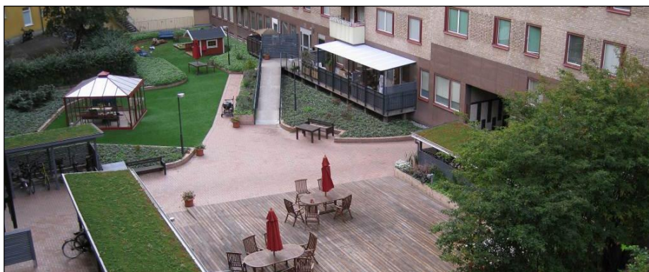
Figur 7. Grön gård i Bergsundsstrand, Stockholm

För att reducera utgående dagvattenflöde är det av stor vikt att hålla nere hårdgörningsgraden, d.v.s. minimera andelen asfalterade eller andra hårdgjorda ytor på gårdar och övriga markytor. Även där det planeras garage under gårdsytan, finns goda möjligheter att anlägga planerade grönytor och genomsläppliga beläggningar som bildar s.k. gröna gårdar mellan husen. I figur 7 visas ett exempel på utformning av en grön gård i centrala Stockholm.