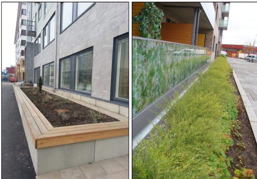
Figur 6. Rain Gardens

Fördröjning av takvattnet kan även ske via så kallade Rain Gardens, se figur 6. Rain Gardens utgörs av växtbäddar med underliggande infiltrationsmaterial som lokalt tar hand om dagvattnet. Rain Gardens föreslås anläggas så att dagvattnet från tak och gårdsmiljöer kan magasineras och infiltreras effektivt inom ca ett dygn efter nederbördstillfället. Bara under korta perioder i samband med kraftiga regn kommer en regnträdgård att ha någon synlig vattenyta. I botten av varje Rain Garden föreslås en dräneringsledning anläggas, för avtappning av utjämnat dagvattenflöde till dagvattenledning. Genom att välja lämplig dimension på utloppsledningen kan avtappningen från respektive Rain Garden regleras.