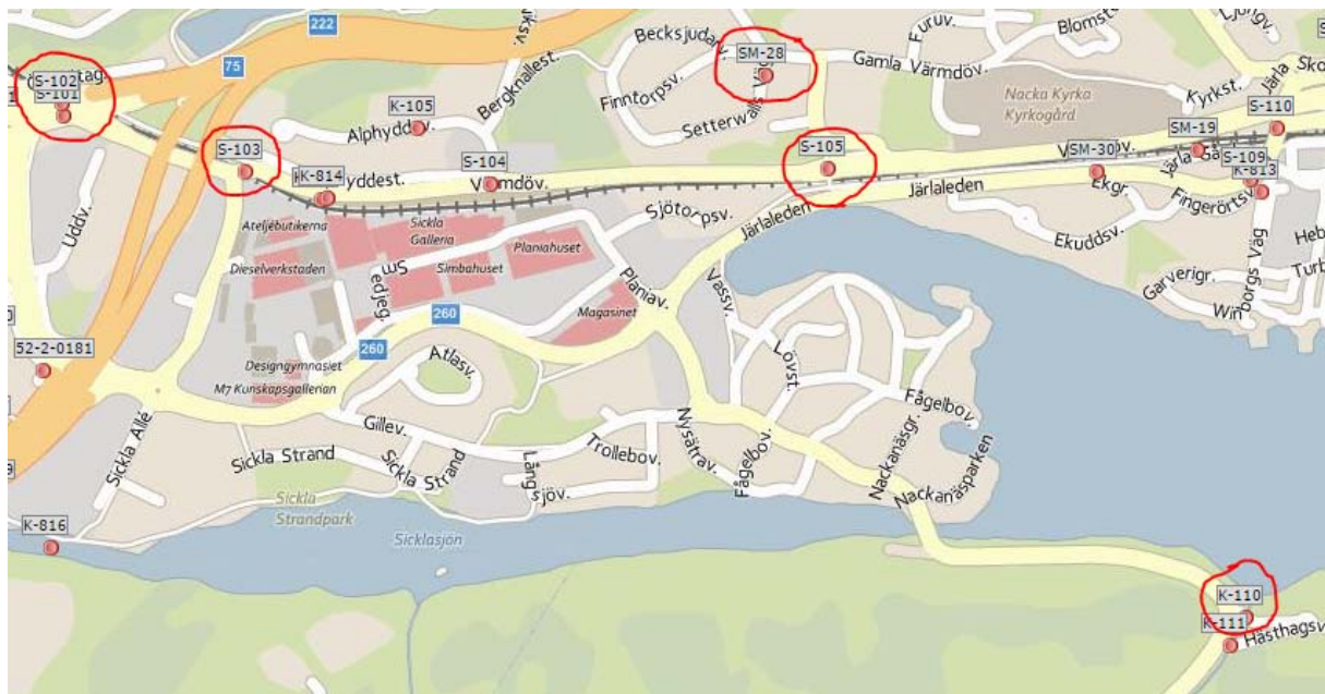
Figur 1 - broförnyelser 2015-2030, objekt 1-5