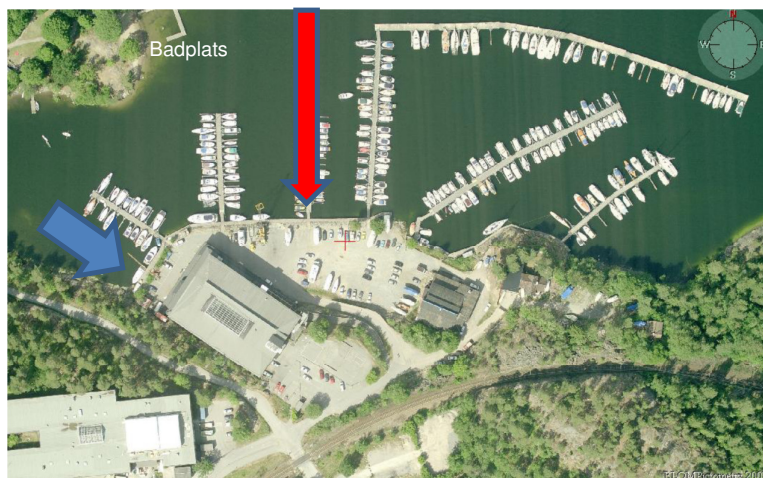
Bild 3 Marinans västra del, dagens situation. Förslag till placering av sjösättningsramp markerad med blå pil. Röd pil visar nytt läge för huvudpir. Badplatsens brygga syns på holmens östra strand.

De som skall till marinans västra del kommer att gå med båten mer parallellt och minst 20 meter närmre badplats och stranden än idag då ny huvudpiren placeras längre västerut. Risk finns att badande simmar ut från stranden och konflikter uppstår. Avstånd mellan bryggan och den nya piren blir 60-70 meter.