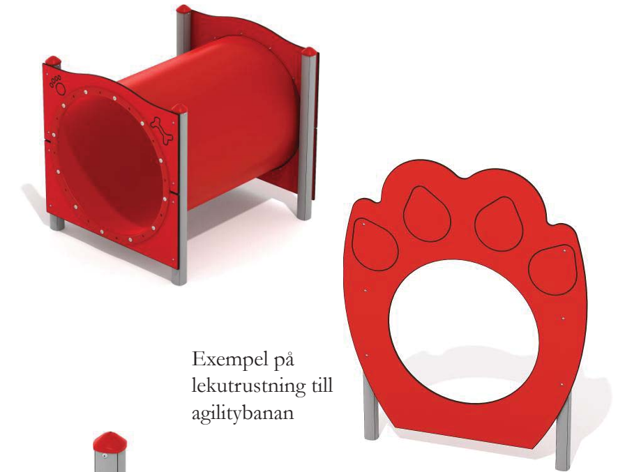
Exempel på lekutrustning till agilitybanan