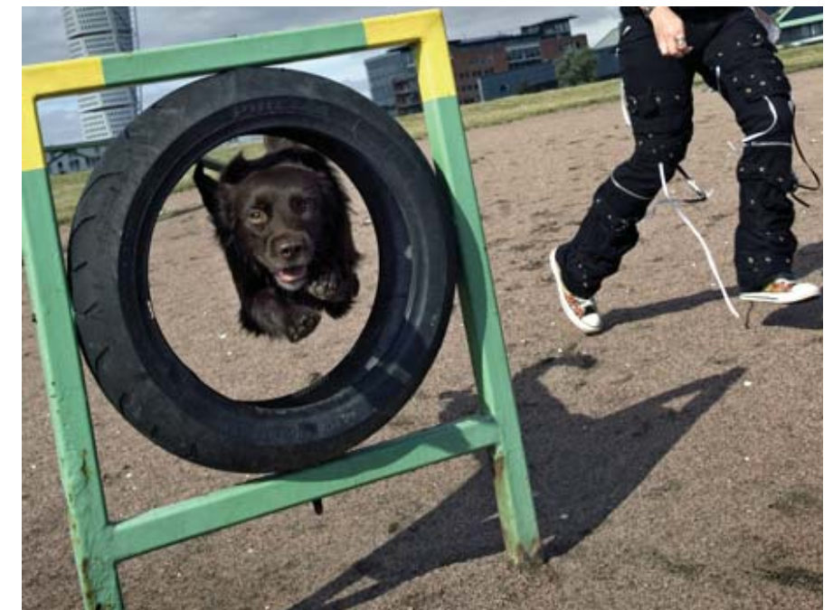
Hundrastgårdarna i Nacka ska erbjuda såväl lugn som aktivitet för hundar och hundägare. Det ska finnas valmöjlighet mellan sol och skugga och de ska ha god skyltning.