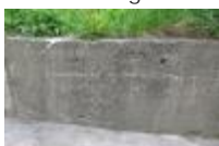
5 - Stödmur - Armerad betong - Gjutsår 2015-05-27