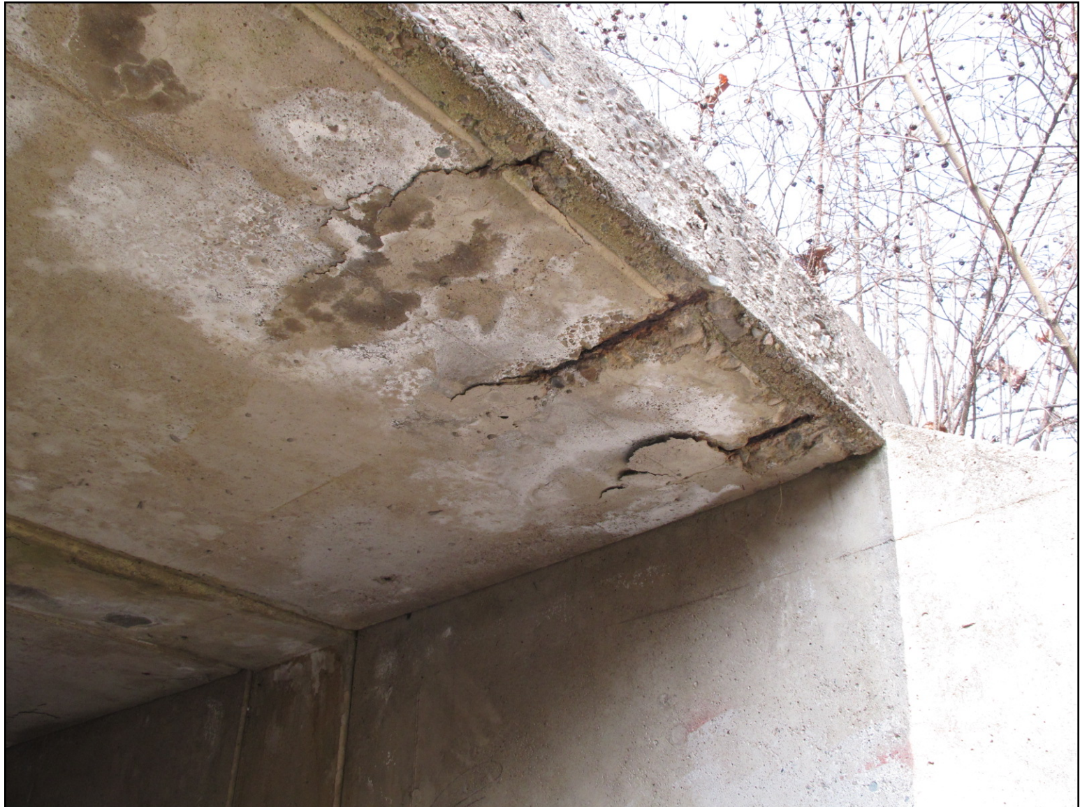
2 - Platta - Armeringsstål - Korrosion 2010-04-27 Ett flertal spjälkningar samt vittringar