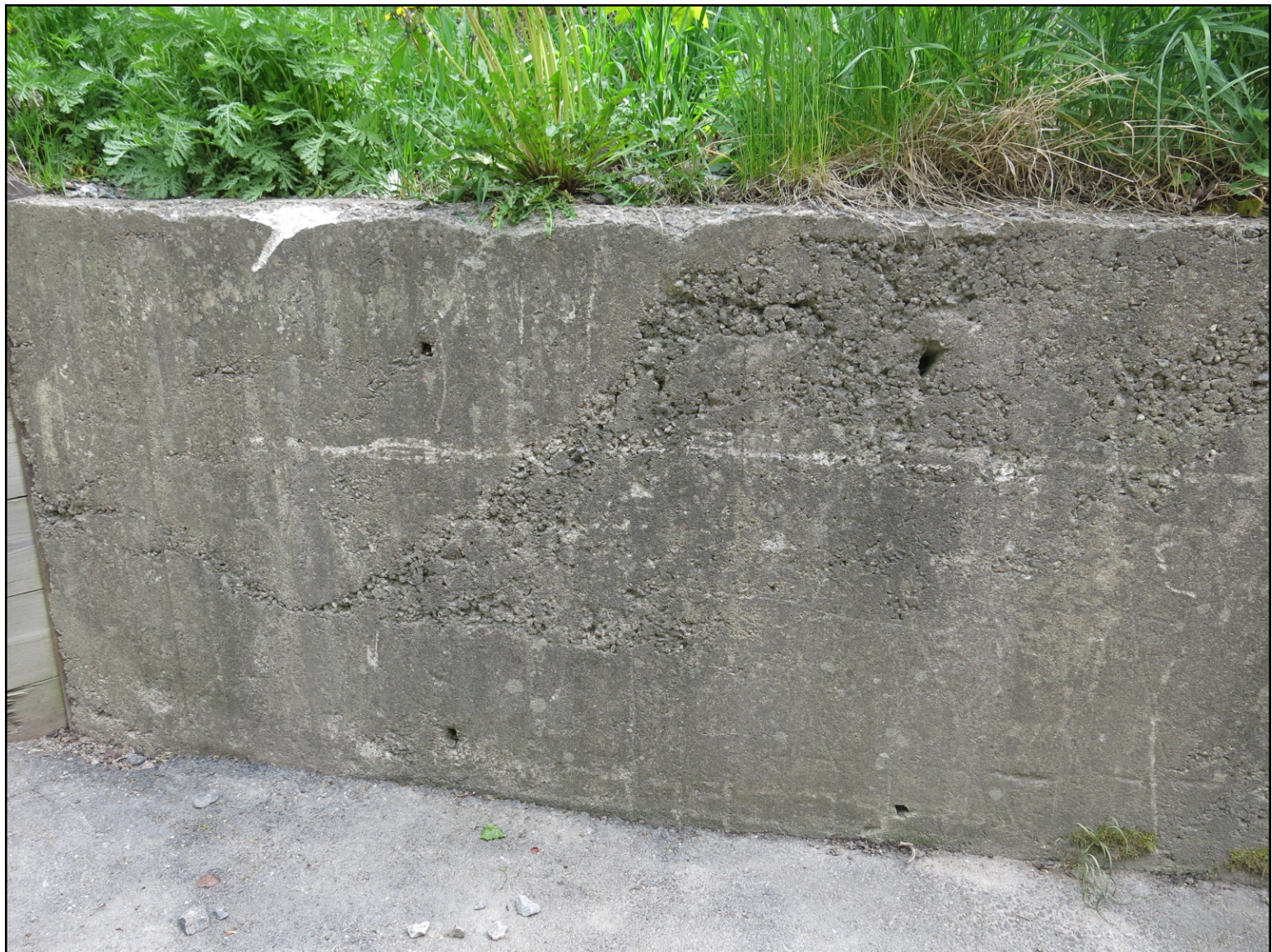
5 - Stödmur - Armerad betong - Gjutsår 2015-05-27