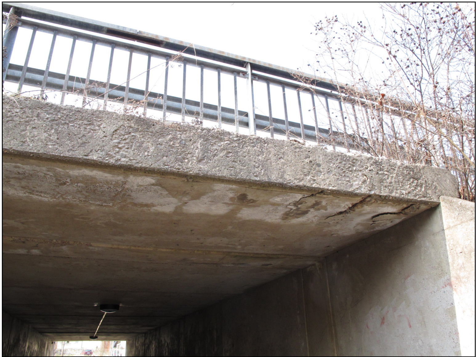
2 - Platta - Armeringsstål - Korrosion 2010-04-27 Ett flertal spjälkningar samt vittringar