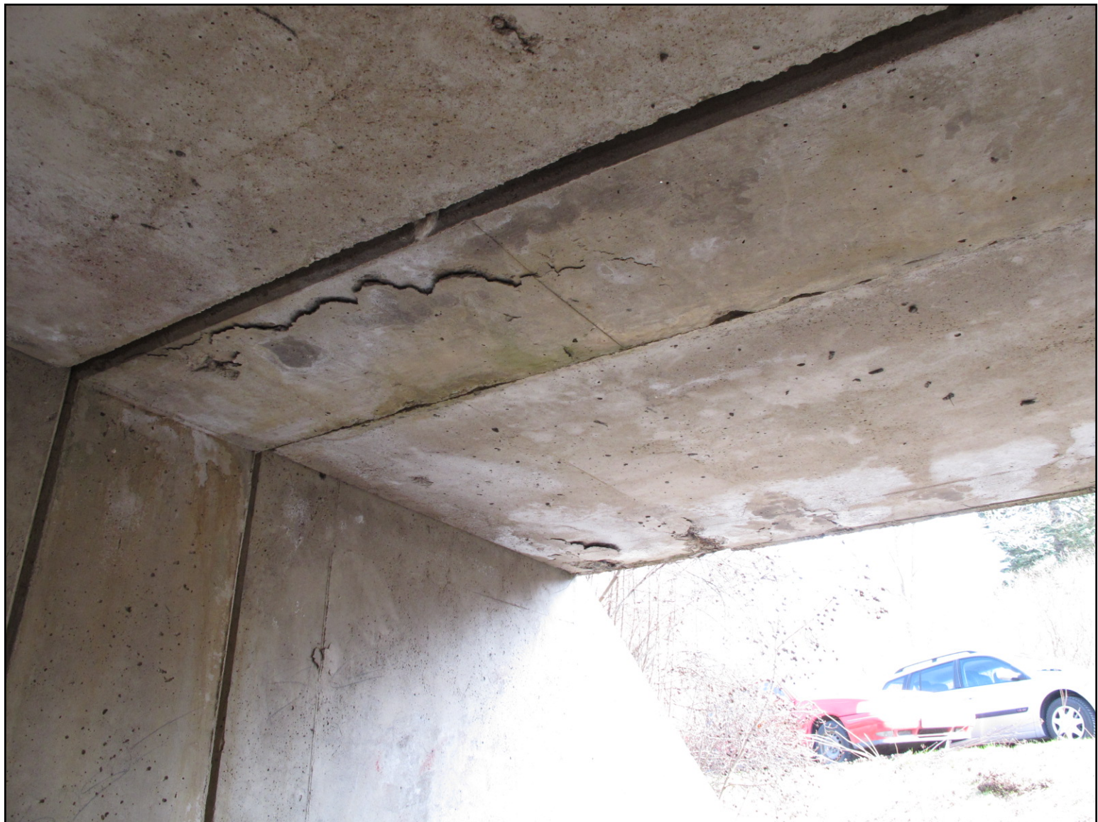
2 - Platta - Armeringsstål - Korrosion 2010-04-27 Ett flertal spjälkningar samt vittringar