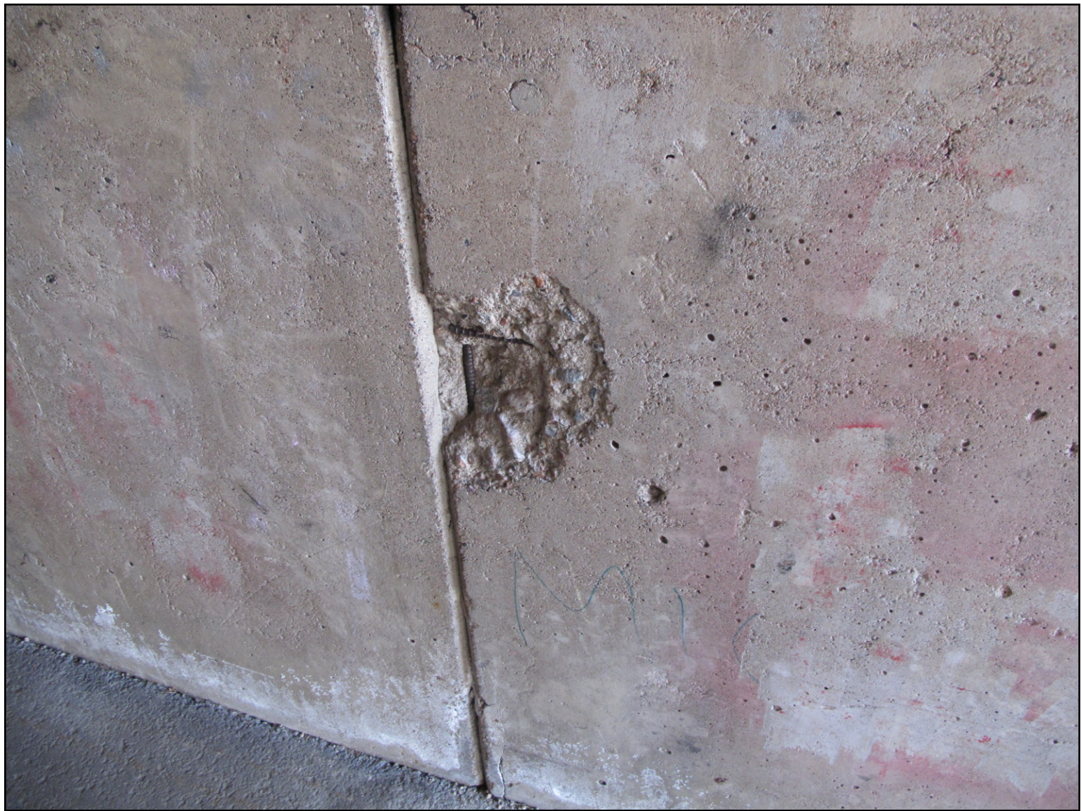
1 - Frontmur - Armeringsstål - Korrosion 2010-04-27 Ett flertal spjälkningar och vittringar