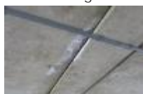
4 - Tätskikt - Gjutafalt - Defekt 2015-05-27

Ett flertal spjälkningar samt vittringar