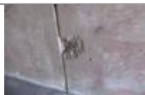
1 - Frontmur - Armeringsstål - Korrosion 2010-04-27