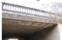
2 - Platta - Armeringsstål - Korrosion 2010-04-27

Ett flertal spjälkningar samt vittringar