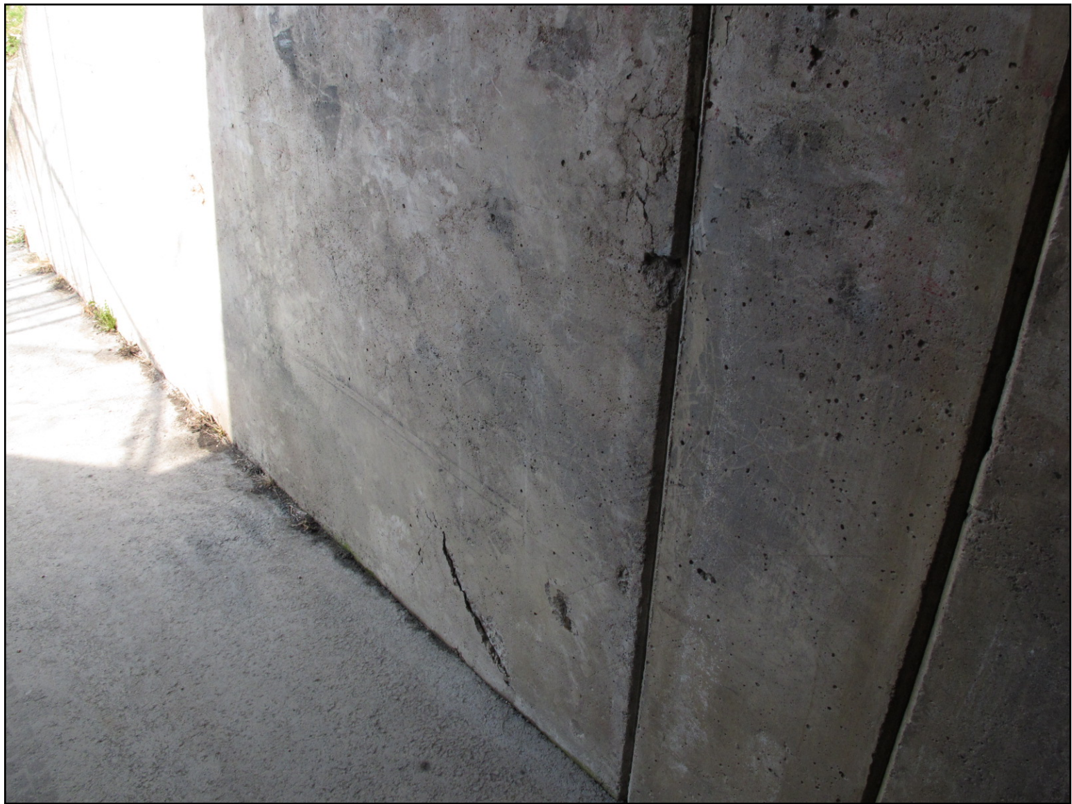
1 - Frontmur - Armeringsstål - Korrosion 2010-04-27 Ett flertal spjälkningar och vittringar