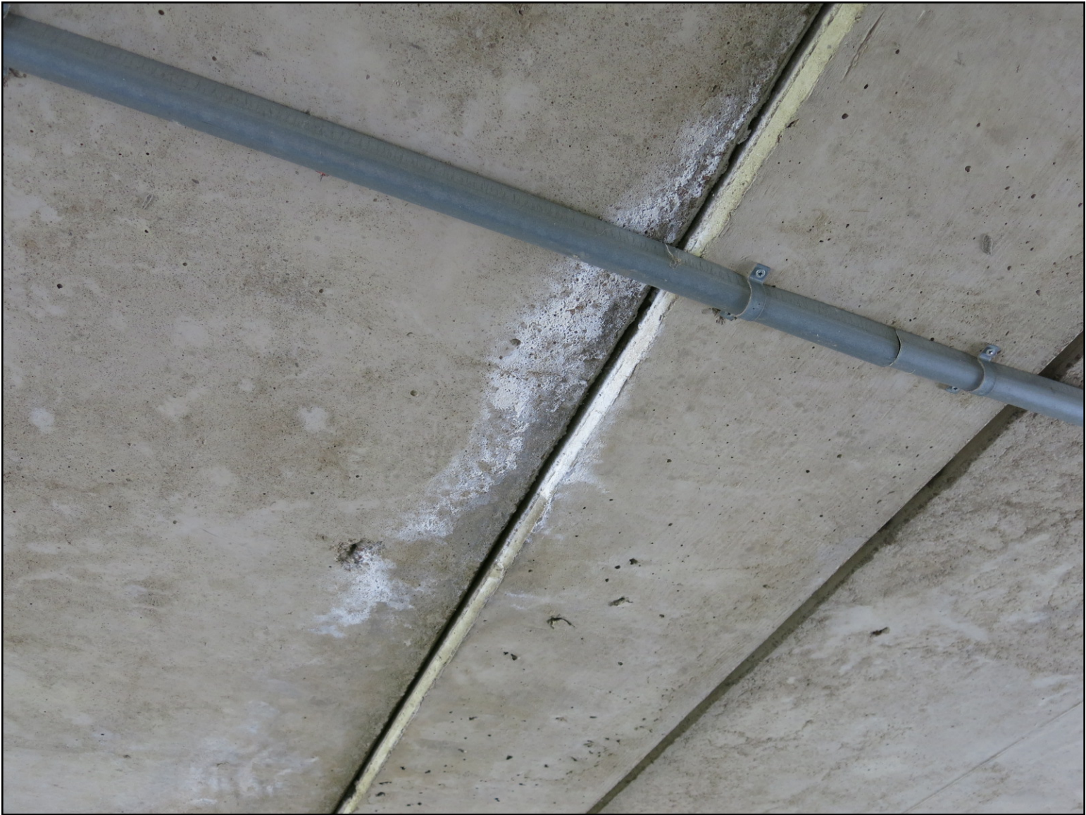
4 - Tätskikt - Gjutafalt - Defekt 2015-05-27