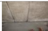
1 - Frontmur - Armeringsstål - Korrosion 2010-04-27