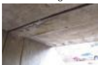
2 - Platta - Armeringsstål - Korrosion 2010-04-27