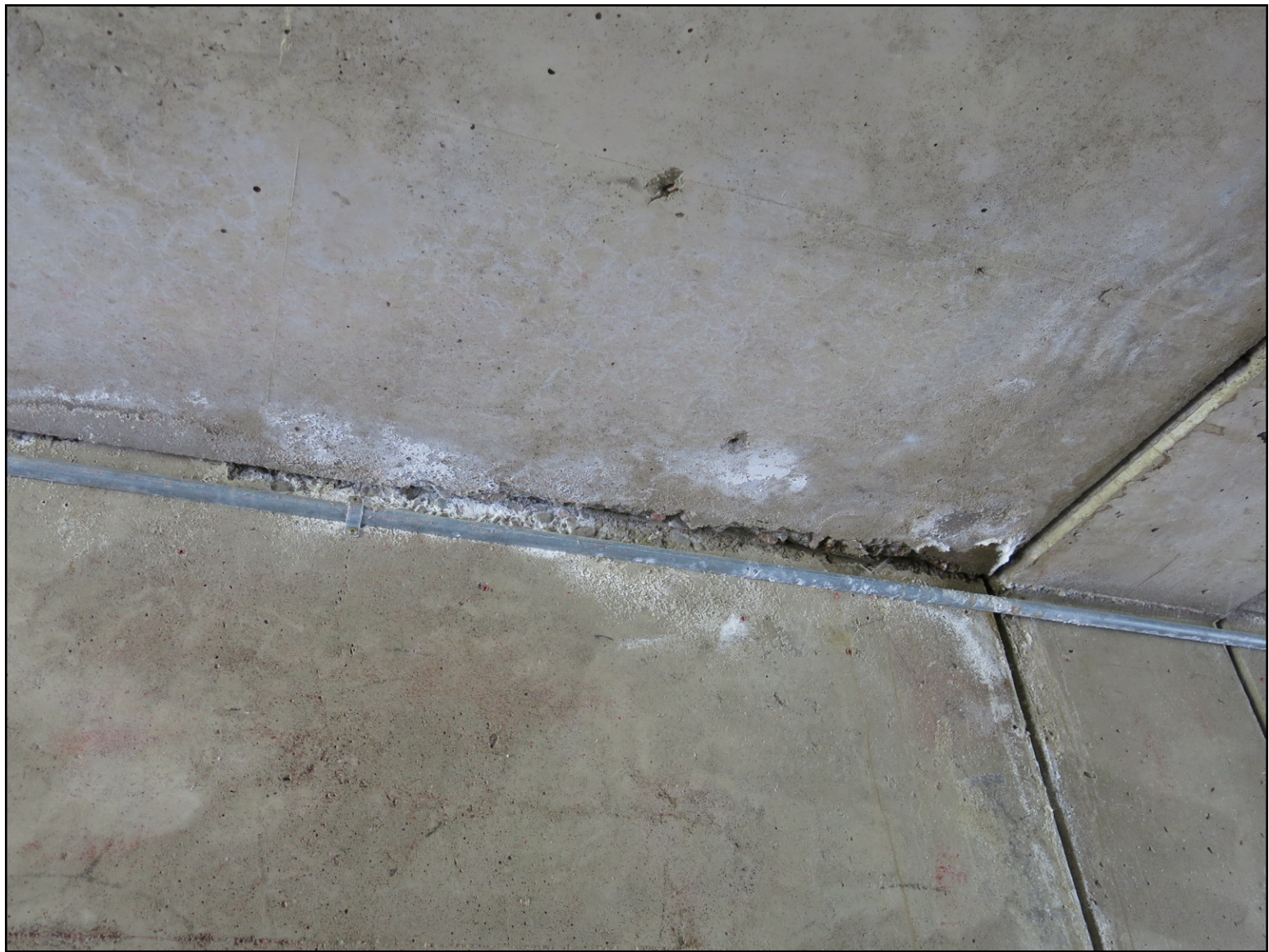
4 - Tätskikt - Gjutasfalt - Defekt 2015-05-27