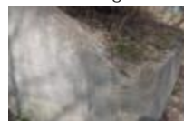
3 - Vingmur - Armeringsstål - Korrosion 2010-04-27