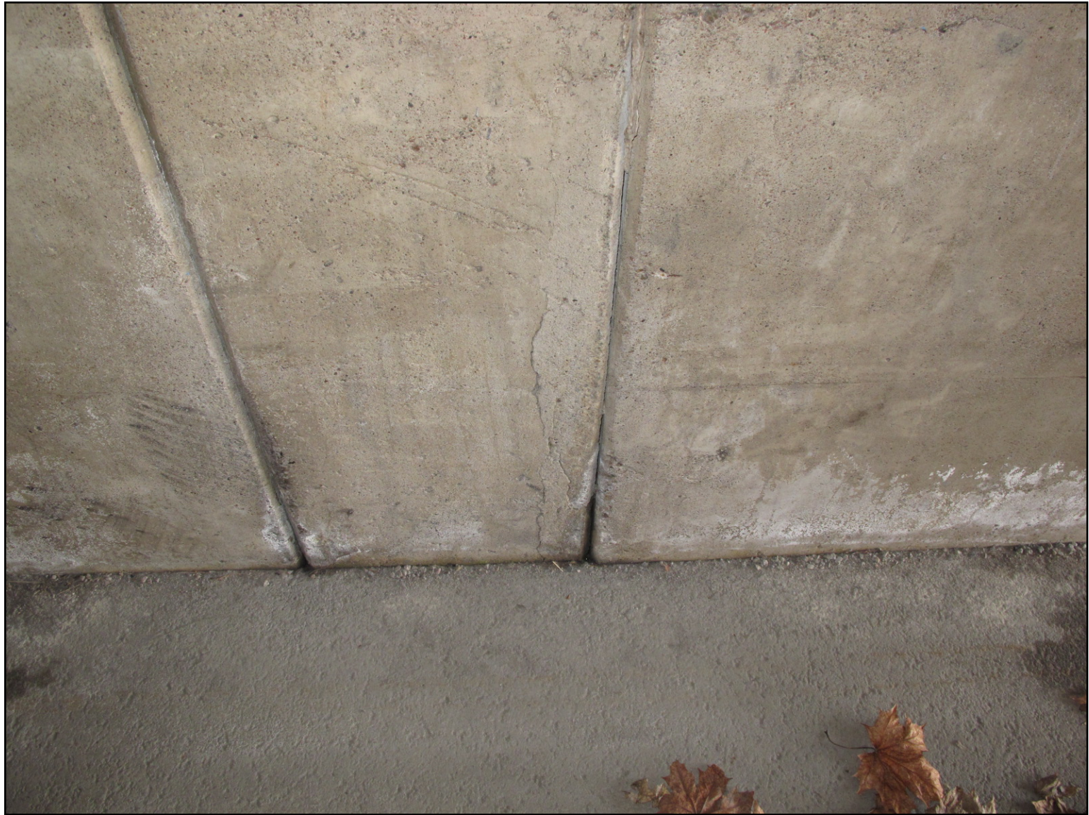
1 - Frontmur - Armeringsstål - Korrosion 2010-04-27 Ett flertal spjälkningar och vittringar