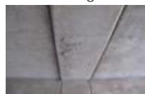
2 - Platta - Armeringsstål - Korrosion 2010-04-27