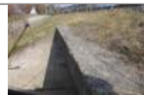
2 - Platta - Armeringsstål - Korrosion 2010-04-27