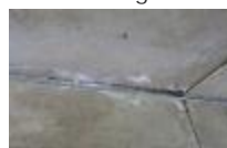
4 - Tätskikt - Gjutafalt - Defekt 2015-05-27