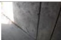
1 - Frontmur - Armeringsstål - Korrosion 2010-04-27