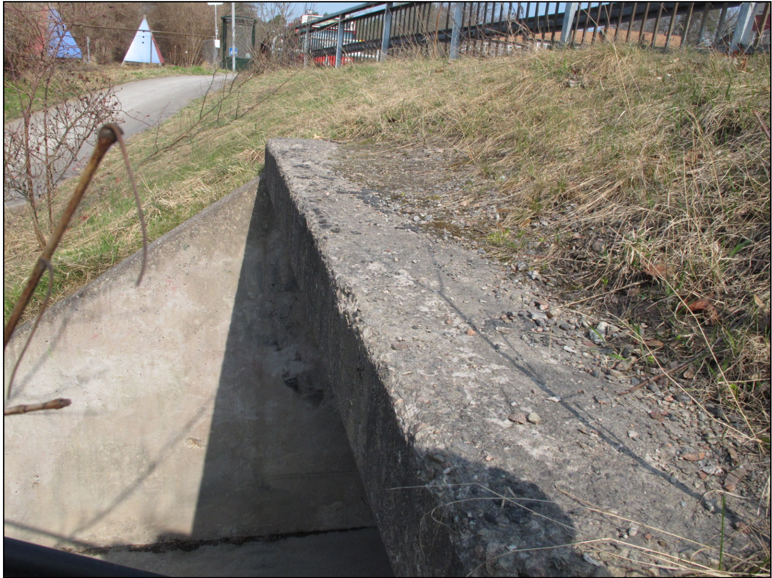
2 - Platta - Armeringsstål - Korrosion 2010-04-27 Ett flertal spjälkningar samt vittringar