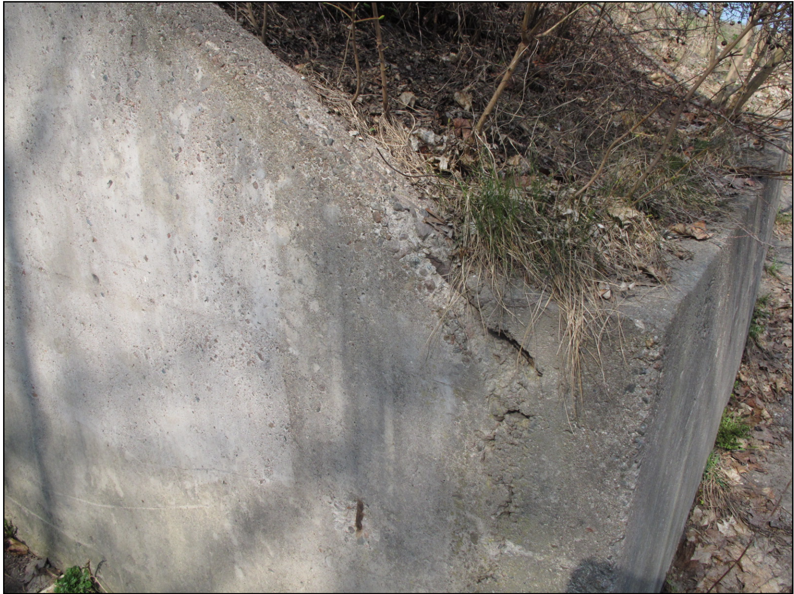
3 - Vingmur - Armeringsstål - Korrosion 2010-04-27 Ett flertal spjälkningar samt vittringar