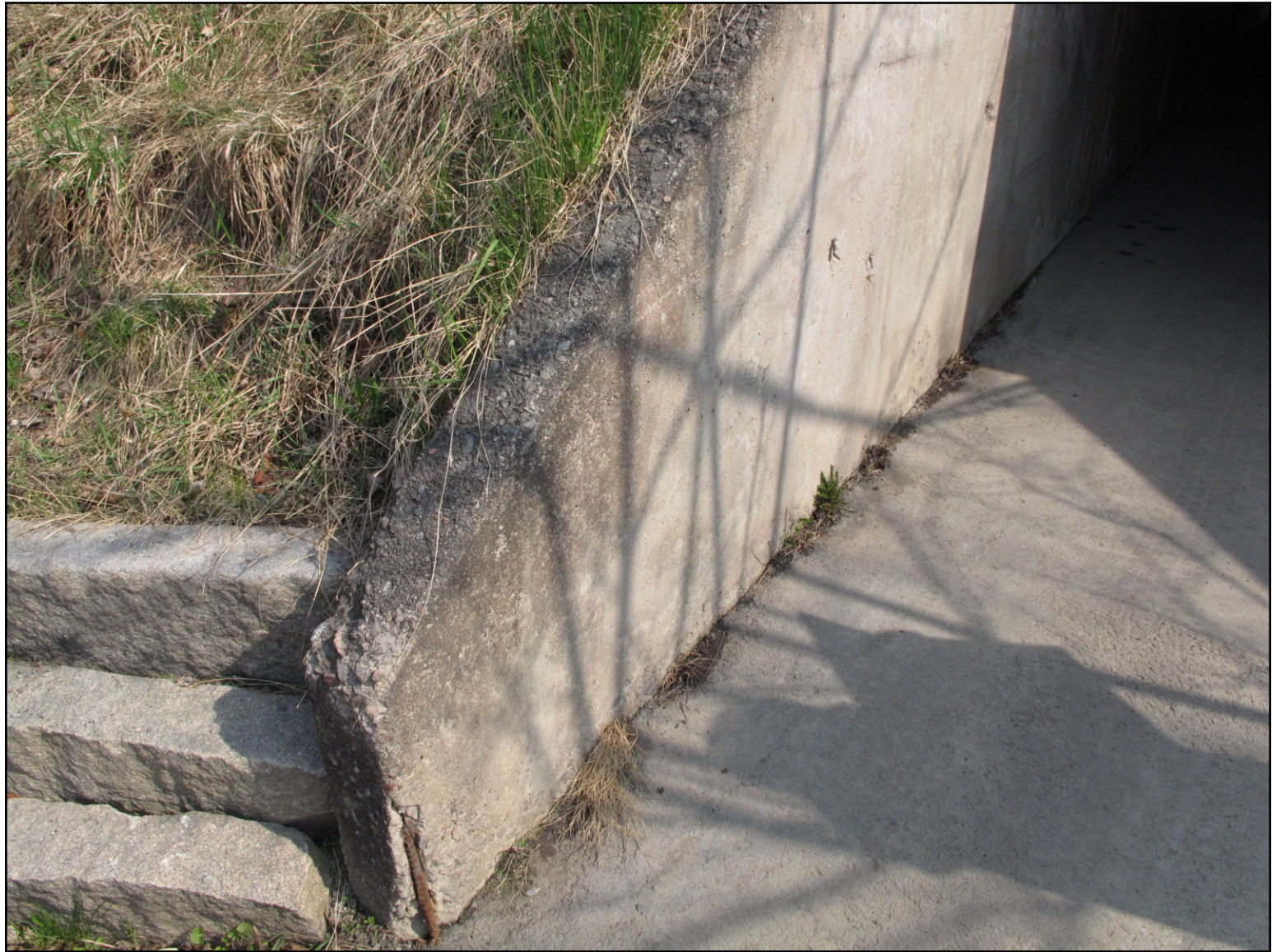
3 - Vingmur - Armeringsstål - Korrosion 2010-04-27 Ett flertal spjälkningar samt vittringar