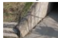
3 - Vingmur - Armeringsstål - Korrosion 2010-04-27

Ett flertal spjälkningar samt vittringar