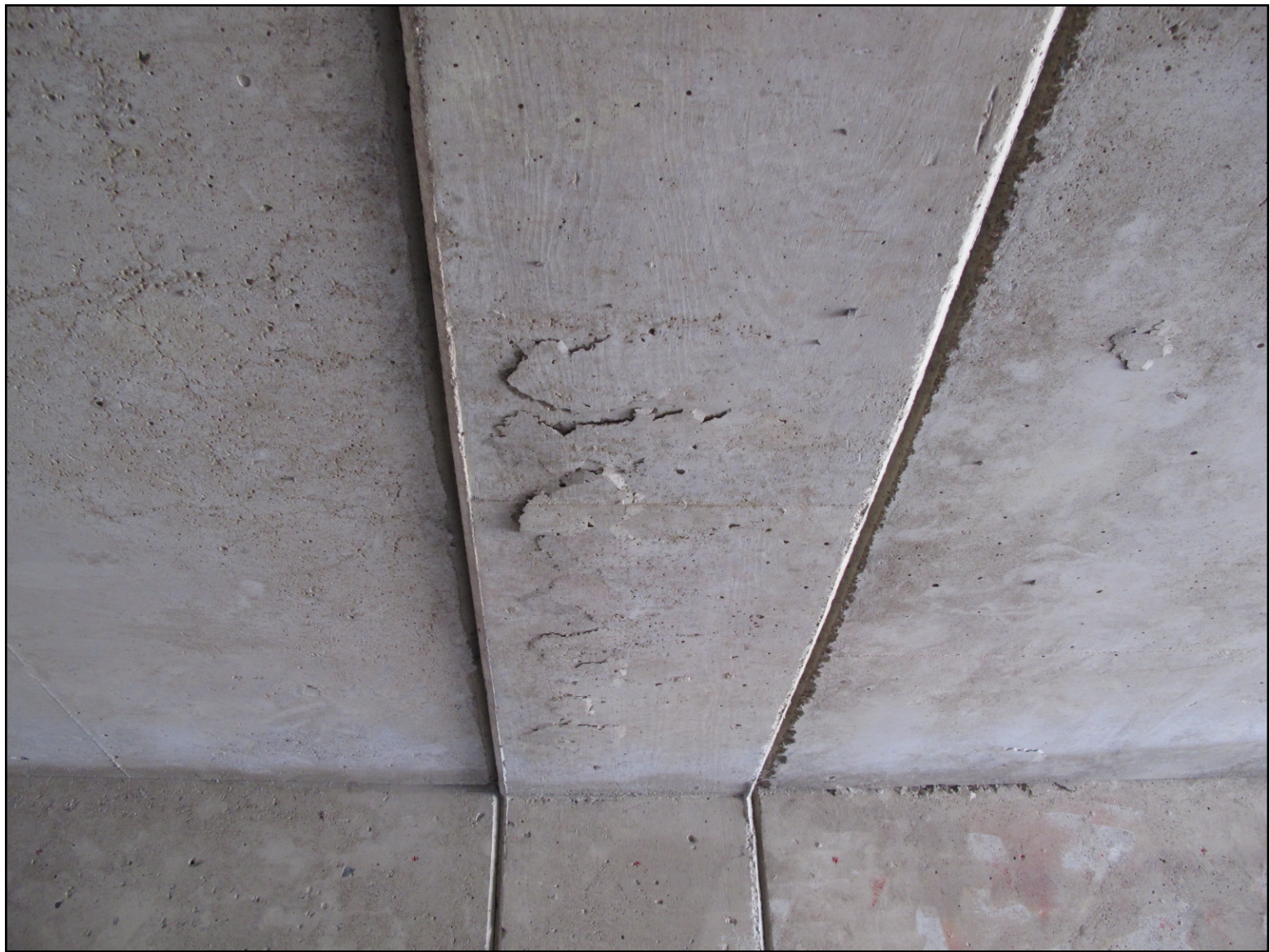
2 - Platta - Armeringsstål - Korrosion 2010-04-27 Ett flertal spjälkningar samt vittringar