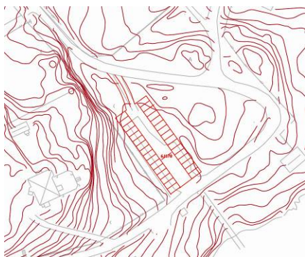
Bild 6. Effektivisering av parkeringsytan vid Boo brygga med 32 bilplatser

I enlighet med detaljplanen för Boo brygga kan parkeringsytan inrymma 32 bilplatser. En ytterligare justering som kan göras är att öppna upp parkeringen så att den syns tydligare från Boovägen. Idag kantstensparkeras det längs Boovägen och Baggensvägen trots att det inte är fullbelagt på parkeringsytan.