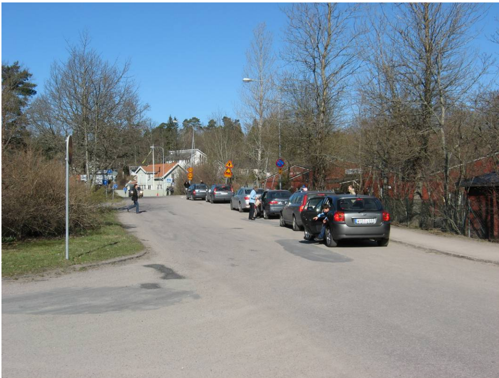
Bild 3. Morgonlämning vid skolan

En enkel förbättring som kan göras är att låta PG's gatukrögeri få en bom vid sin parkering som öppnas och stängs då restaurangen gör det (10 till 20).