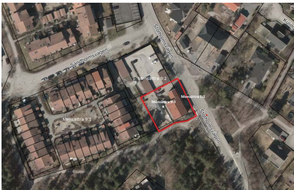
Kartan visar ett flygfoto över ungefärligt planområde (röd markering) samt fastighetsytor (svarta linjer)

Planområdet ligger i Orminge cirka en kilometer öster om Orminge centrum. Planområdet omfattar fastigheten Mensättra 9:3 som ägs utav Kalvgrund AB samt delar av den kommunala fastigheten Mensättra 1:1. Planområdet angränsar till Storholmsvägen i nordöst, parkeringsgarage i nordväst, grönområde i sydöst samt till ett radhusområde i sydväst. Planområdet omfattar cirka 870 kvadratmeter varav 690 kvadratmeter tillhör Mensättra 9:3.