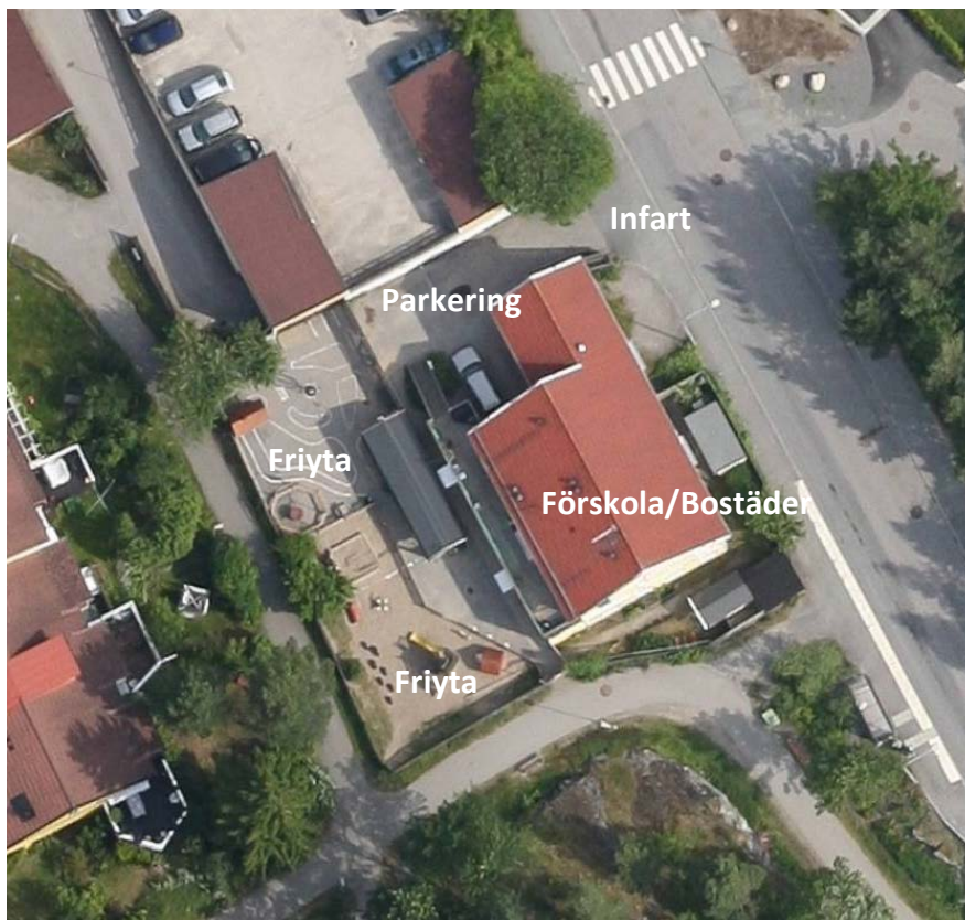
Flygfoto som visar befintlig användning av fastigheten

De lokaler i bottenplan som den befintliga förskoleverksamheten använder, klarar idag luftflödeskrav samt akustik, trots en något avvikande rumshöjd.