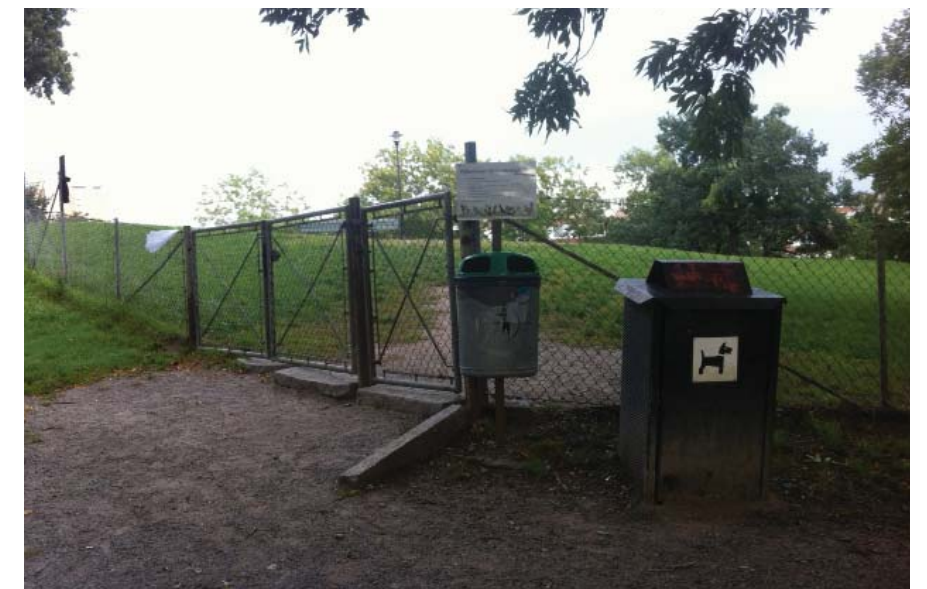
Hundrastgårdar i andra kommuner. Till höger Stockholm, nedan Norrköping.