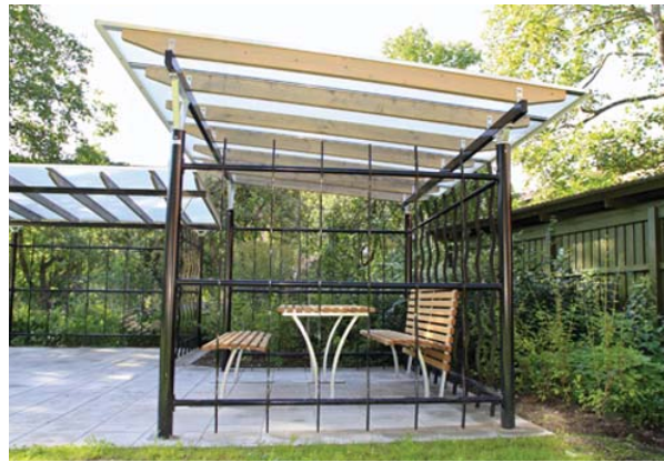
Exempel på väderskydd