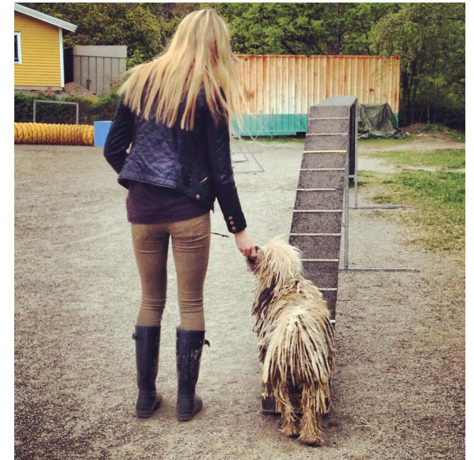
På Apportvägen i Duvnäs Utskog finns Nacka Brukshundsklubb. Här finns bl.a. ytor för att träna sin hund, tävlingsplaner och klubbhus.

Kopplingstvånget medför att det idag i Nacka endast finns några mindre naturområden som ligger utanför detaljplanelagda områden där det är lagligt att släppa sin hund lös. Dessa visas på kartan på sid 6. Behovet av iordningställda hundrastgårdar har efter införandet av kopplingstvång ökat markant. Sedan 2008 har kommunen arbetat aktivt med att iordningställa hundrastgårdar som är trivsamma för såväl människor som hundar och de är mycket uppskattade.