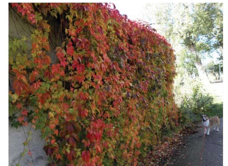
Klättrväxter mot mur