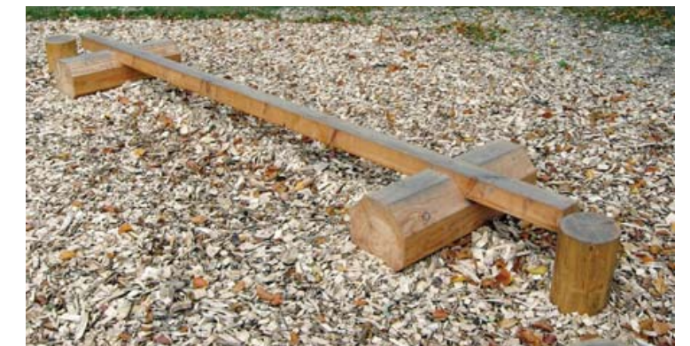
Exempel på lekrustning, balansbom