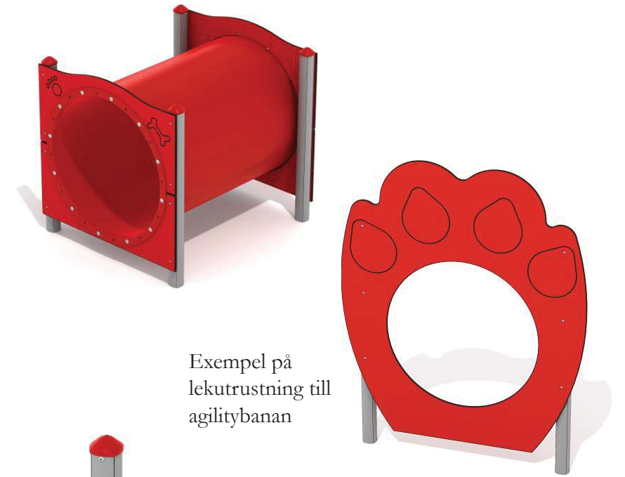
Exempel på lekutrustning till agilitybanan