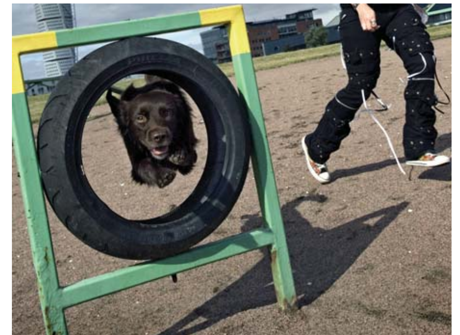
Hundrastgårdarna i Nacka ska erbjuda såväl lugn som aktivitet för hundar och hundägare. Det ska finnas valmöjlighet mellan sol och skugga och de ska ha god skyltning.