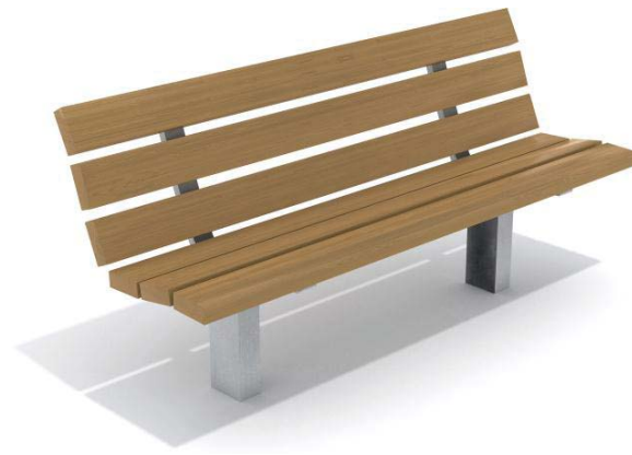
Exempel på bänk