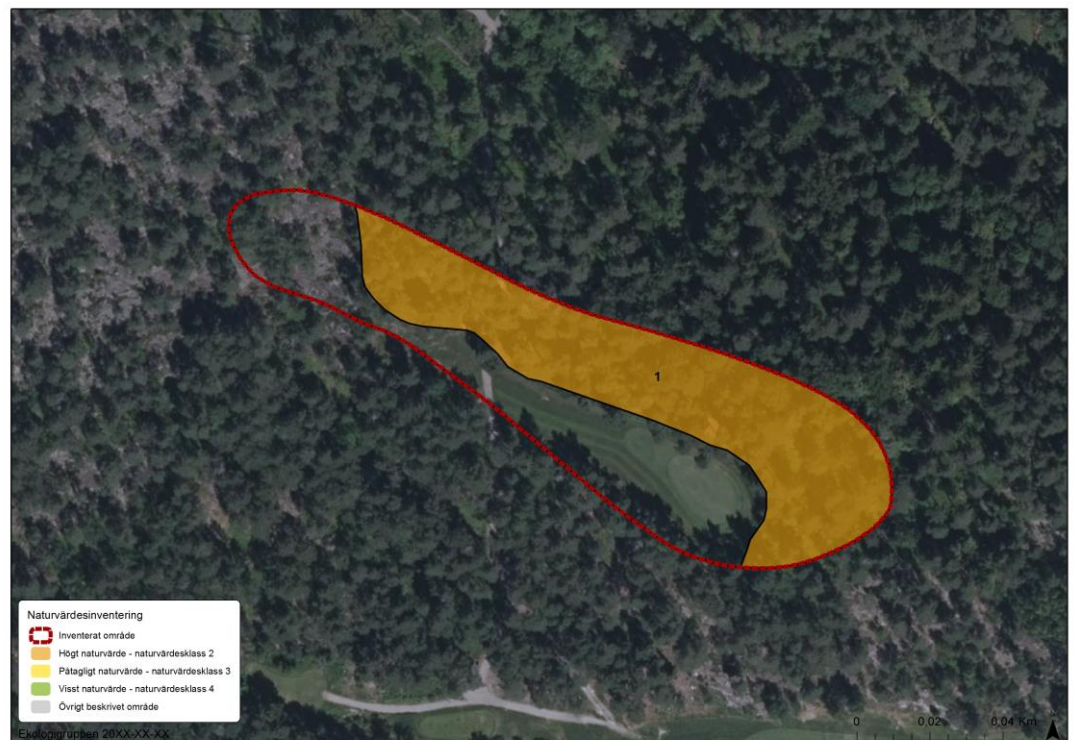
Figur 2. Kartan med naturvärden vid Nacka golfbana. Områden som inte är avgränsade/markerade når inte upp till någon naturvärdesklass.