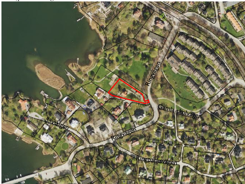
Kartan visar ett flygfoto över planområdet och omringliggande bebyggelse.

Fastigheten Rösunda 9:14 omfattar cirka 2344 kvadratmeter och är bebyggd med en huvudbyggnad om cirka 125 kvadratmeter byggnadsarea och ett garage om cirka 40 kvadratmeter byggnadsarea. Komplementbyggnaden är planstridig i byggnadsareaavseende och står delvis på prickmark. Huvudbyggnaden är byggd i två plan, med en nockhöjd om cirka 10,5 meter. Huvudbyggnaden är planstridig i nockhöjdsavseende. Tomten karaktäriseras av en friliggande villa i ett centralt läge, omgiven av grönska. Fastigheten Rösunda 9:15 är kommunalt ägd, cirka 2790 kvadratmeter och har markanvändning park. Det är enbart cirka 40 kvadratmeter som omfattas av Dp 268, och som ingår i detaljplaneförslaget.