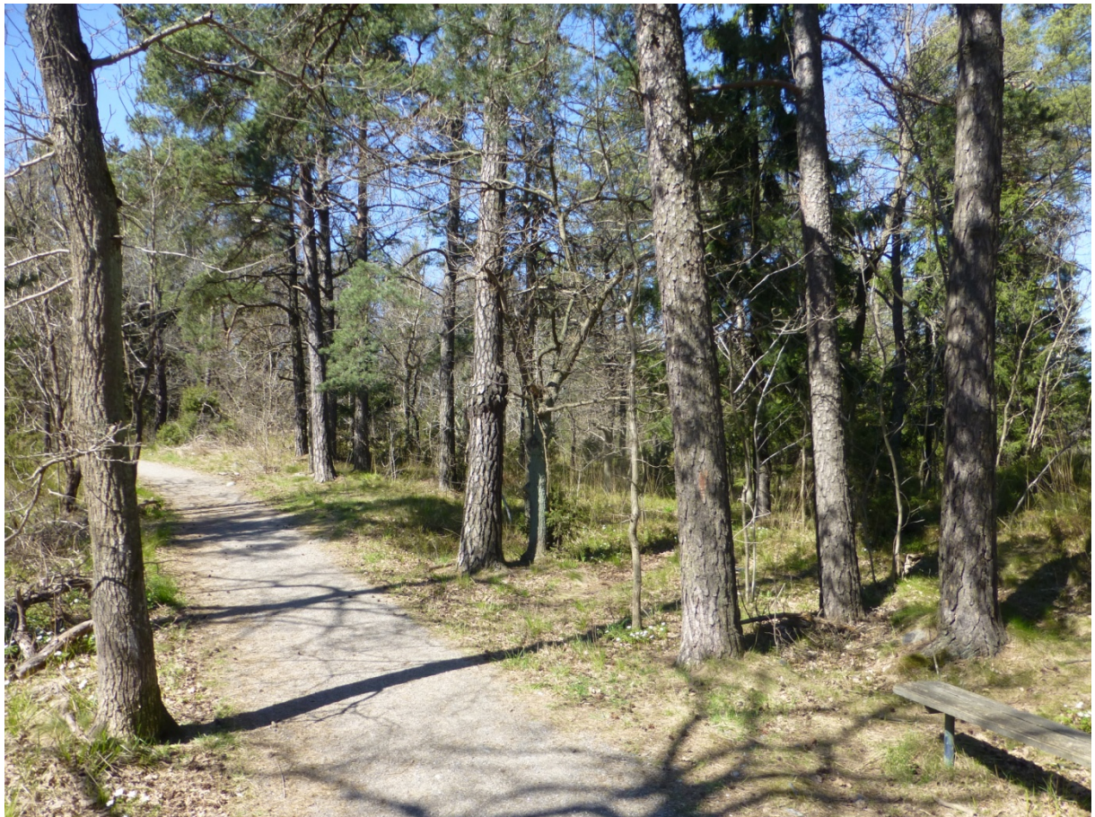
Delyta 3. Vy av promenadstråkets början från Ektorpsvägen.

Vid ett genomförande av byggplanerna är det troligtvis svårt att bibehålla de höga naturvärdena eller kompensera för de stora biologiska och ekologiska förlusterna.