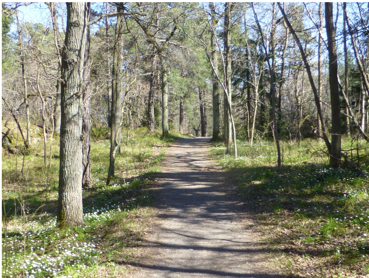
Vy av delyta 3. Avsnitt av promenadstråk som leder österut.