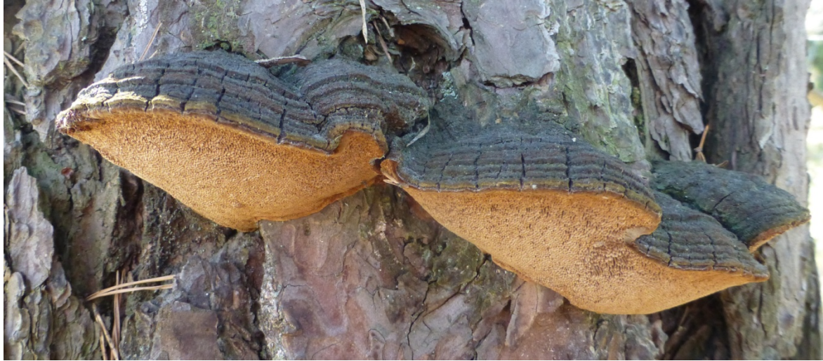
Fruktkroppar av tallticka.

gammeltallar. Ett särskilt intressant fynd var ett vuxet exemplar av den klarröda skalbaggen barkrödrock. Den är rödlistad och knuten till gamla ekmiljöer. Även i detta delområde noterades hackmärken, "ringhack", av tretåig hackspett.