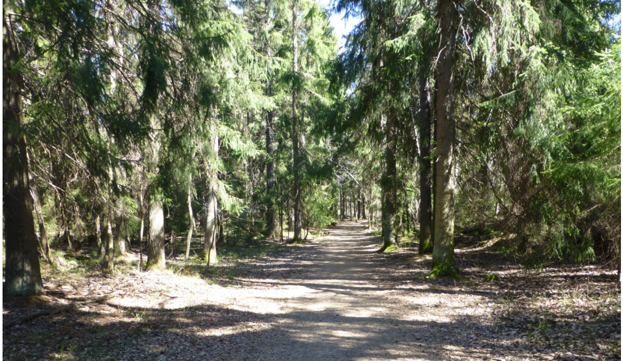
Vy från delyta 1. Promenadstråk som leder österut.