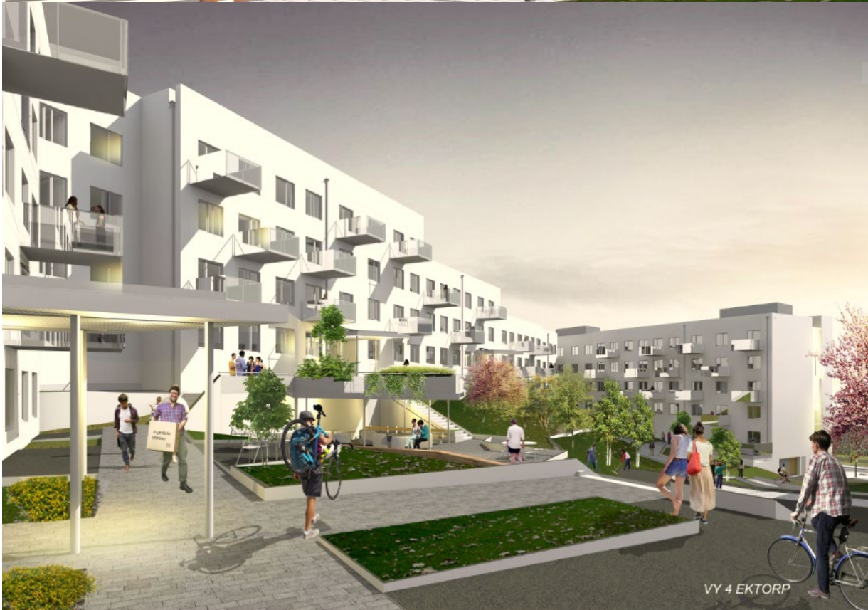
Skisser från markanvisningstävlingen