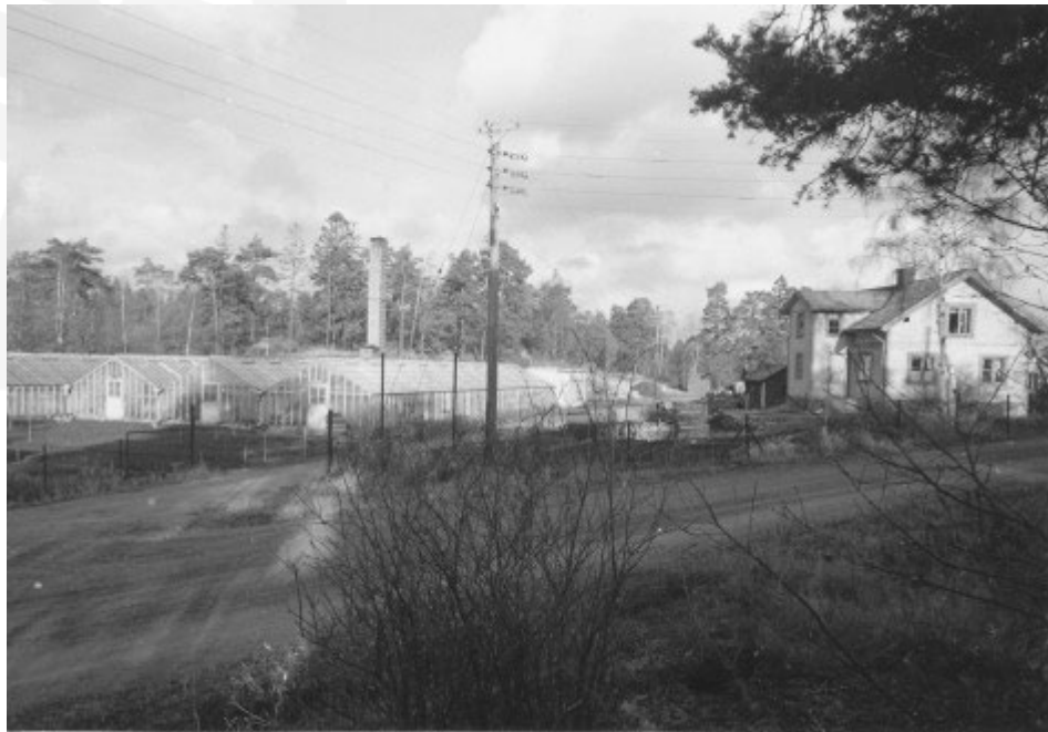
Figur 4. F.d. handelsträdgård vid Ektorpsvägen 19, år 1950.