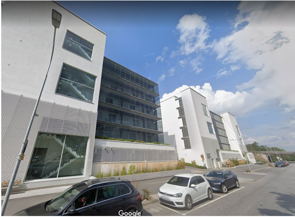
Foto från Ektorpsvägen.