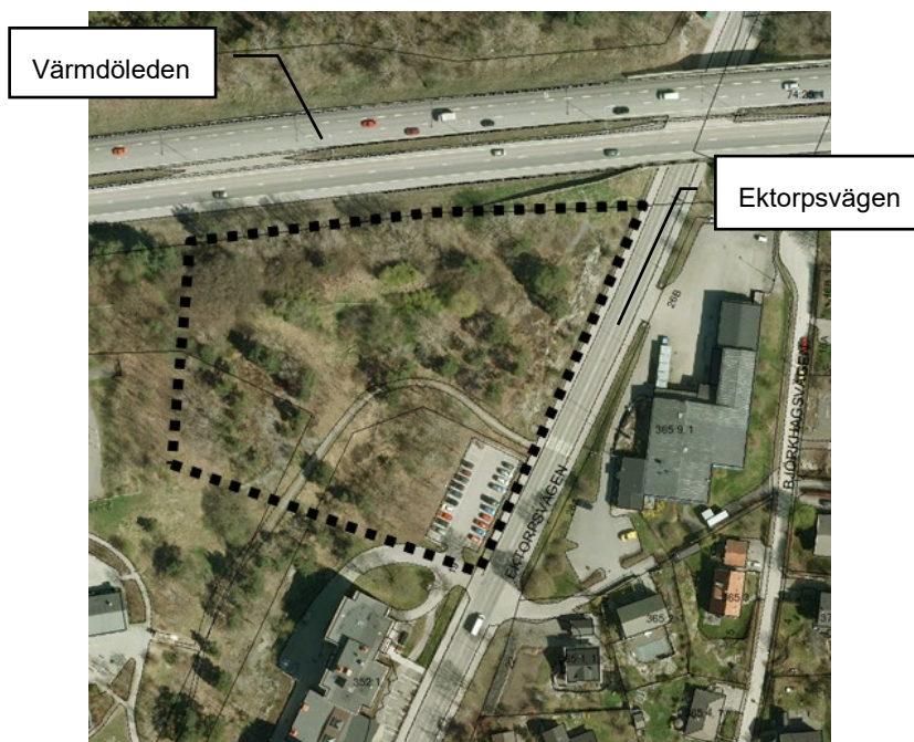
Planområdets ungefärliga läge markerat

Det aktuella området utsätts för mycket höga bullernivåer från trafiken främst på Värmdöleden men även från Ektorpsvägen, varför utformning och placering av byggnaderna är en viktig aspekt under planarbetet.