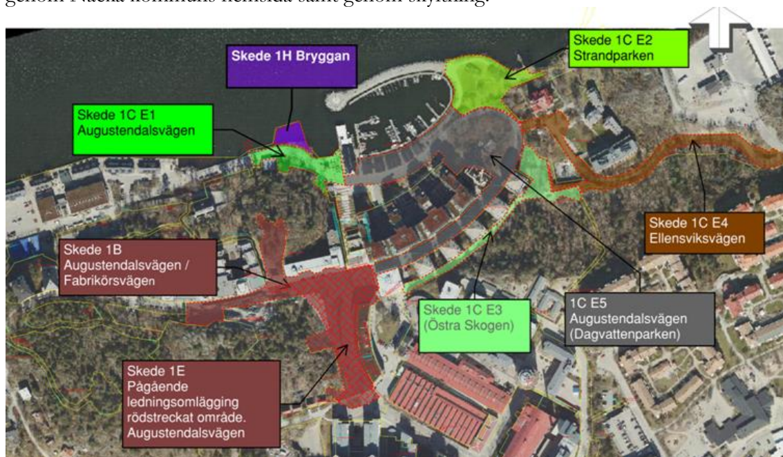
Bild 3: Visar samlad bild av kvarstående skeden och etappindelningar för stadsbyggnadsprojektet

De allmänna anläggningarna som ska byggas inom stadsbyggnadsprojektet är del av Augustendalsvägen, Ellensviksvägen, ledningsomläggning, dagvattenpark, angöringsbrygga, strandpark, JV Svensson torg, lekplats samt grönytor, se bild 3. Kommunen är ansvarig för utbyggnad av kommunala allmänna anläggningar som gata och park samt allmänna anläggningar avseende vatten och avlopp inom området. Övriga ledningsslag (fiber, fjärrvärme, el) anläggs av respektive ledningsägare samordnat med kommunens entreprenader. Utbyggnaden har startat hösten 2022 och beräknas vara klar 2031. Under byggtiden kommer provisoriska åtgärder behövas för JV Svenssons torg och intilliggande cirkulationsplats. Närboende och de som arbetare och besöker området kan uppleva störningar av buller, vibrationer och trafikomläggningar. Störningar ska minimeras i möjligaste mån och information till tredje man kommer ske fortlöpande genom Nacka kommuns hemsida samt genom skyltning.