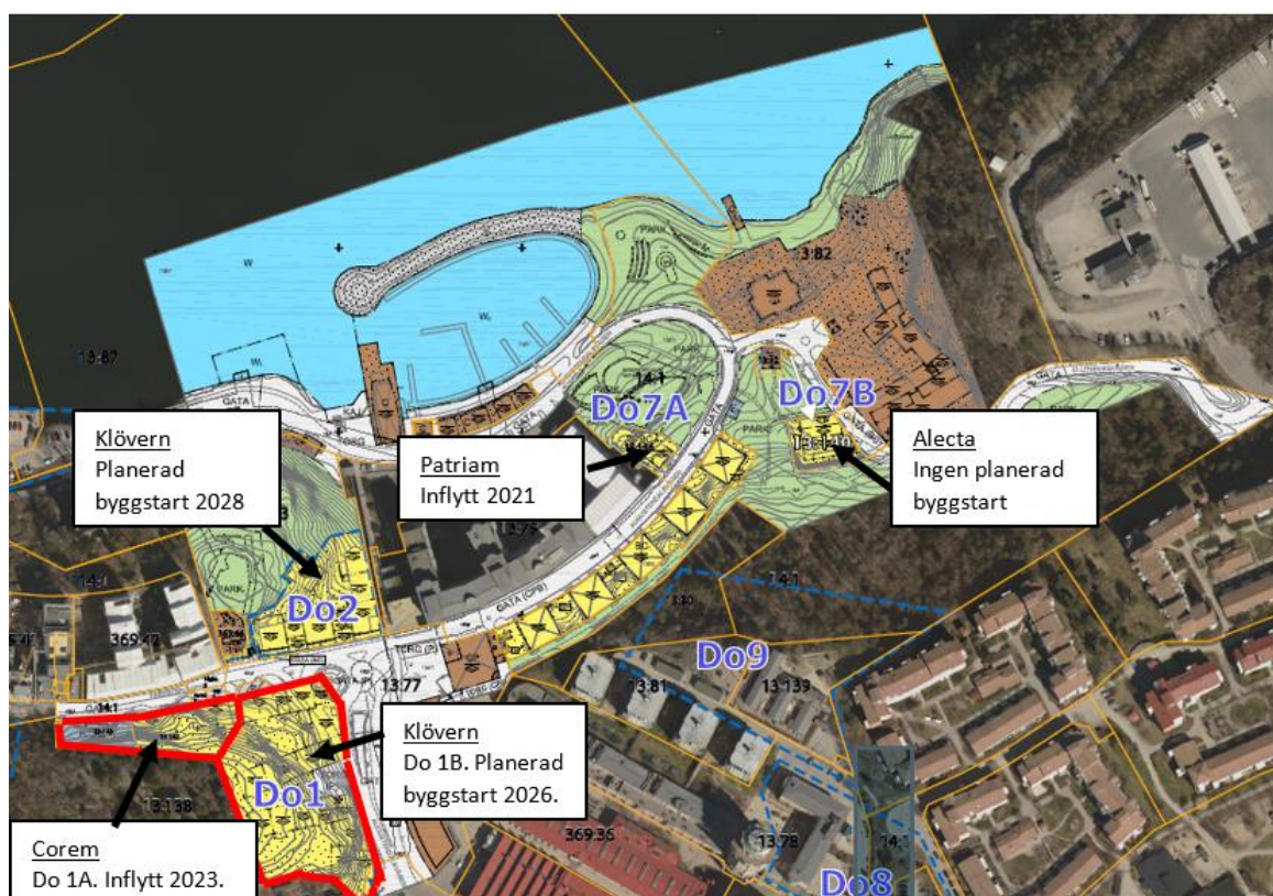
Bild 2: Visar delområden markerade med blå begränsningslinje. Delområdena inom delområdena är markerade med röd begränsningslinje.

Detaljplanen möjliggör för då uppskattningsvis cirka 300 nya bostäder och cirka 2 000 kvadratmeter nya verksamhetslokaler. Exploatörerna Klöver AB, Corem AB och Alecta AB ansvarar för utbyggnad av de nya bostadskvarteren, se bild 2. Antalet bostäder kan komma att förändras då uppskattningen är gjord med hänsyn till en schablonstorlek på en lägenhet. Den senaste prognosen gällande antal bostäder som är gjord utifrån inhämtande av uppgifter från exploatörerna redovisar att exploatörerna planerar att uppföra totalt cirka 820 bostäder.